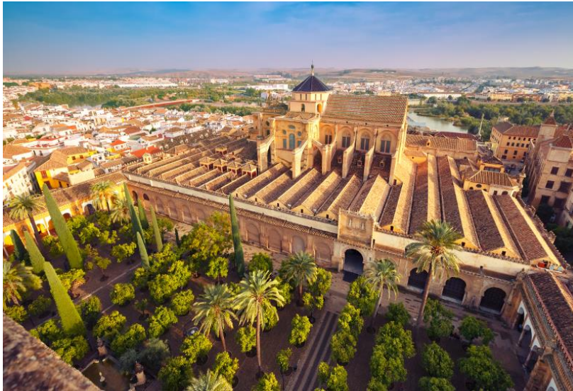
Slika 14. Džamija-katedrala "Mezquita" u Cordobi