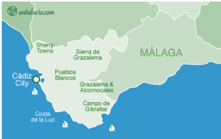
Slika 4. Geografski položaj provincije Cadiz