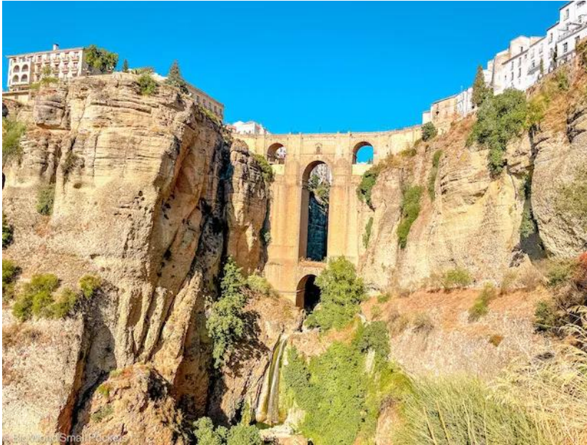
Slika 13. Rondin most "El Puente Nuevo"