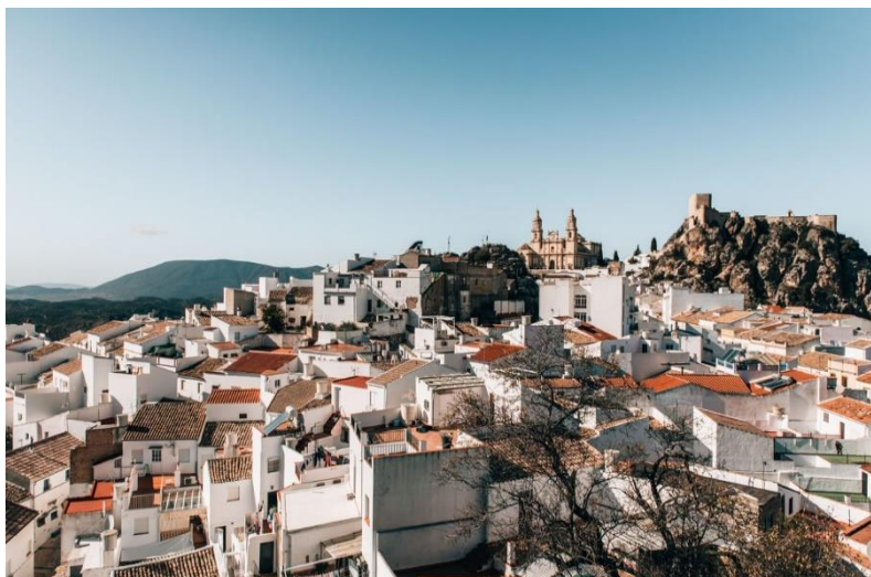
Slika 18. Bijela sela - "Los Pueblos Blancos"