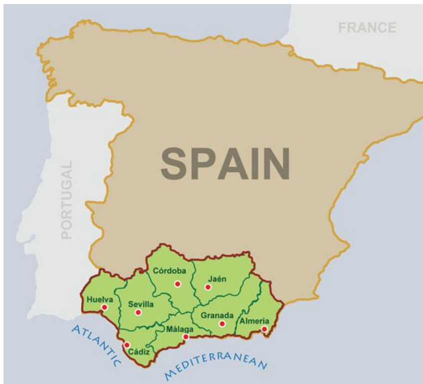
Slika 2. Geografski položaj Andaluzije i njenih provincija