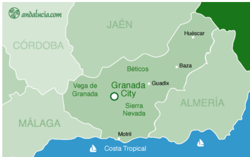
Slika 6. Geografski položaj provincije Granada