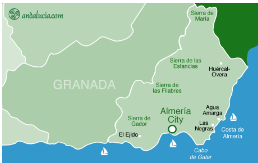
Slika 3. Geografski položaj provincije Almeria