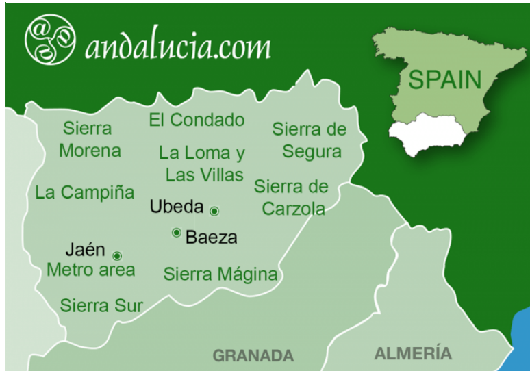
Slika 8. Geografski položaj provincije Jaen