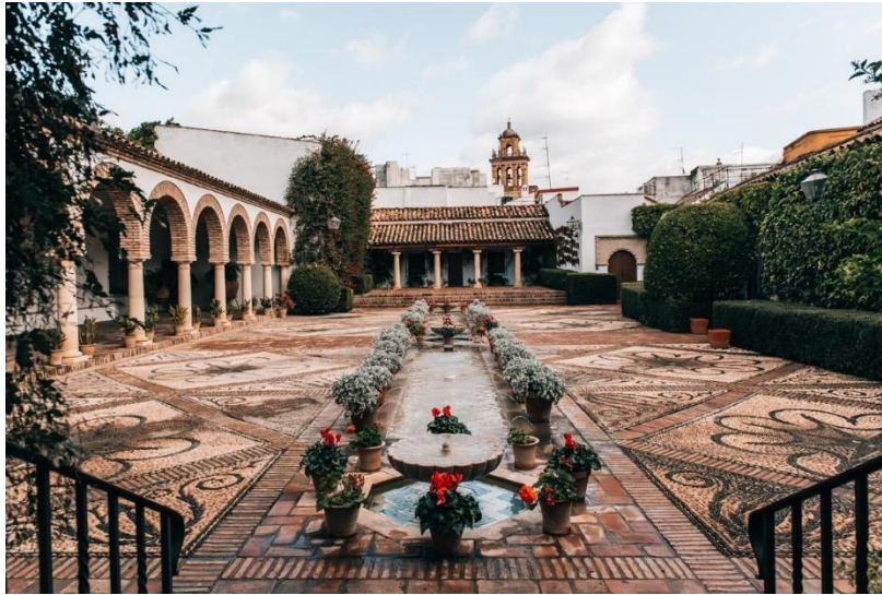
Slika 19. Palača "Palacio de Viana" u Cordobi