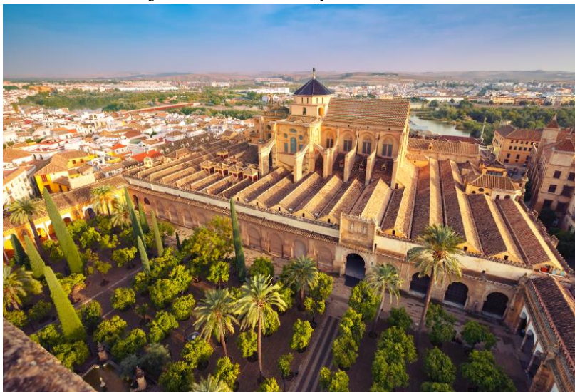
Slika 14. Džamija-katedrala "Mezquita" u Cordobi