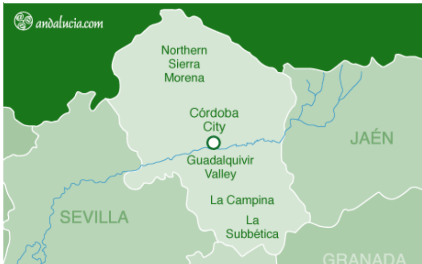
Slika 5. Geografski položaj provincije Cordoba