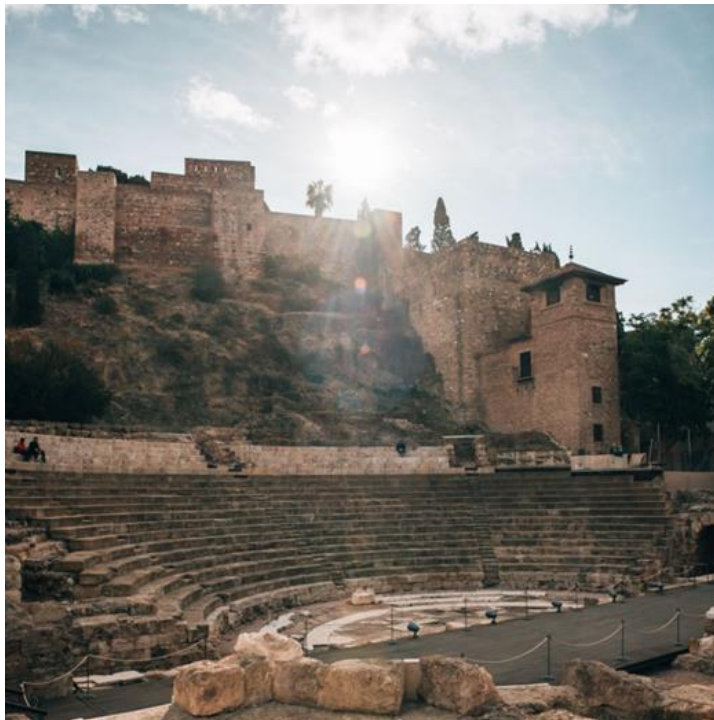
Slika 17. Palača Alcazaba i Teatro Romano