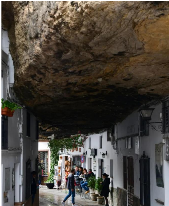
Slika 23. "Senetil de las Bodegas" - grad dijelom uklesan u stijene