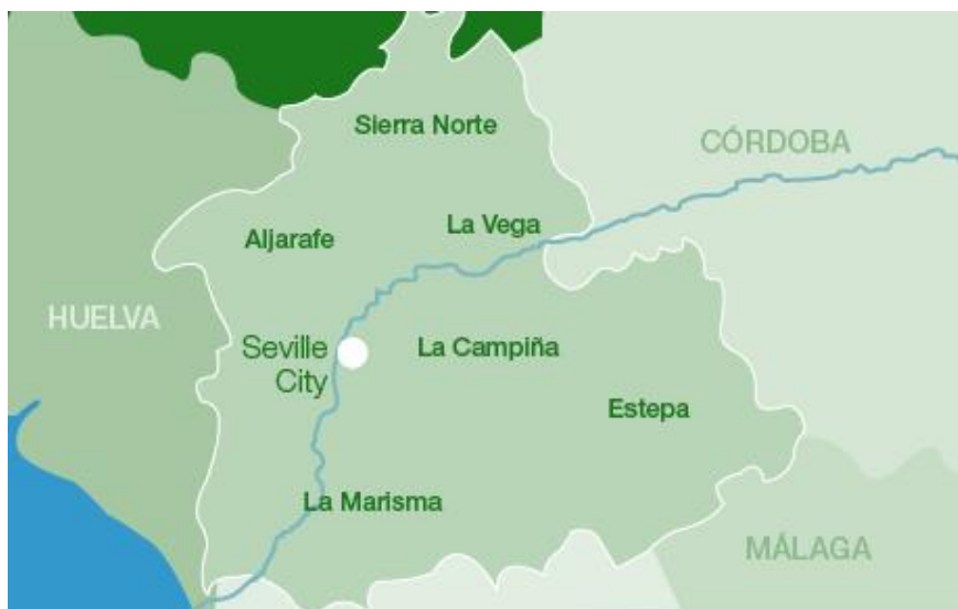
Slika 10. Geografski položaj provincije Sevilla