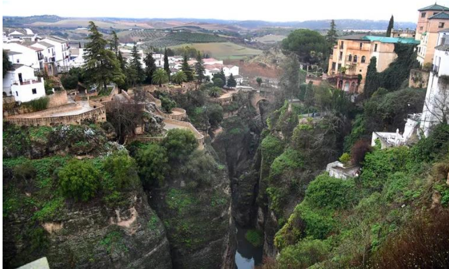
Slika 24. Grad Ronda