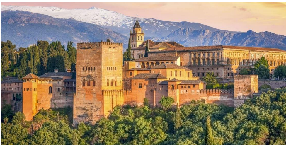
Slika 15. Palača Alhambra u Granadi