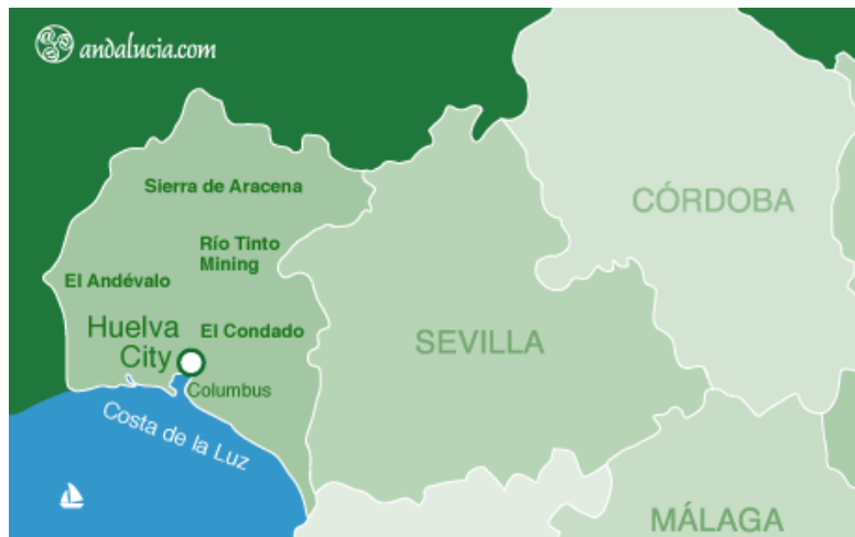
Slika 7. Geografski položaj provincije Huelva

Izvor: https://www.andalucia.com/province/huelva/home.htm (13.07.2022.)