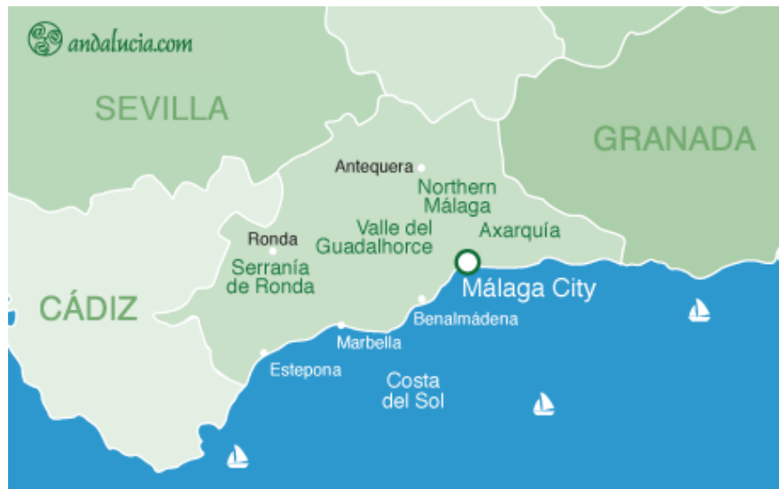
Slika 9. Geografski položaj provincije Malaga