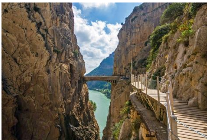
Slika 12. Viseća staza "Caminito Del Rey"