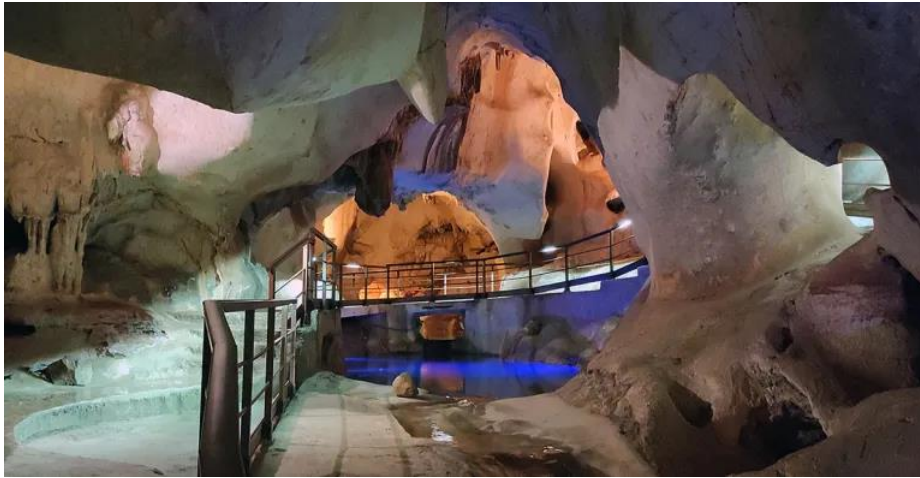
Slika 21. Špilja "Cueva del Tesoro"