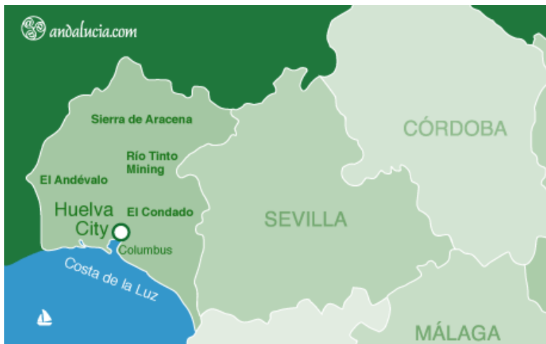
Slika 7. Geografski položaj provincije Huelva

Izvor: https://www.andalucia.com/province/huelva/home.htm (13.07.2022.)