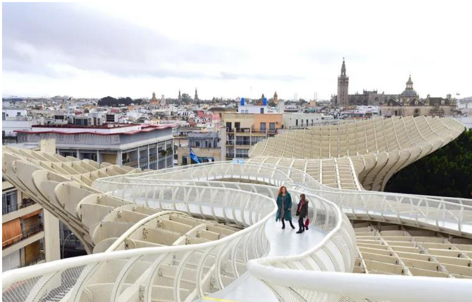
Slika 22. Šetnica "Setas de Sevilla"