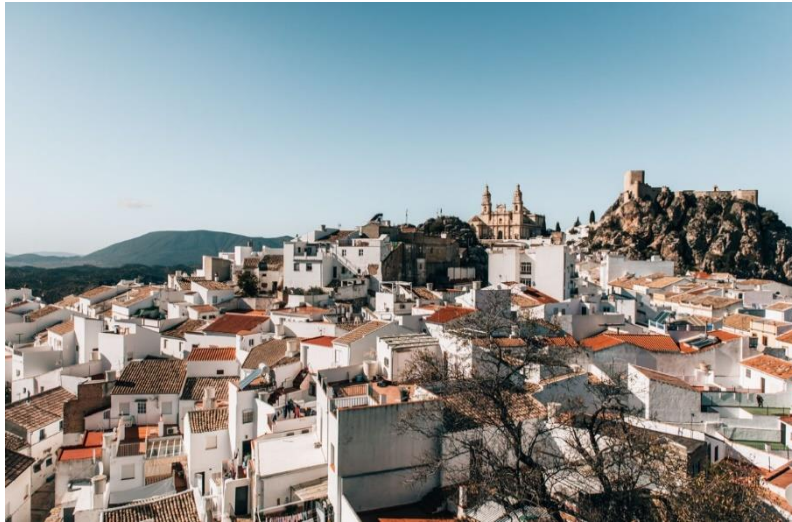
Slika 18. Bijela sela - "Los Pueblos Blancos"