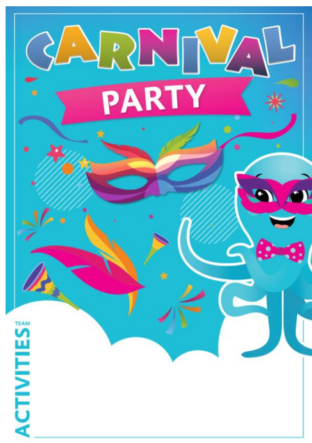
Slika 3 Primjer vizuala plakata za tematski dan