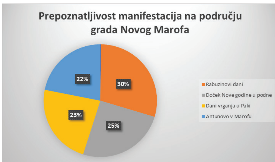
Grafikon 4. Prepoznatljivost manifestacija na području grada Novog Marofa

(41,1%), Dani vrganja u Paki (37,7%), a tek onda Antunovo v Marofu (35,6%). S obzirom na to da je to prema trajanju najdulja manifestacija, ali i najveća, taj podatak malo iznenađuje, ali i dokazuje da tematske manifestacije imaju veću pozornost i percipiraju se kao brend destinacije, više nego što to čini manifestacija koja se veže uz Dane grada. Šic na bic prepoznat je kao rekreacijska manifestacija, kao i Cross liga Čevo, a u rezultatima još se pokazuju i Sastanak u traperu, Dani pere te pod Neka druga navodi se Valentinovo uz klape.