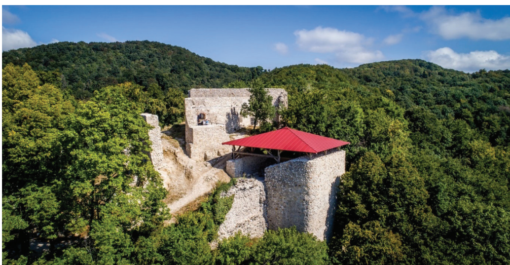
Slika 2. Utvrda Grebengrad