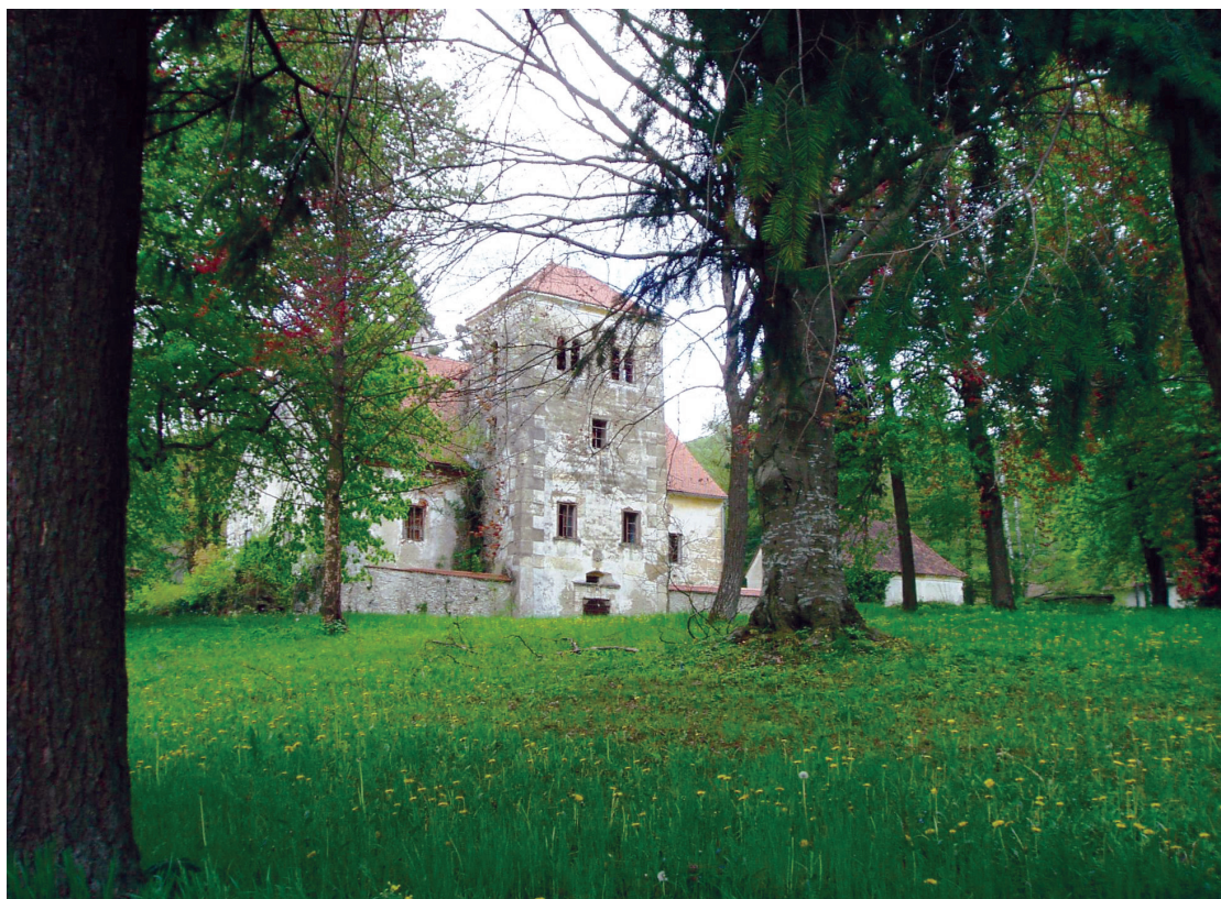
Slika 5. Dvorac Bela I