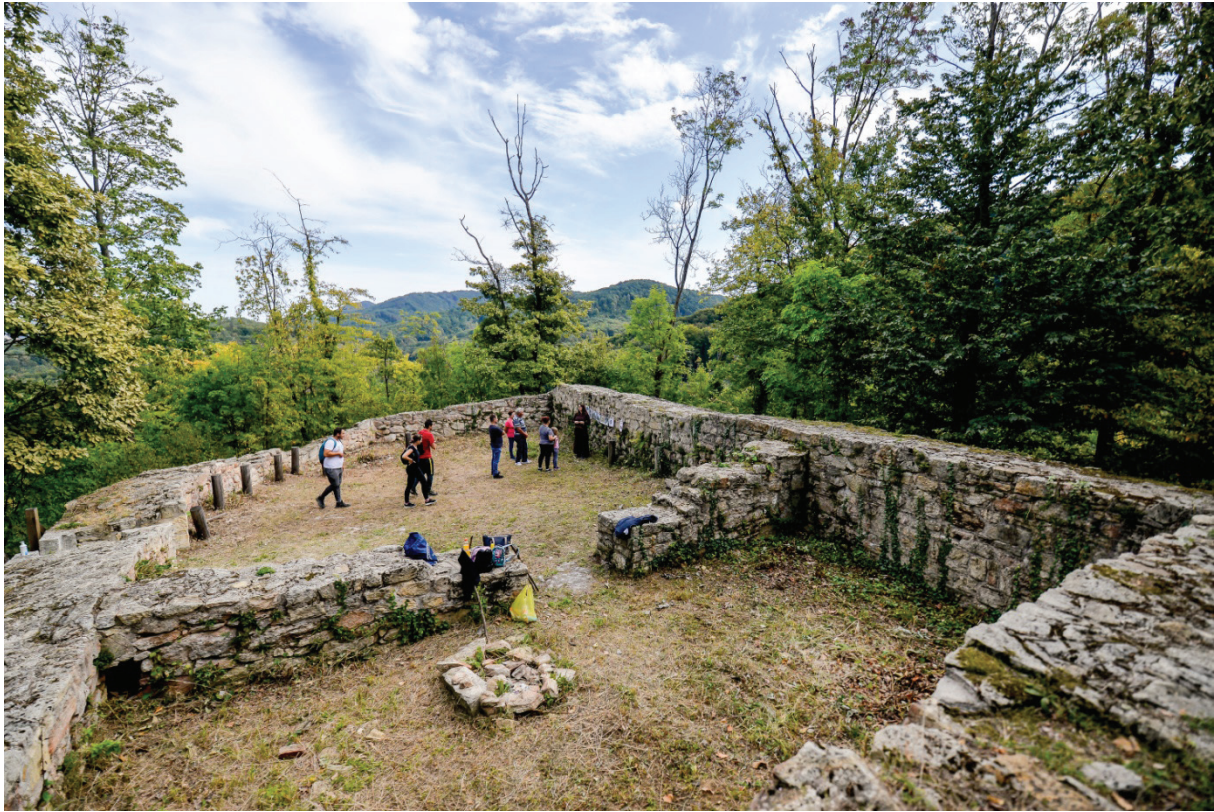
Slika 7. Utvrda Paka