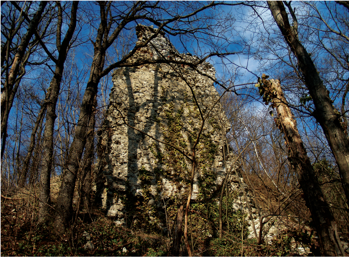
Slika 6. Pusta Bela