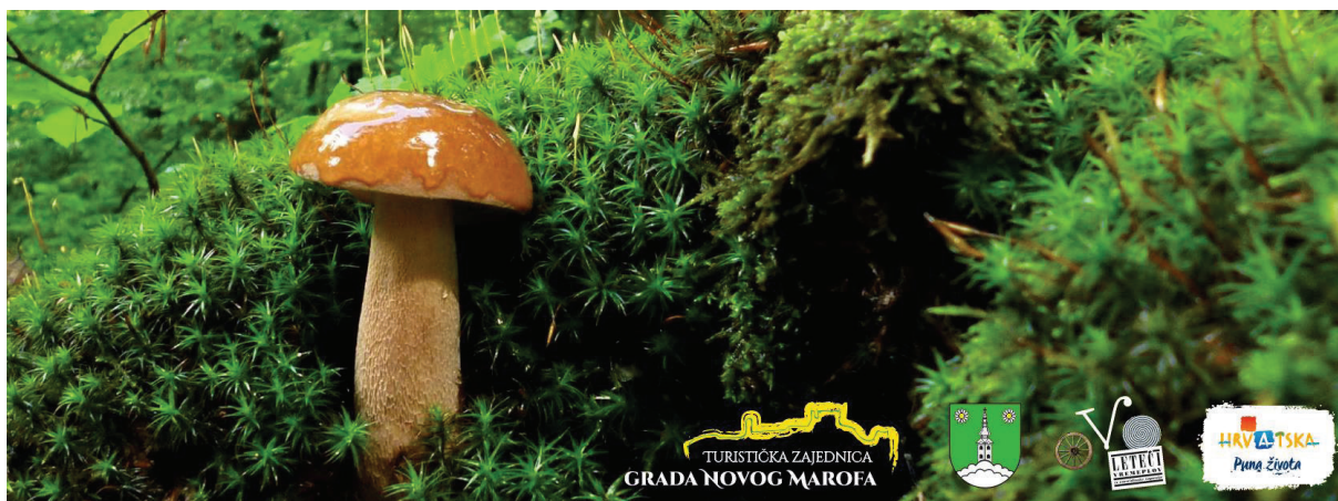
Slika 12. Najavna fotografija za društvene mreže Dani vrganja u Paki