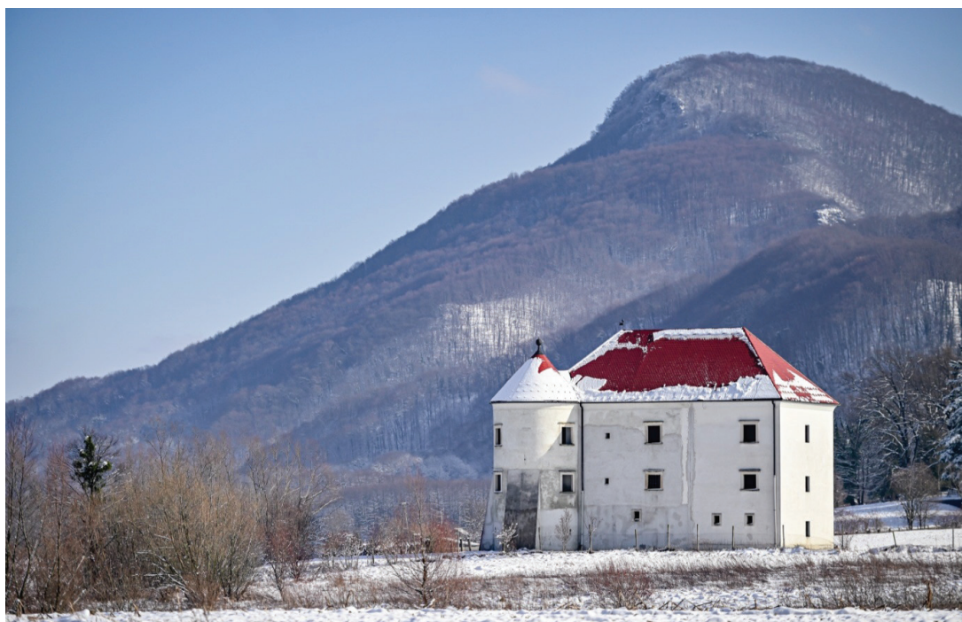
Slika 4. Dvorac Bela II