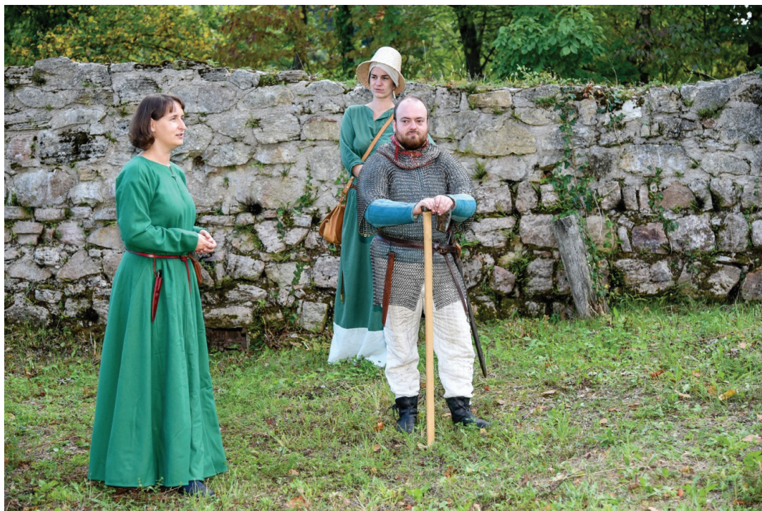
Slika 13. Kostimirano vođenje Utvrde Paka