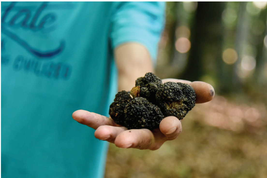
Slika 14. Lov na crni tartuf u Paki