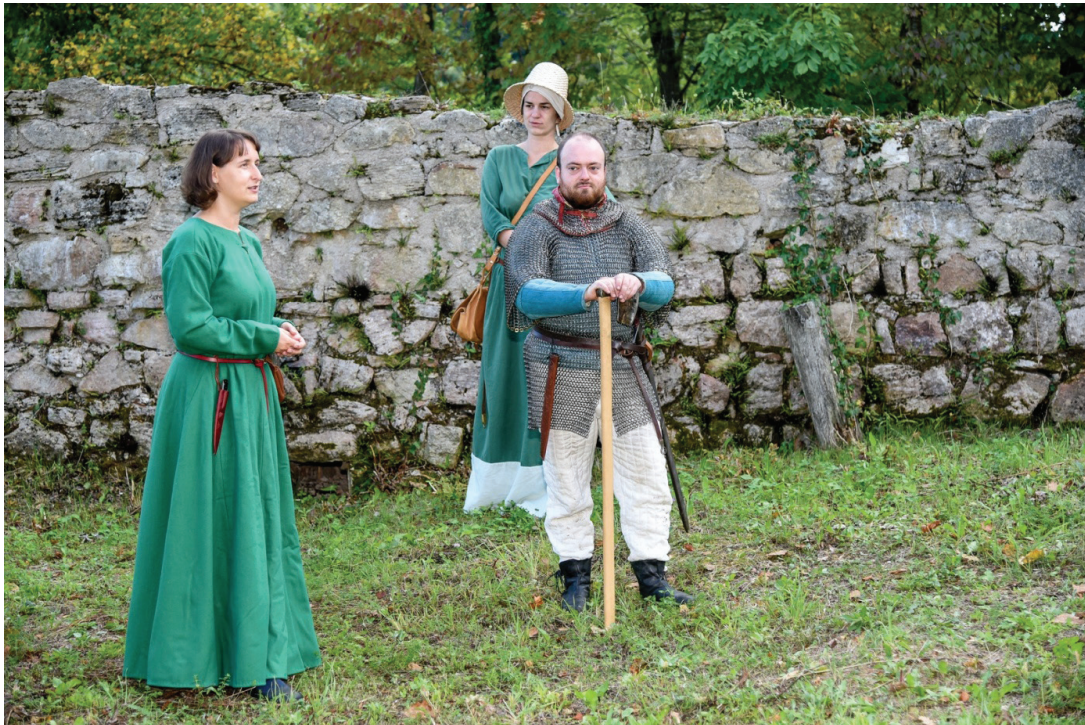
Slika 13. Kostimirano vođenje Utvrde Paka