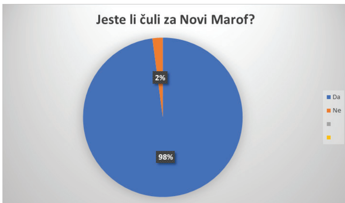
Grafikon 2. Jeste li čuli za Novi Marof?