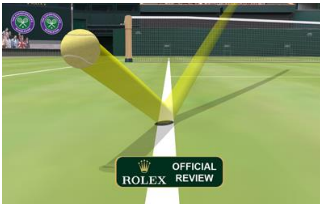
Slika 1. Primjer korištenja hawk-eye tehnologije u tenisu