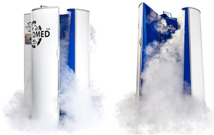
Slika 4. Kriokomora