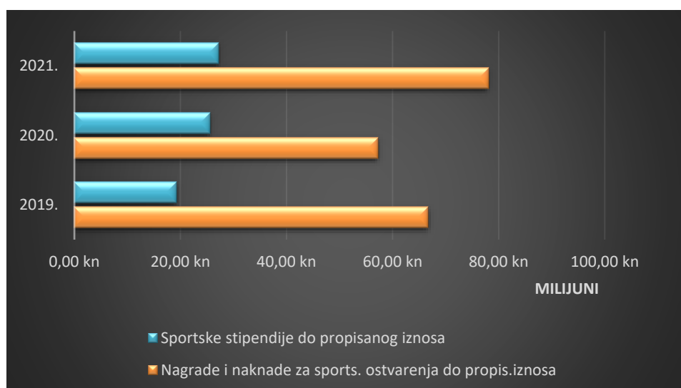
Slika 4: Odnos isplaćenih neoporezivih primitaka s osnove nagrada za sportska dostignuća i sportskih stipendija od 2019. do 2021. godine