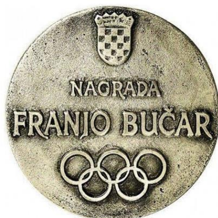
Slika 1: Državna nagrada za sport "Franjo Bučar"