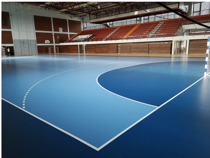
Slika 4. Unutrašnji izgled dvorane Europskih prvaka