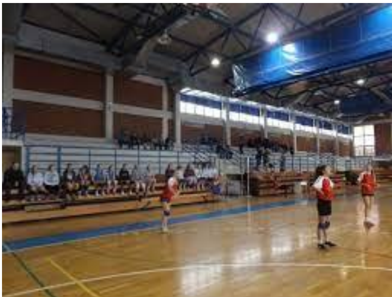
Slika 8. Unutrašnji izgled dvorane Srednjoškolskog centra Bjelovar