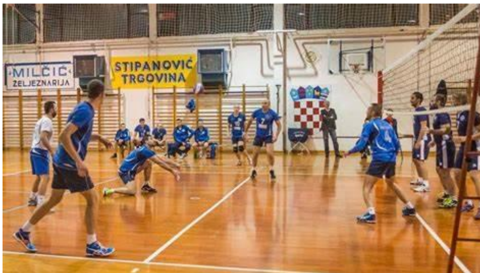
Slika 12. Unutrašnji izgled školsko sportske dvorane u Čazmi