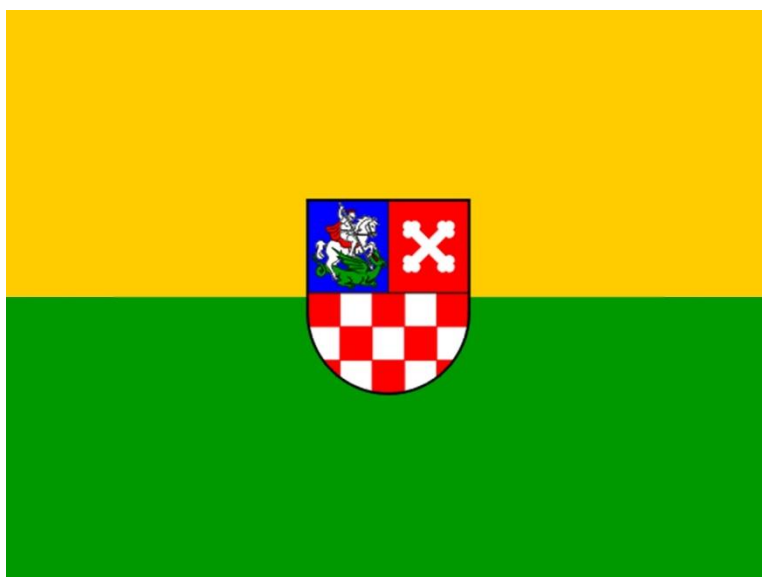
Slika 1. Grb Bjelovarsko-bilogorske županije