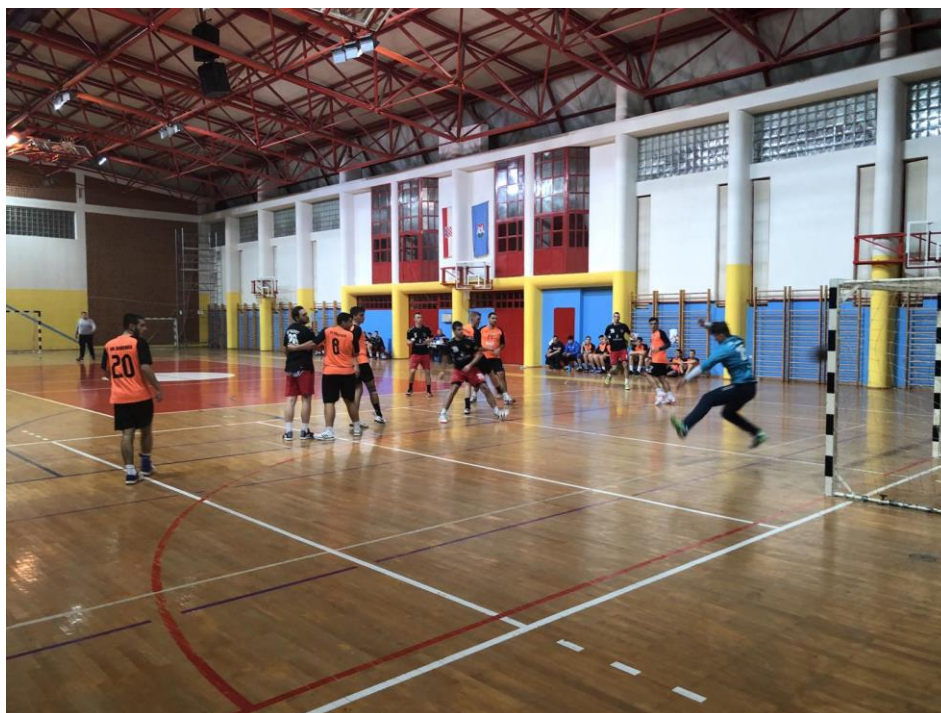
Slika 9. Unutrašnji izgled Gradske sportske Dvorane Daruvar