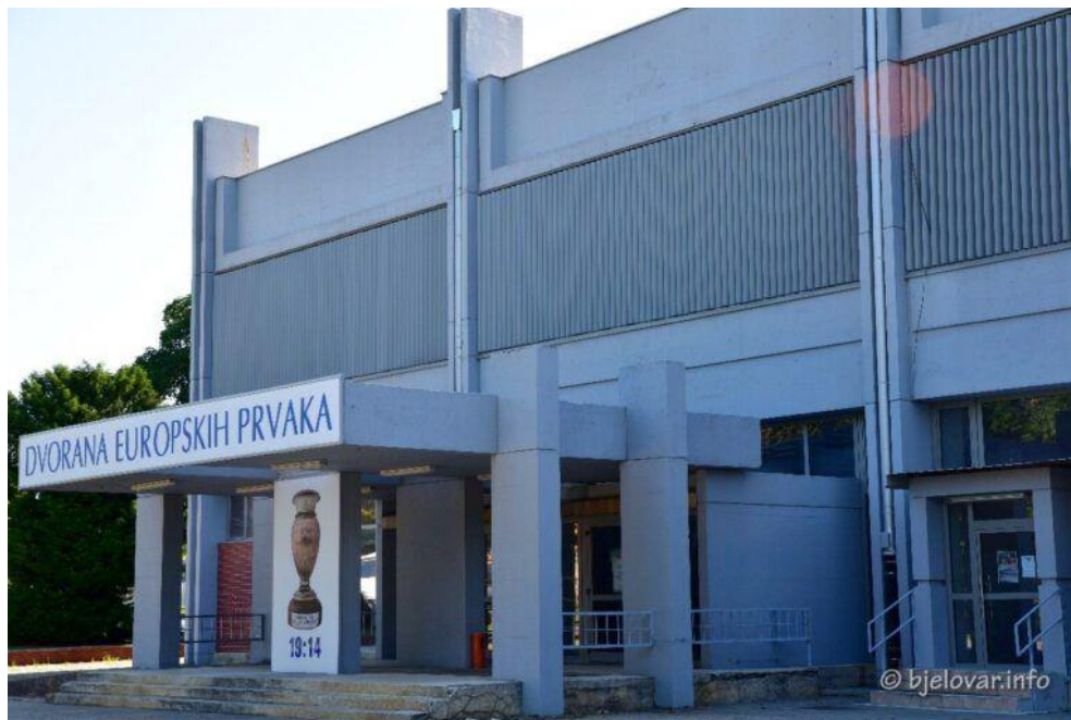
Slika 3. Vanjski izgled Dvorane Europskih prvaka