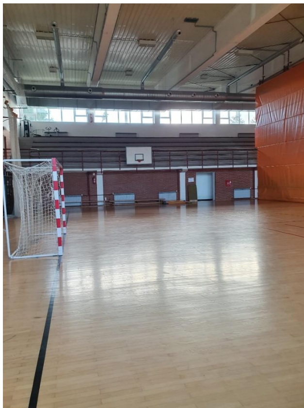
Slika 11. Unutrašnji izgled sportske dvorane Grubišno polje