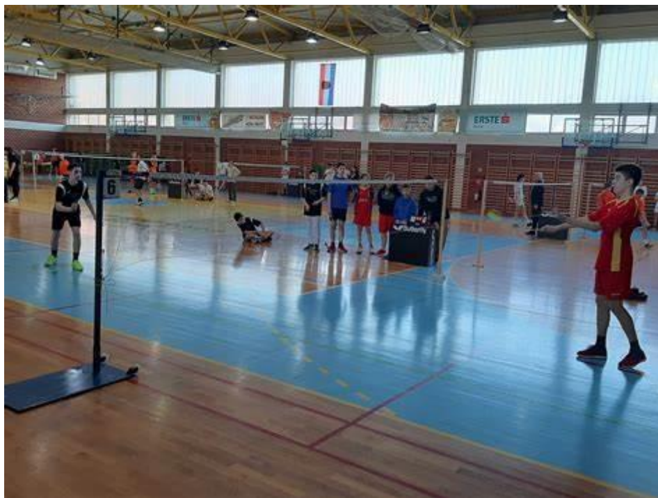
Slika 6. Unutrašnjost školsko-sportske dvorane 1. osnovne škole Bjelovar