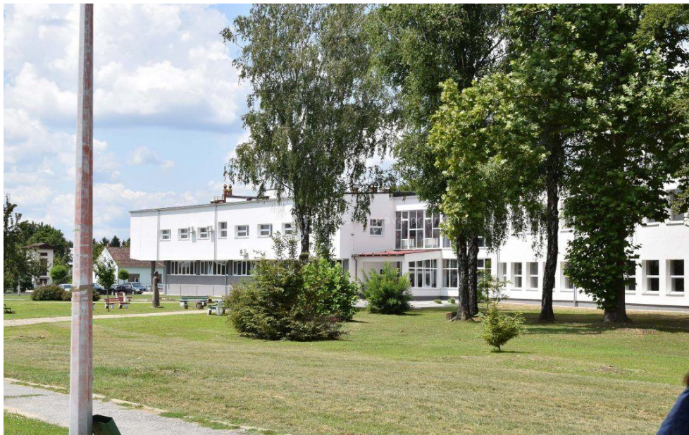
Slika 10. Vanjski izgled Sportske dvorane Grubišno polje