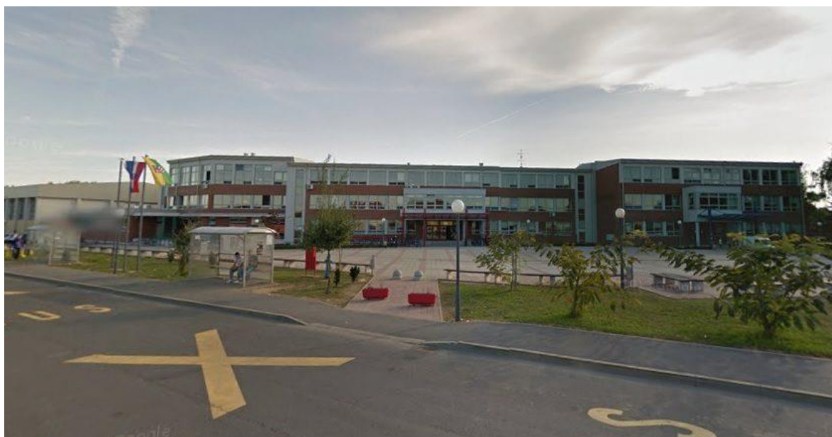
Slika 7. Vanjski izgled dvorane Srednjoškolskog centra Bjelovar

Dvorana Srednjoškolskog centra prostire se na 2 306 m 2 , a ima 500 sjedećih mjesta. Korisnici dvorane su učenici srednjih škola (Medicinska škola Bjelovar, Ekonomska i birotehnička škola Bjelovar, Komercijalna i trgovačka škola Bjelovar te Turističko-ugostiteljska i prehrambena škola Bjelovar). Dvorana se također u večernjim satima koristi za razne sportove, a to su: mali nogomet, rukomet, košarka. Dvoranu također koristi i Mali olimpijac, univerzalna sportska akademija za djecu.