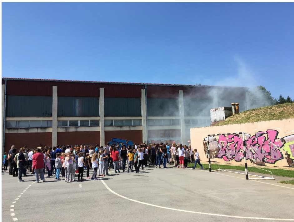
Slika 5. Vanjski izgled Školsko-sportske dvorane 1. osnovne škole Bjelovar

Sljedeće slike prikazuju vanjski i unutrašnji izgled Školsko-sportske dvorane 1. osnovne škole Bjelovar.