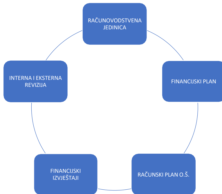
Slika 1 Elementi računovodstva osnovne škole

Na slici 1 prikazani su glavni elementi računovodstva osnovne škole, a to su: računovodstvena jedinica, financijski plan, računski plan škole, financijski izvještaji i interna i eksterna revizija. U daljnjem tekstu navedeni elementi bit će razrađeni.