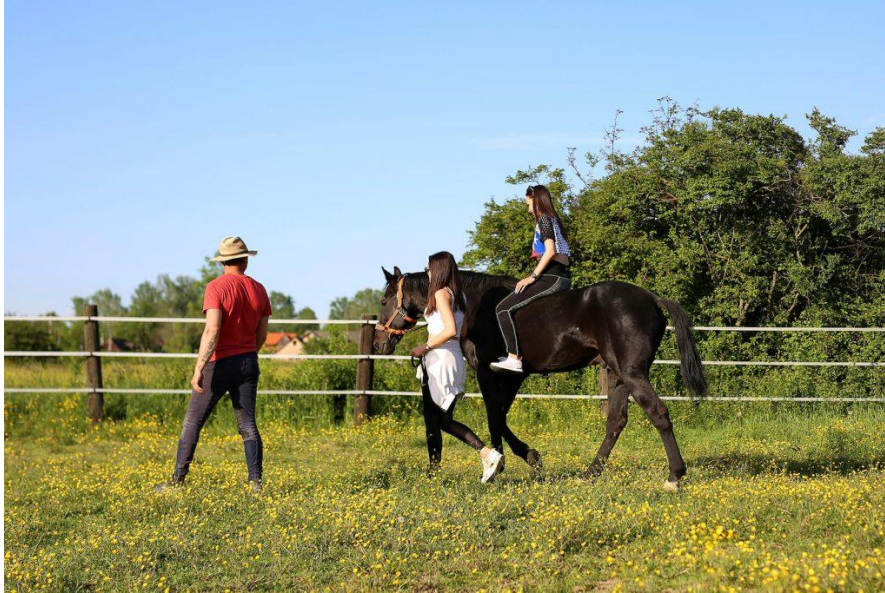
Slika 5. Jahanje u Zagrebačkoj županiji