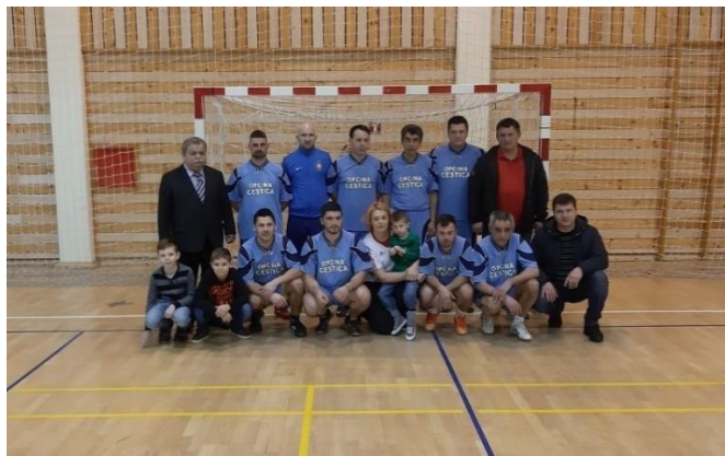
Slika 4. Jedan od polufinalista na lepoglavskom turniru

Izvor: https://www.varazdinske-vijesti.hr/sport/sutra-veliko-finale-na-lepoglavskom-malonogometnom-turniru- pristupljeno 3.06.2023.)