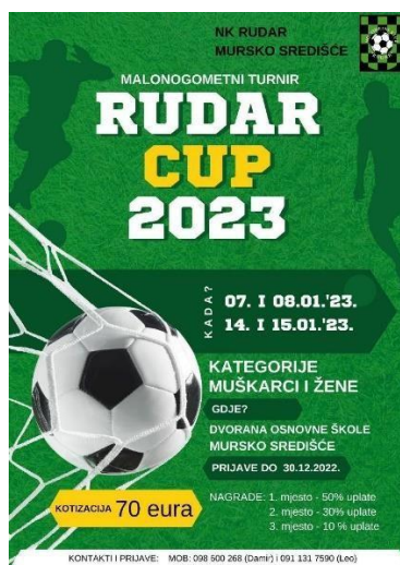
Slika 9. Plakat-poziv na turnir u Murskom Središću