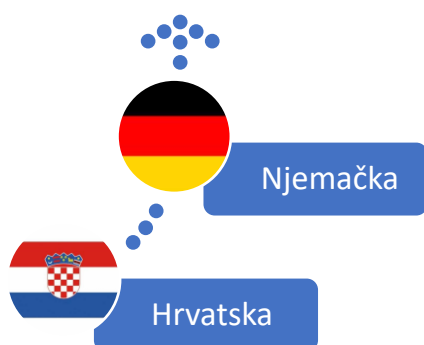
Slika 3. Predsjedavajuće države članice 2020. godine

Predsjedanje Republike Hrvatske Vijećem Europske unije započelo je 1. siječnja i trajalo je do 30. lipnja 2020. godine ( https://www.consilium.europa.eu/hr/council-eu/presidency-council-eu/timeline-presidencies-of-the-council-of-the-eu/ ). Četiri ključne stavke na kojima je Republika Hrvatska radila predsjedajući Vijećem Europske unije bile su Europa koja se razvija, povezuje, štiti i Europa koja se razvija ( https://eu2020.hr/Home/Custom?code=Priorities ). Predsjedanje Njemačke započelo je 1. srpnja i trajalo je sve do 31. prosinca 2020. godine. Njemačka je bila dio predsjedavajuće trojke zajedno s Portugalom i Slovenijom s kojima je radila na prevladavanju pandemije bolesti COVID-19. Temeljni prioritet Njemačke bio je naglasak na jačoj i snažnijoj Europi, koja je pravedna, održiva, sigurna i koja poštuje zajedničke vrijednosti. Najveći naglasak je stavljen na gospodarski oporavak Europske unije ( https://www.consilium.europa.eu/media/56254/2020-jul-dec-de-priorities.pdf ).