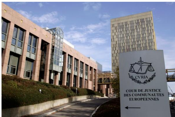
Slika 1. Zgrada Suda pravde Europske unije

Europski sud pravde je institucija koja se najviše razlikuje u odnosu na sve druge institucije, kako po svojoj funkciji, tako i u odnosu prema drugim institucijama Europske unije. Temeljne funkcije Suda pravde su osigurati forum za rješavanje nesporazuma između država članica, osigurati učinkovitu primjenu prava kao i zaštititi prava Europske unije (Bašić, 2015).