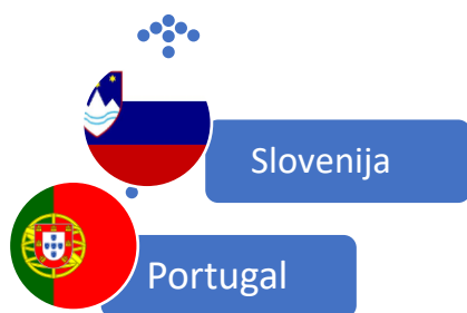
Slika 4. Predsjedavajuće države članice 2021. godine

Portugal je započeo predsjedanje Vijećem Europske unije početkom 2021. godine. „Portugalsko predsjedništvo bilo je usmjereno na promicanje oporavka Europe, klimatizaciju i digitalnu tranziciju, provedbu stupa socijalnih prava Europske unije i jačanje strateške autonomije Europe. Slovensko predsjedništvo bilo je usmjereno na oporavak Europske unije i jačanje njegove otpornosti, promišljanje o budućnosti Europe te jačanje vladavine prava i europskih vrijednosti i povećanje sigurnosti i stabilnosti u europskom susjedstvu.“ ( https://www.consilium.europa.eu/hr/council-eu/presidency-council-eu/timeline-presidencies-of-the-council-of-the-eu/ ).