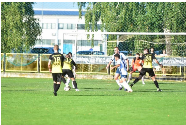
Slika 2. Utakmica amaterskog nogometa