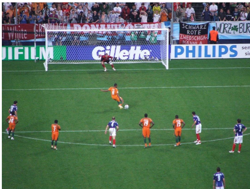
Slika 1. Jedanaesterac u nogometu

Izvor: https://www.vecernji.hr/sport/jedanaesterac-vise-nije-najstroza-kazna-realizira-ih-se-samo-62-posto-1189184 (23.08.2023.)