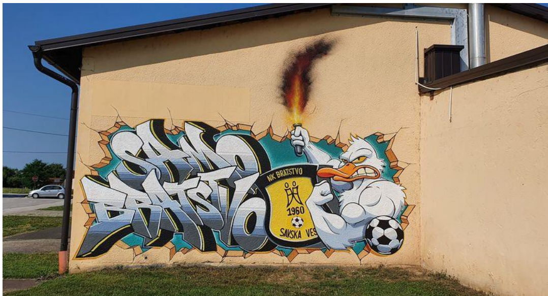
Slika 3. Grafit na prostorijama nogometnog kluba „Bratstva“ iz Savske Vesi