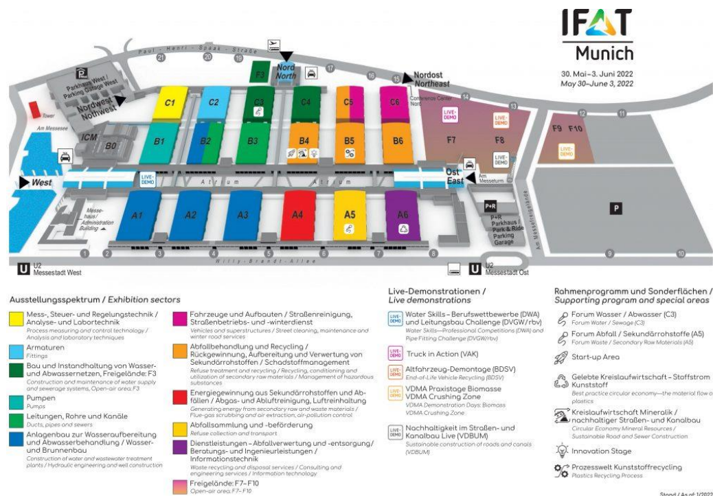
Slika 2 Plan paviljona sajma IFAT München 2022.

Izvor: https://belimpex.hr/sajam-ifat-2022-vodeci-medunarodni-sajam-zastite-okolisa/ (25.08.2023.)