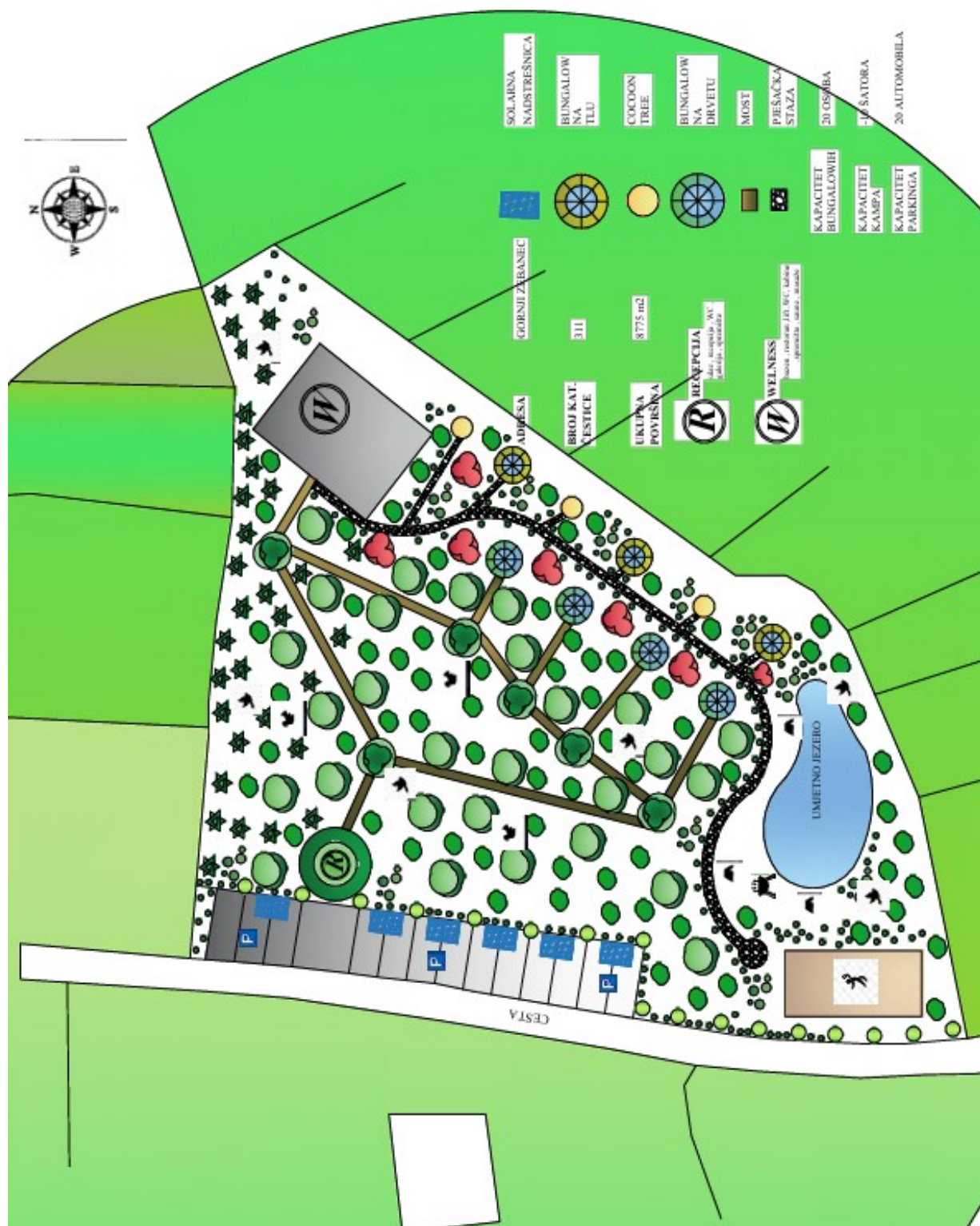
Slika 4. Situacijski plan resorta