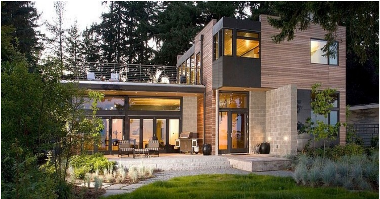
Slika 1. „The Ellis Residence“

Dobar je primjer održive arhitekture kuća „The Ellis Residence“.