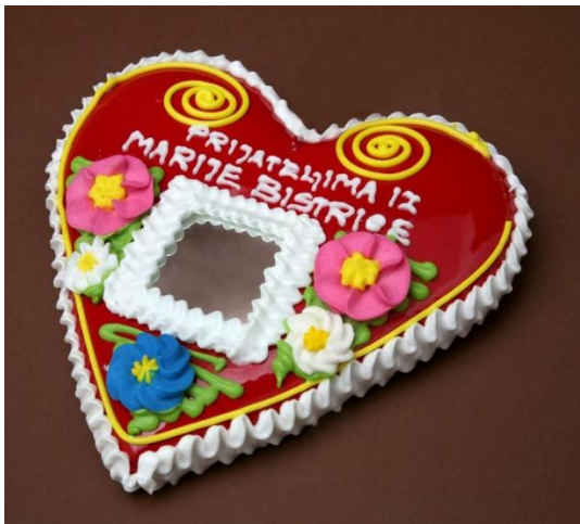
Slika 4. Licitar