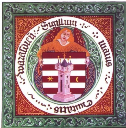
Slika 1. Grb grada Varaždina