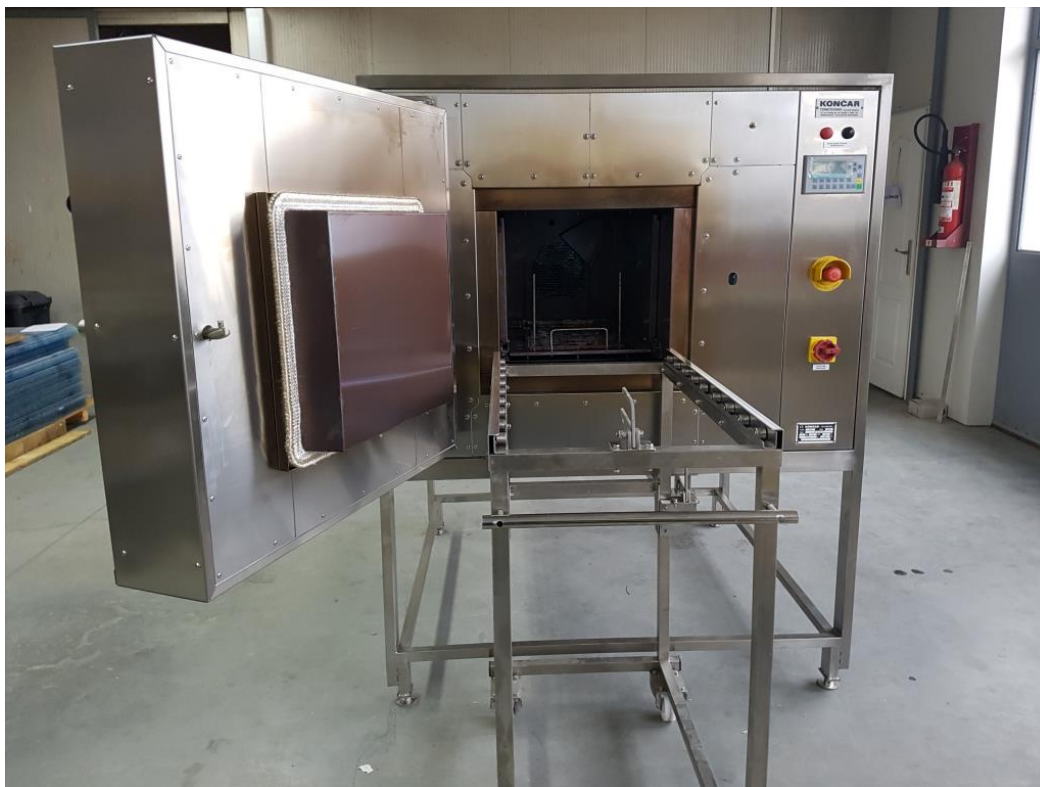
Slika 3. Laboratorijska peć