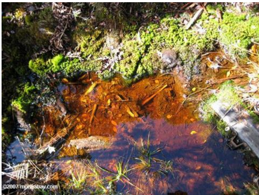
Slika 2. Obojenje vode u dodiru s lišćem