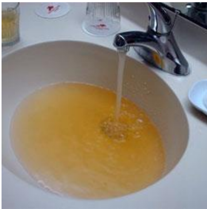
Slika 1. Voda koja sadrži okside željeza i mangana

Čest uzrok obojenih voda nepravilno je odlaganje otpada iz prehrambenih i kemijskih industrija, tvornica tekstila, papira te kao takve nisu povoljne za vodoopskrbu. Kada se govori o vodama u kojima je otopljena organska tvar, tada je bitno napomenuti da su takve vode većinom neugodnog mirisa i okusa, a istovremeno se sumnja da mogu izazvati kancerogenost. Obojena voda općenito je neupotrebljiva za vodoopskrbu i neke druge svrhe, a transparentnost je smanjena. Boja se mjeri fotometrijskim načinom. [5]