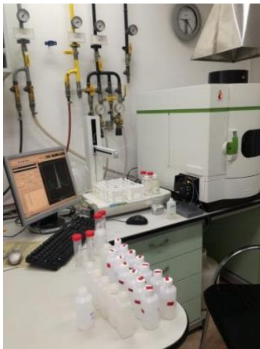
Slika 5. Ispitivanje teških metala (1)