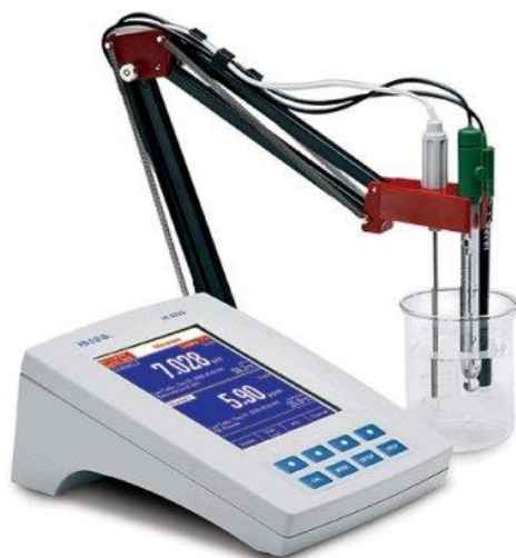
Slika 4. pH metar

Potrebno je na licu mjesta izmjeriti pH uzorka vode ili ga prenijeti u laboratorij u boci s čepom napunjenom do vrha kako se ne bi izgubio \text{CO}_2 .