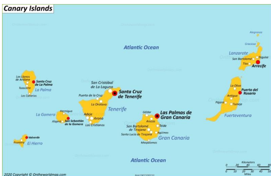
Slika 7. Otočje Kanari