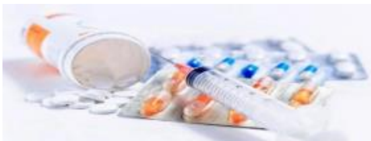
Slika 2 Steroidi u obliku tableta i injekcija

Izvor: https://body.ba/ishrana/suplementi/kako-djeluju-steroidi/1269 (10.6.2022.)