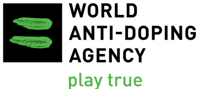
Slika 1 Logo WAD-e