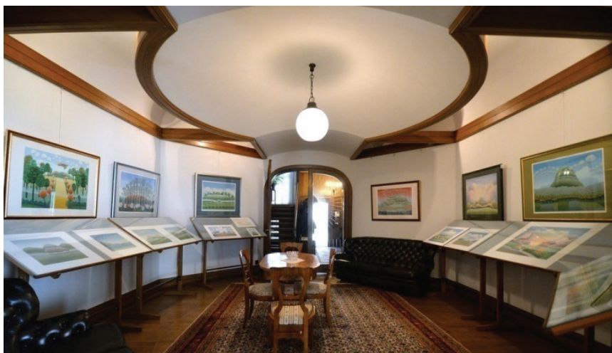
Slika 10. Kuća Ivana Rabuzina u Ključu