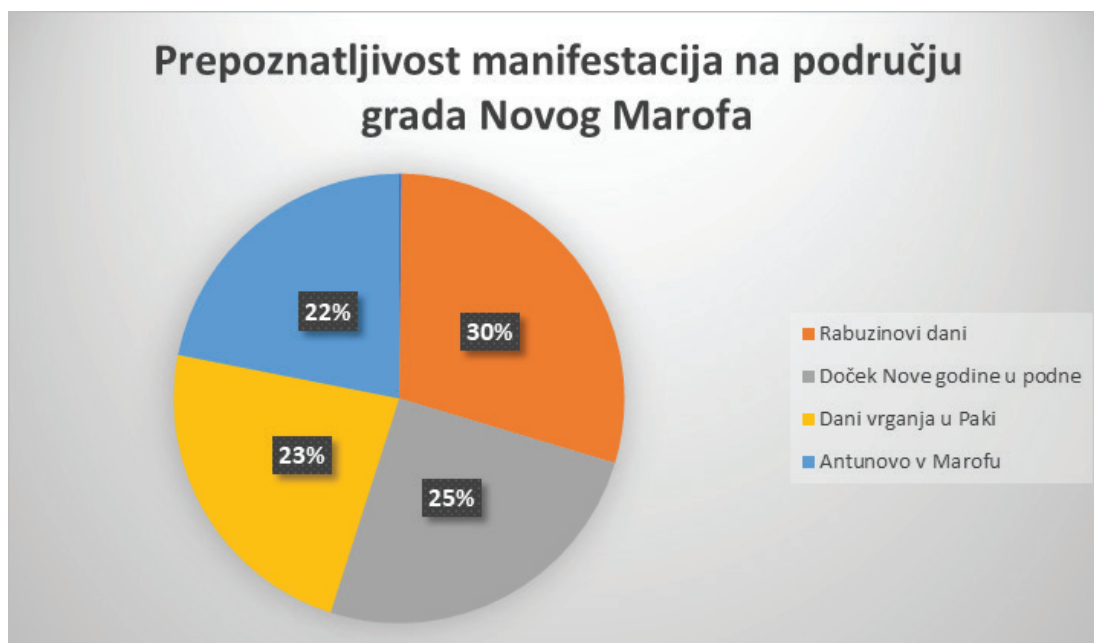
Grafikon 4. Prepoznatljivost manifestacija na području grada Novog Marofa

(41,1%), Dani vrganja u Paki (37,7%), a tek onda Antunovo v Marofu (35,6%). S obzirom na to da je to prema trajanju najdulja manifestacija, ali i najveća, taj podatak malo iznenađuje, ali i dokazuje da tematske manifestacije imaju veću pozornost i percipiraju se kao brend destinacije, više nego što to čini manifestacija koja se veže uz Dane grada. Šic na bic prepoznat je kao rekreacijska manifestacija, kao i Cross liga Čevo, a u rezultatima još se pokazuju i Sastanak u traperu, Dani pere te pod Neka druga navodi se Valentinovo uz klape.