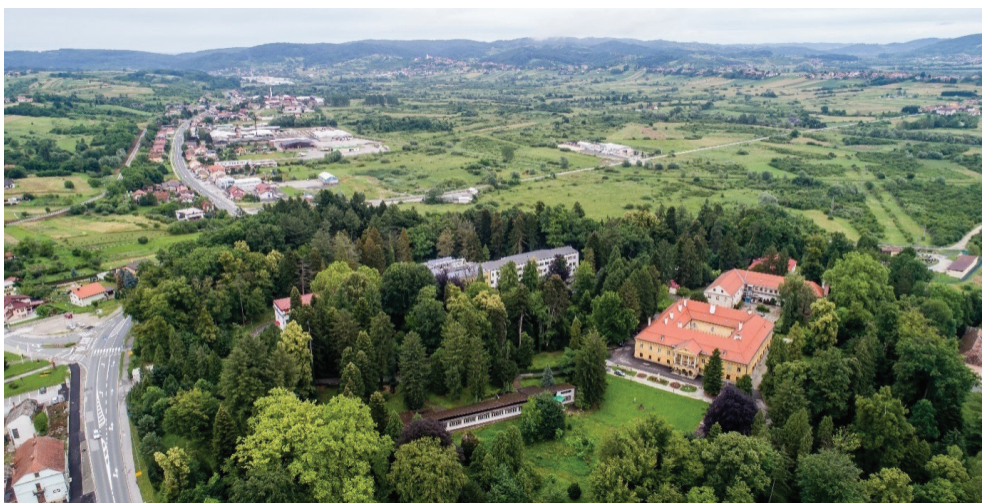
Slika 1. Dvorac i perivoj Erdödy u Novom Marofu