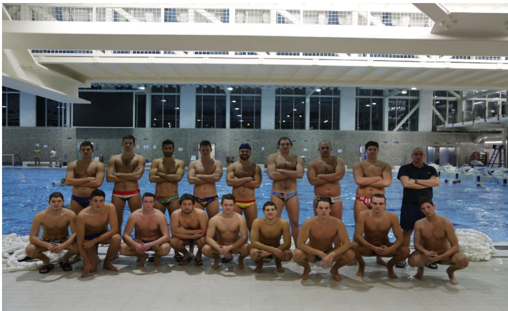
Slika 20. Ekipe Vk Medveščaka 2019. godine