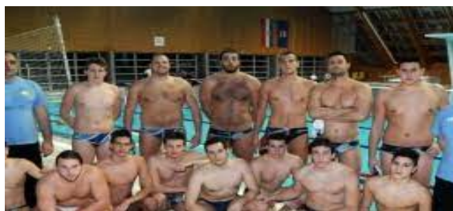
Slika 23. Ekipe VK Zadra 1952, 2015. godine

Izvor: https://www.zadarskilist.hr/taxonomy/term/3171