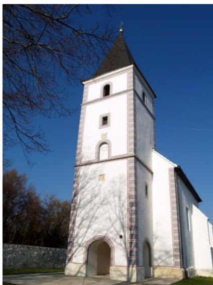
Slika 3. Kapela sv. Wolfganga, Vukovoj