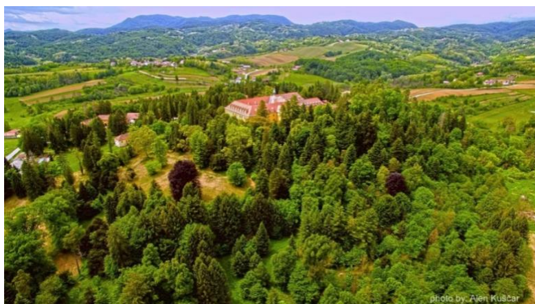
Slika 2. Dvorac Klenovnik i perivoj