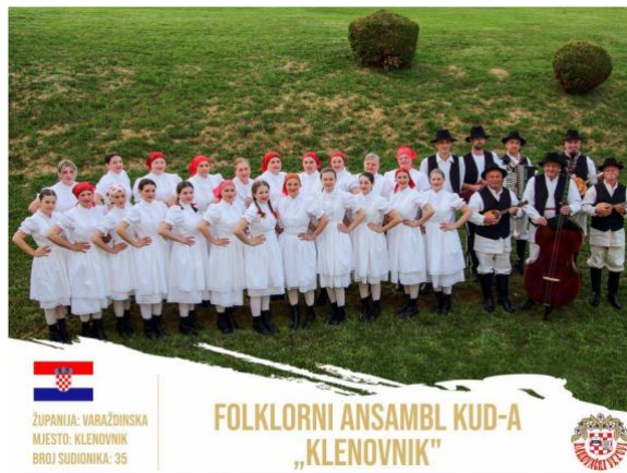
Slika 8. Sekcija KUD-a Klenovnik, folklorni ansambl

prehrambene i neprehrambene proizvode koji se izlažu i dijele posjetiteljima. Nadalje, iako je ovaj kraj poznat po lončarstvu, bačvarstvu i pletarstvu, danas nije ostalo mnogo potomaka koji su naslijedili zanat svojih obitelji i održali tradiciju izrade.