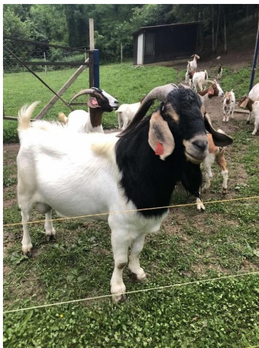
Slika 9. Burska koza