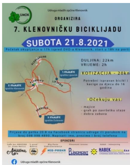
Slika 7. Plakat klenovničke biciklijade 2021. godine