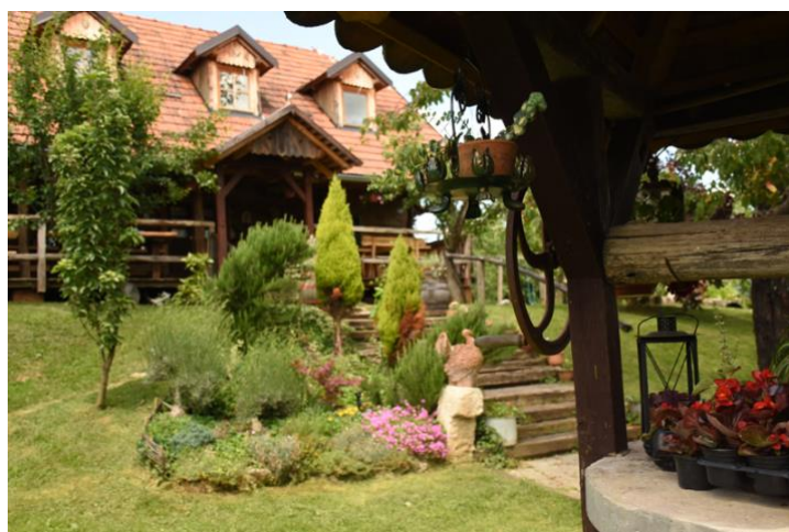
Slika 4. Seosko domaćinstvo "Grešna pilnica"