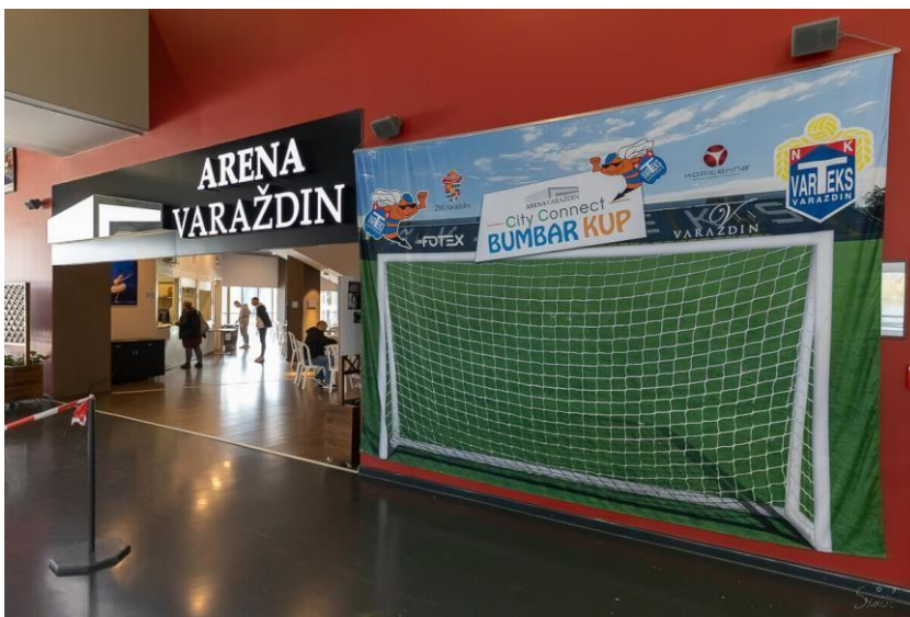
Slika3. Dvorana Arena u Varaždinu