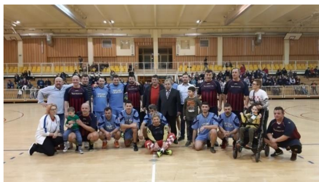
Slika5. Turnir u Cestici