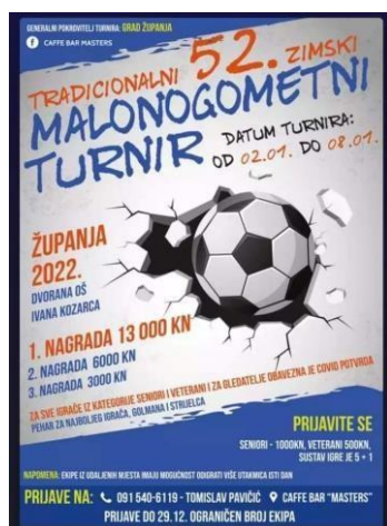
Slika 14. Zimski malonogometni turnir Županja