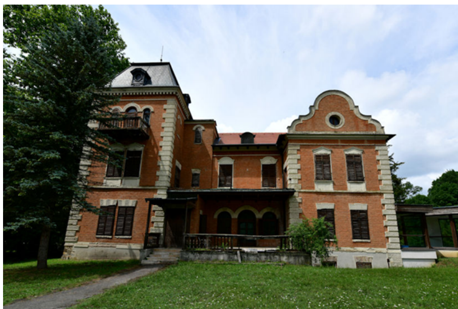
Slika 2. Presentacijsko-edukacijski centar Tikveš