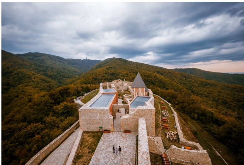
Slika 4. Centar za posjetitelje Medvedgrad