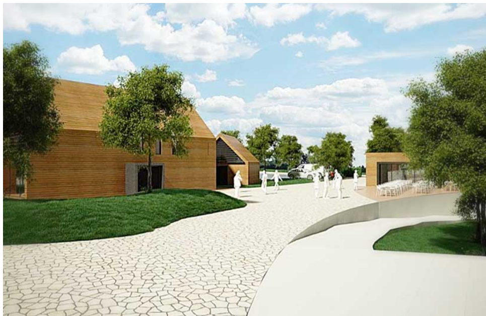
Slika 9. Posjetiteljski centar Sošice