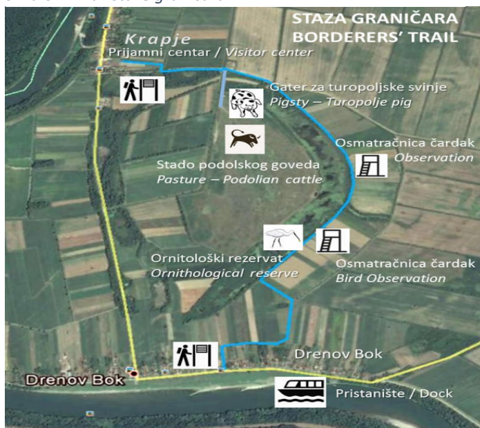
Slika 6. Prikaz staze graničara