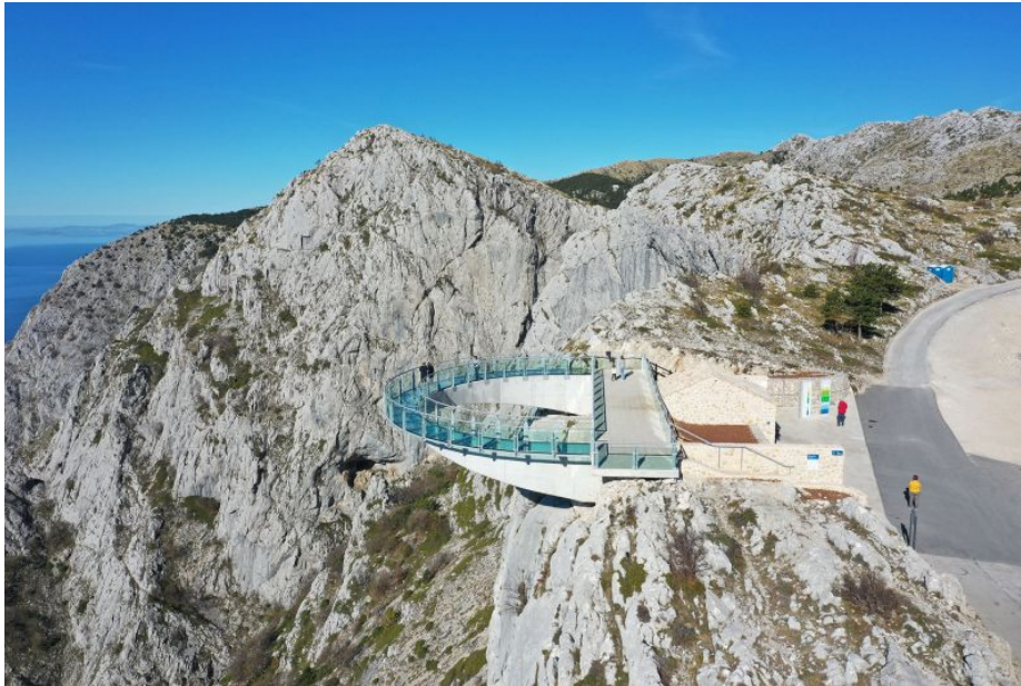
Slika 3. Vidikovac Nebeska šetnica – Skywalk Biokovo