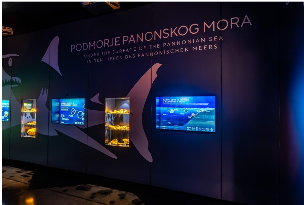
Slika 7. Kuća Panonskog mora