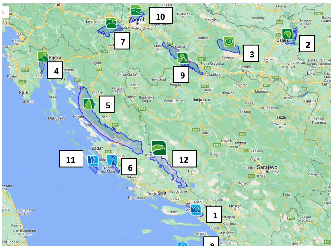
Slika 1. Parkovi prirode u Republici Hrvatskoj