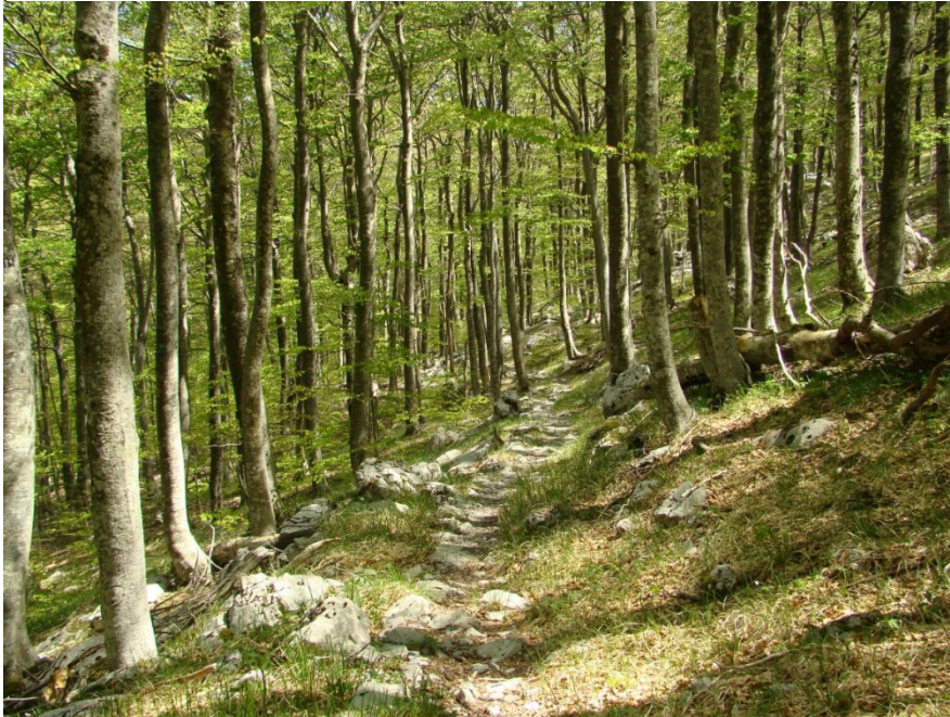
Slika 5. Premužičeva staza