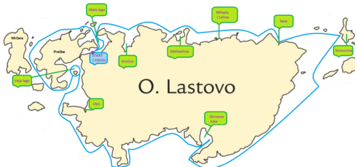
Slika 12. Obilazak Parka morskim putem