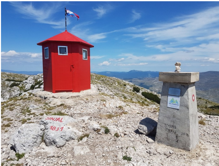
Slika 13. Vrh Sinjal