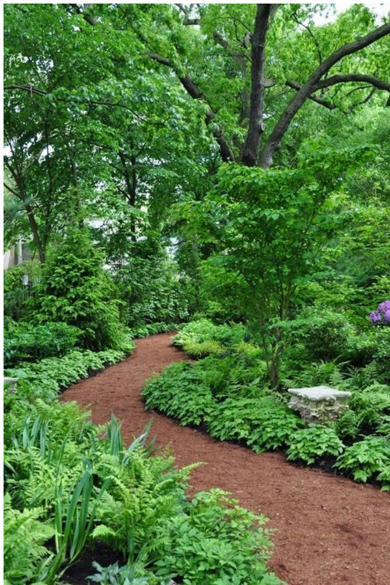
Slika 10. Puteljak

Sadnjom autohtonog bilja u resortu predstavlja se strategija koja istovremeno podržava i povezuje ekološku održivost, očuvanje biološke raznolikosti te kulturnu autentičnost i tako stvara odgovorniju i privlačniju turističku destinaciju.