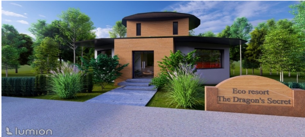
Slika 6. Recepcijski paviljon

Slika 7. prikazuje bungalove smještene na zemlji, najzastupljeniju vrstu smještajne jedinice.