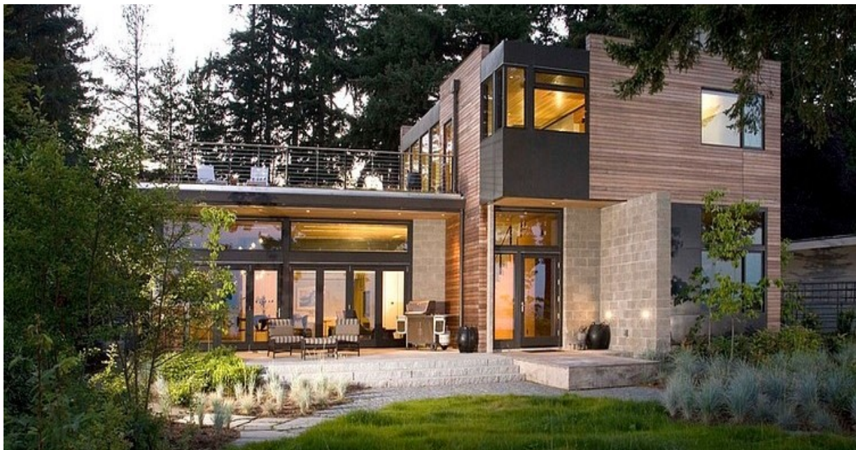
Slika 1. „The Ellis Residence“

Dobar je primjer održive arhitekture kuća „The Ellis Residence“.