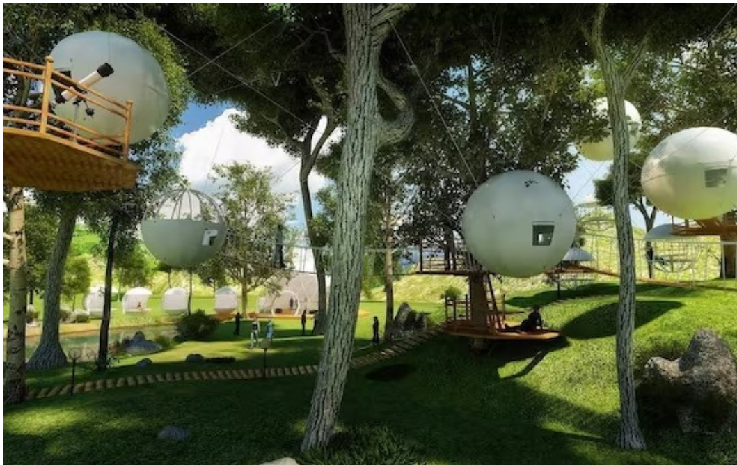
Slika 8. „Cocoon tree“

prikazane slikom 8. Izgledom podsjećaju na ptičja gnijezda koja lebde između drveća i grmlja. Postupak montiranja jednostavan je, moguće ih je postaviti u roku od dva sata. „Cocoon tree“ ima nešto što ga, osim izgleda, ljubiteljima prirode čini još privlačnijim, a to je njegov mehanizam za klimatizaciju koji se može napajati na održiv način, korištenjem Sunčeve energije i vjetra. „Cocoon tree“ sadržavao bi samo ležaj za dvije osobe. Tvrtka koja je osmislila ovakvu vrstu smještaja naziva se „Cocoon“ te ju je osnovao Berni Du Payrat. Za izradu „Cocoon tree“ odabrani su najbolji proizvođači komponenti u Europi. Aluminijske cijevi proizvedene su u Njemačkoj, priključci od nehrđajućeg čelika dolaze iz Francuske, a jaka membrana izrađena je u Portugalu. Proizvodnja je smještena na sjeveru Porta, dok se u neposrednoj blizini nalazi sjedište tvrtke. Svi postupci u skladu su s propisima Europske ekonomske zajednice. [4]