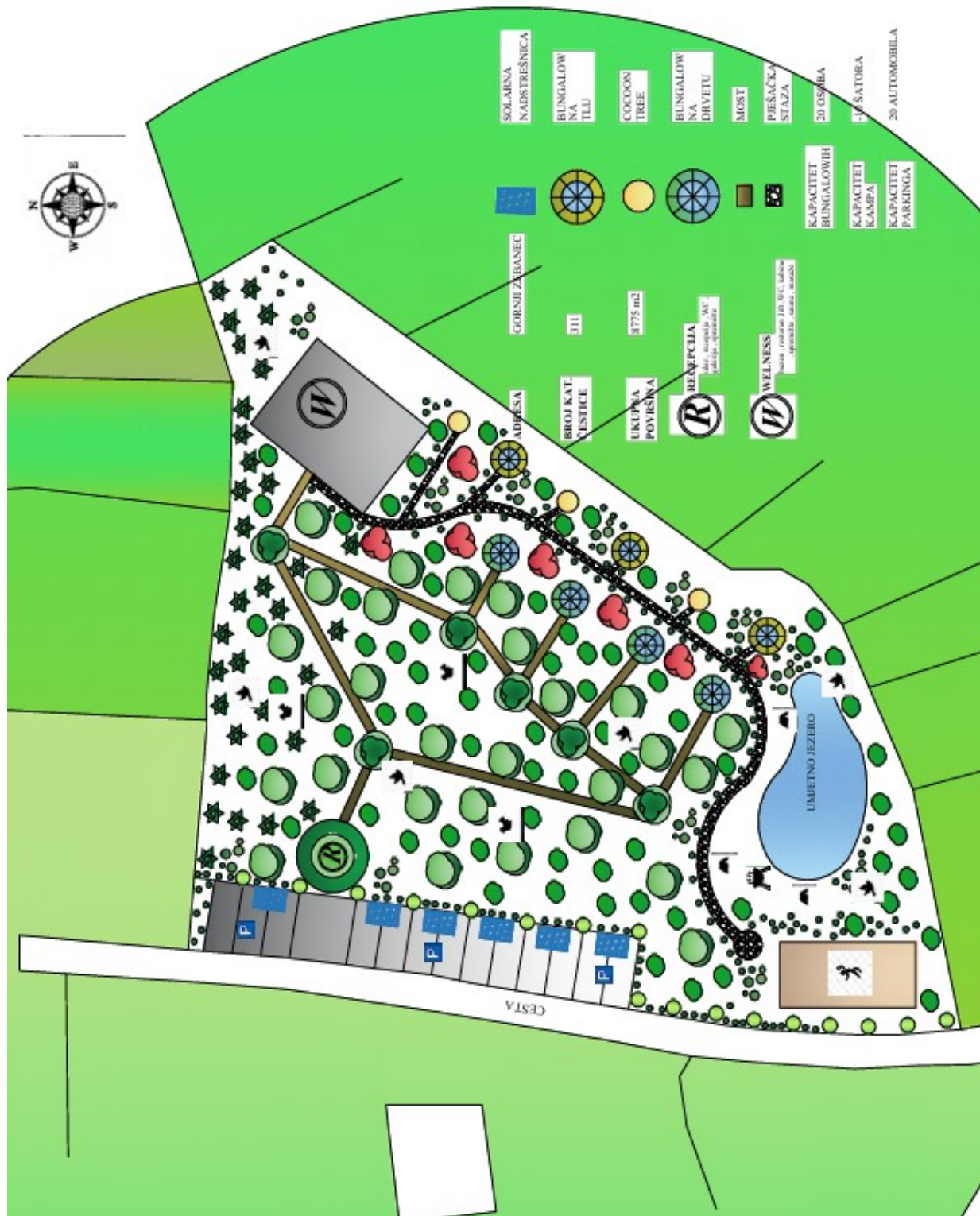
Slika 4. Situacijski plan resorta