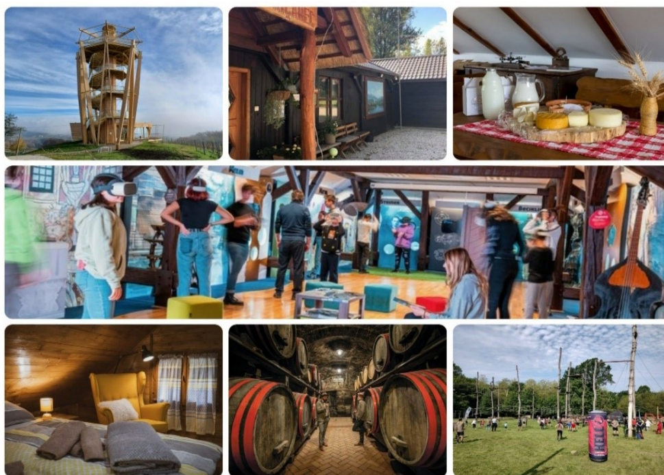
Slika 5. Atrakcije Međimurja

Najbliži je odabranoj lokaciji grad Mursko Središće koji je udaljen svega 5 kilometara, a na udaljenosti od samo 6 kilometara nalazi se Accredo centar koji nudi sportsko-rekreacijske i gastronomske mogućnosti te dodatno obogaćuje ponudu regije.