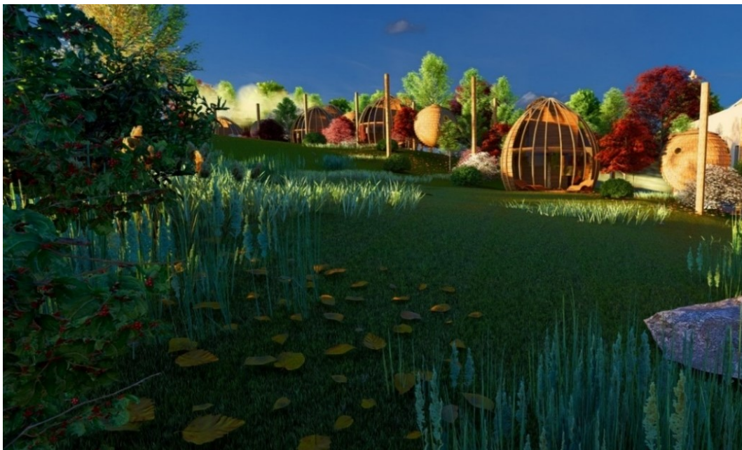
Slika 7. Vizualizacija bungalova