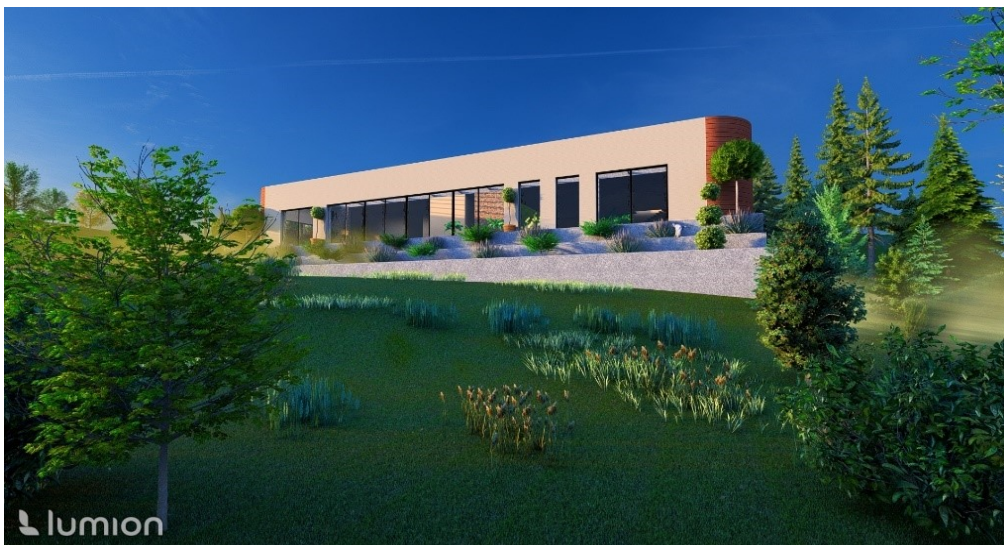
Slika 9. Pogled na wellness -objekt

Wellness -objekt predstavlja dodatnu ponudu održivom turizmu. Korištenjem održivih materijala i osiguravanjem pristupačnosti za sve goste ne samo da pruža luksuzno i opuštajuće iskustvo, nego podržava i ekološku odgovornost te svjesnost čime doprinosi cjelokupnoj održivosti resorta. Iako je resort prvotno zamišljen za boravak i opuštanje u prirodi, ne može se zanemariti ni to da turisti istodobno pokazuju interes i luksuz koji očekuju čak i od ovakvog tipa destinacija. Iz tog razloga osmišljen je i objekt jer se pretpostavlja da bi ispunio očekivanja i vrijeme potencijalnim gostima te samim time privukao i veći broj turista te različitu klijentelu.