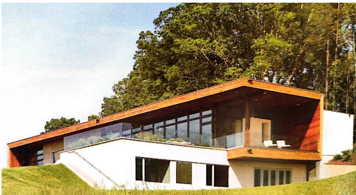
Slika 3. „Leicester House“

„Leicester House“ još je jedan izuzetan primjer jedinstvene arhitekture i dizajna. Objekt se nalazi u Americi te je završen 2009. godine. Projekt su ostvarili „SPG architects“. Od elemenata održivosti objekta ističu se geotermalno polje, zeleni krov na nižoj razini, reflektirajući bijeli krov na gornjoj razini te skupljanje kišnice. Bijeli reflektirajući krov prirodni je i učinkovit način koji pomaže spriječiti pregrijavanje objekta. [25]