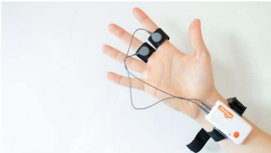
Slika 5 Prikaz GSR alata neuromarketinga