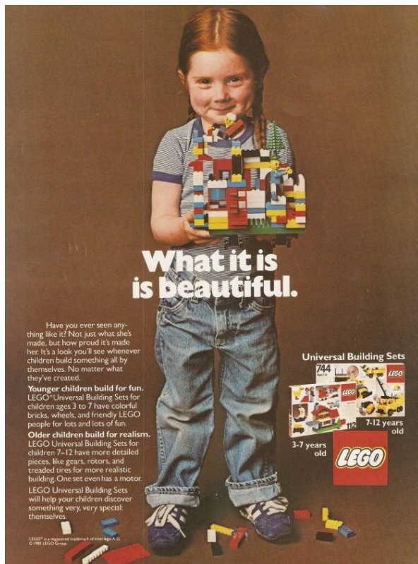
Slika 7 Prikaz primjera oglasa Lego kanpanje