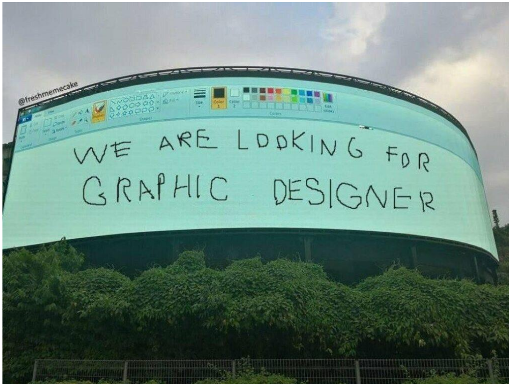
Slika 9 Prikaz primjera oglasa za zapošljavanje na temelju neuromarketinga