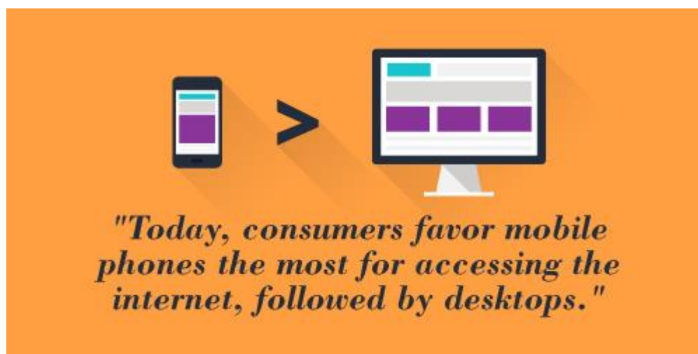
Slika 1 Prikaz preferencija potrošača