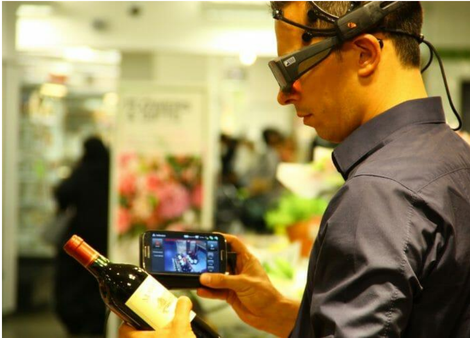
Slika 6 Prikaz Eye-tracking alata neuromarketinga