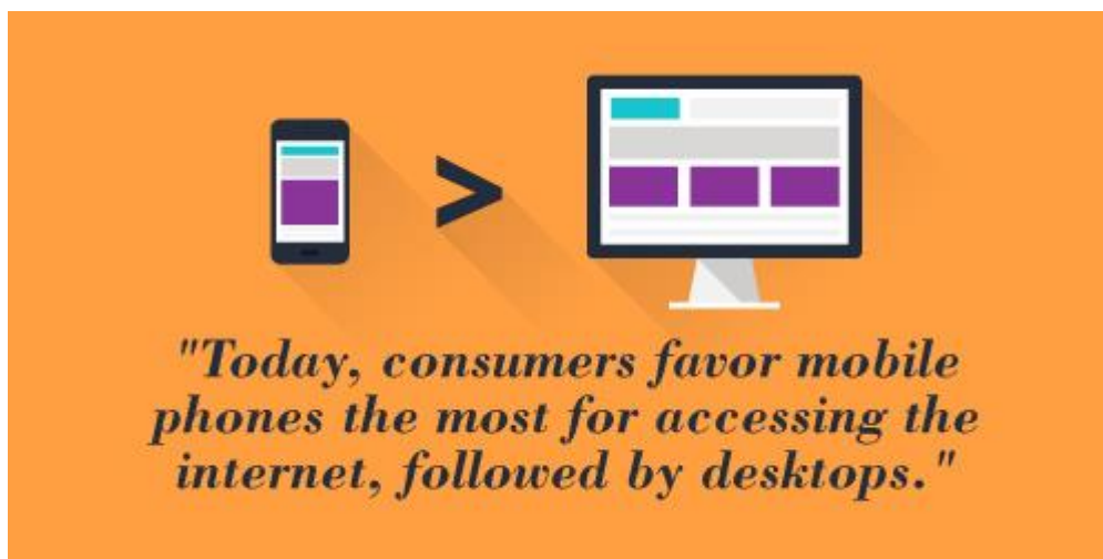
Slika 1 Prikaz preferencija potrošača

Izvor: https://online.uwa.edu/news/history-of-digital-marketing/ (pristup: 24.08.2023.)