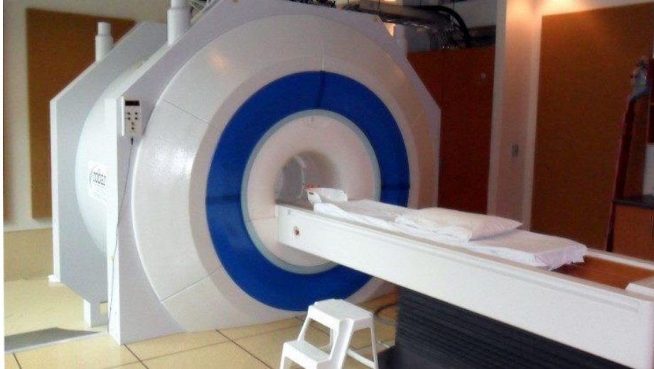
Slika 4 Prikaz fMRI alata neuromarketinga