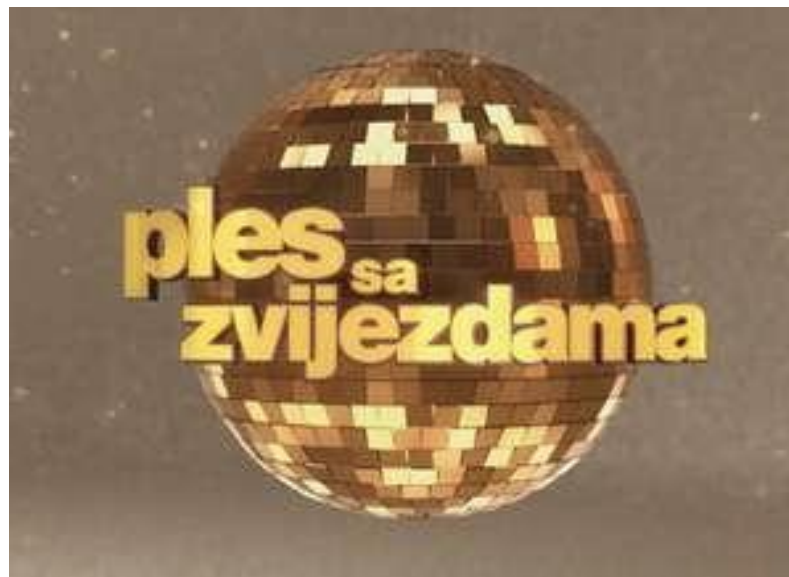
Slika 3 „Ples sa zvijezdama“, zabavna emisija s elementima plesa