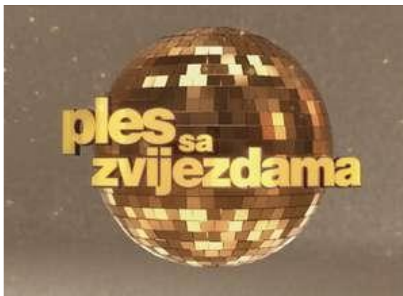
Slika 3 „Ples sa zvijezdama“, zabavna emisija s elementima plesa