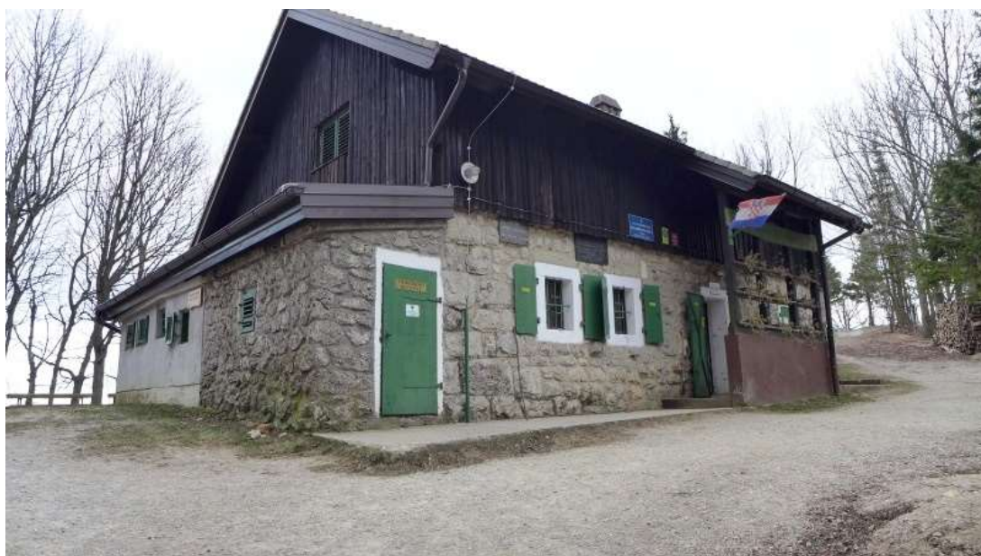
Slika 2.: Prikaz Pasarićevog dom izvana

Planinarski dom „Pasarićev dom“ (Slika 2.) na raspolaganju ima kuhinju i dvije spavaonice s četrdeset ležajeva. Depandansa, odnosno sporedna zgrada planinarskog doma, ima prostoriju za dvanaest osoba, kupaonicu, terasu, spremište i podrum.