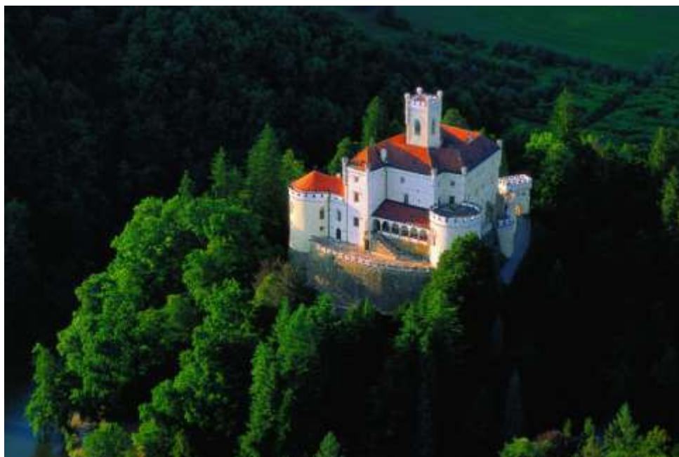
Slika 4.: Dvorac Trakošćan i njegova okolica

Dvorac Trakošćan nalazi se između tri gore: Ravne gore, Maceljskog gorja i Strahinčice.