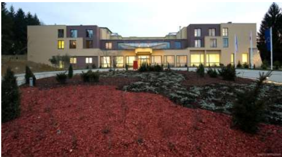
Slika 7.: Hotel Trakošćan

Izvor: http://www.hotel-trakoscan.hr/ 13