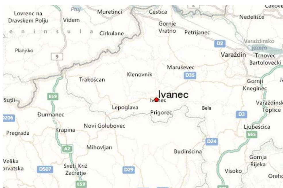
Slika 1.: Ivanec i njegova okolica na karti

Izvor: https://hr.wikipedia.org/wiki/Ivanec 1