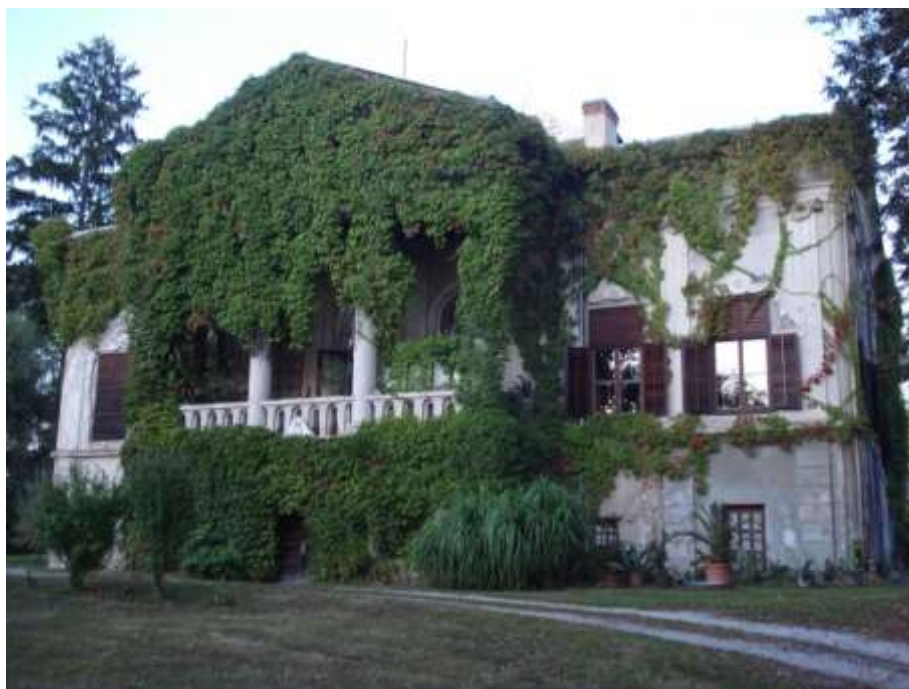
Slika 6.: Dvorac Opeka

Izvor: http://www.vinica.hr/index.php/hr/ 11