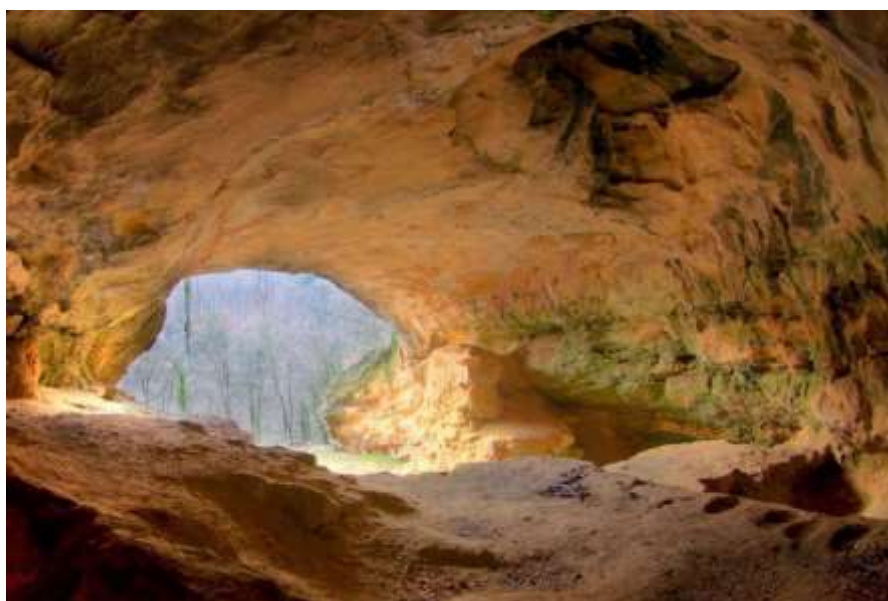
Slika 3.: Unutrašnjost špilje Vindije

Špilja Vindija bogato je nalazište kostiju, oruđa i ostalog pribora neandertalaca te je kao takva zbog svoje važnosti poznata diljem svijeta. Nalazi se u okolici grada Ivanca u općini Donja Voća. Špilja se smatra geomorfološkim, geološkim i botaničkim spomenikom prirode. Nalazi se na oko 2 km od središta Donje Voće na 275 m nadmorske visine.