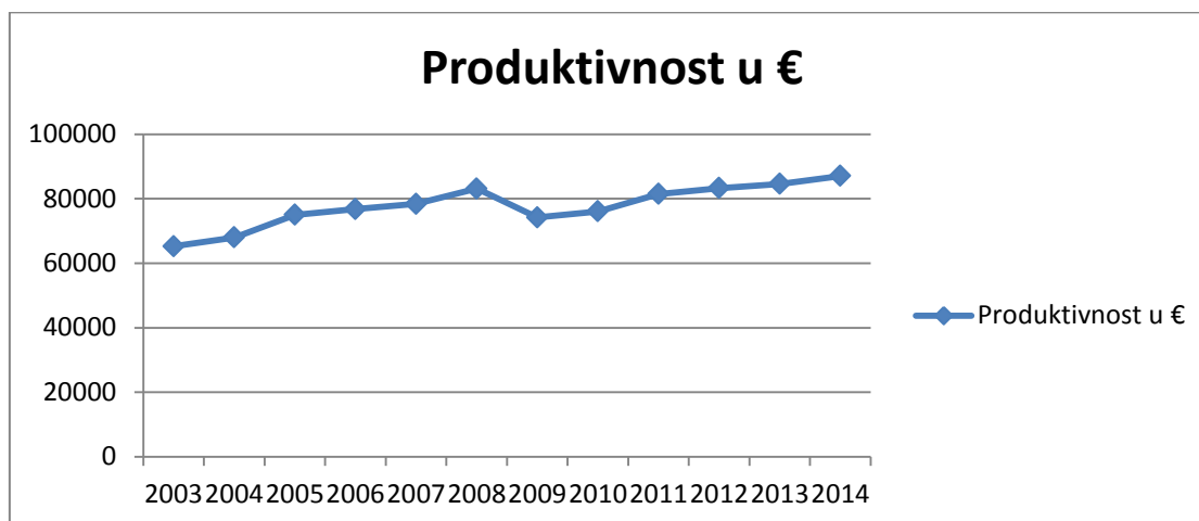
Graf 3. Rezultati izračuna produktivnosti rada