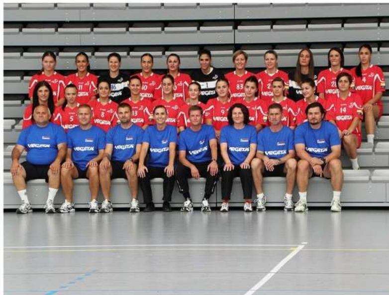
Slika 6: Ekipe Podravke koja je u sezoni 2012./2013. po dvadeseti put osvojila prvenstvo Hrvatske