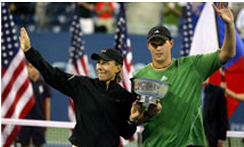
Slika 3. Tenisačica Martina Navratilova u osvajanju svog posljednjeg turnira

Kao primjer sportašice koja je iz privatnih razloga odnosno političkog protesta promijenila državljanstva jest bivša prva tenisačica svijeta Martina Navratilova. Ona je 1975. godine zbog neslaganja s komunističkim režimom pobjegla iz Čehoslovačke i zatražila azil u SAD-u 1981. godine SAD joj je omogućio i stjecanje državljanstva te je nastupajući za njih osvojila brojna svjetska priznanja, a između ostaloga i naslov prvakinja svijeta u tenisu (Mintashodak, Mateša, 2009).