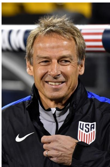
Slika 2. Nijemac Jürgen Klinsmann

Idealno ili najjače državljanstvo temeljeno je u istim mjerama na ius sanguinis i ius soli . U navedenom tipu državljanstva i sportaš i njegovi roditelji rođeni su u državi koju sportaš predstavlja. Naravno, postoje izuzetci. Ovoj kategoriji državljanstva pripadaju i sportaši čiji su roditelji različitog državljanstva pa pored stečenog idealnog državljanstva imaju i državljanstvo drugog roditelja, stečenog pomoću ius sanguinis . Ova kombinacija državljanstava omogućuje pojedincu da sam izabere državu za čiji nacionalni tim želi nastupati (Medić, 2017). Čvrstoću idealnog državljanstva stvaraju i sami sportaši svojim izjavama o časti predstavljanja države i prilici da se oduže državi što je uložila u njihov napredak i uspjeh.