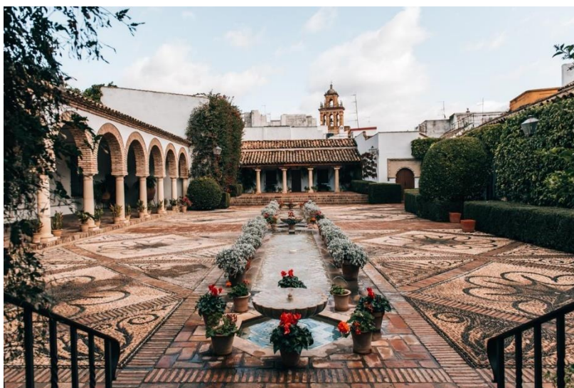
Slika 19. Palača "Palacio de Viana" u Cordobi