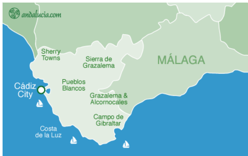
Slika 4. Geografski položaj provincije Cadiz