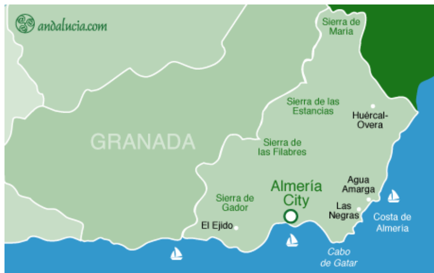
Slika 3. Geografski položaj provincije Almeria