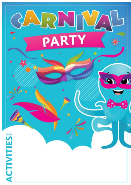
Slika 3 Primjer vizuala plakata za tematski dan