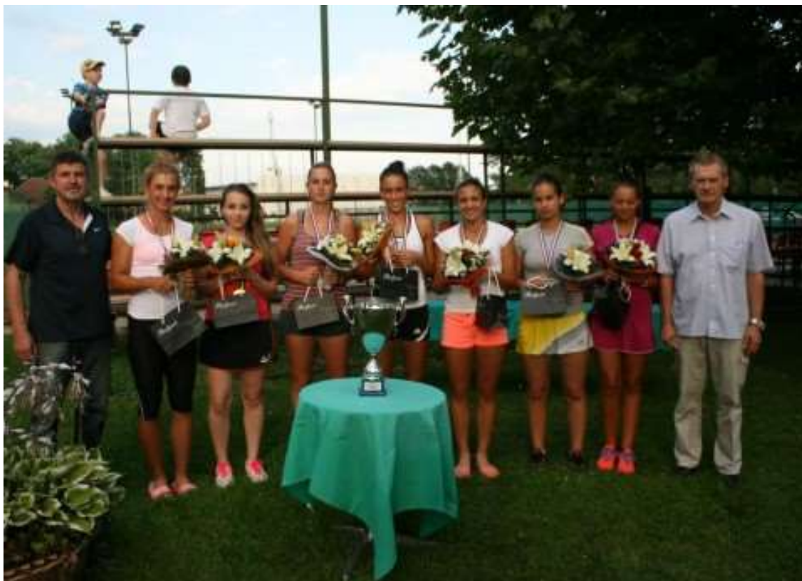
Slika 11: Tenisačice Teniskog kluba Franjo Punčec nakon osvajanja momčadskog naslova 2014. g.