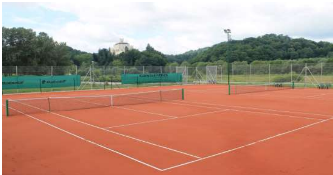
Slika 14: Teniski tereni hotela Trakošćan