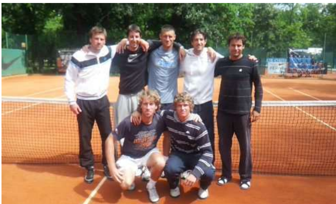
Slika 10: Ekipa Teniskog kluba Varteks