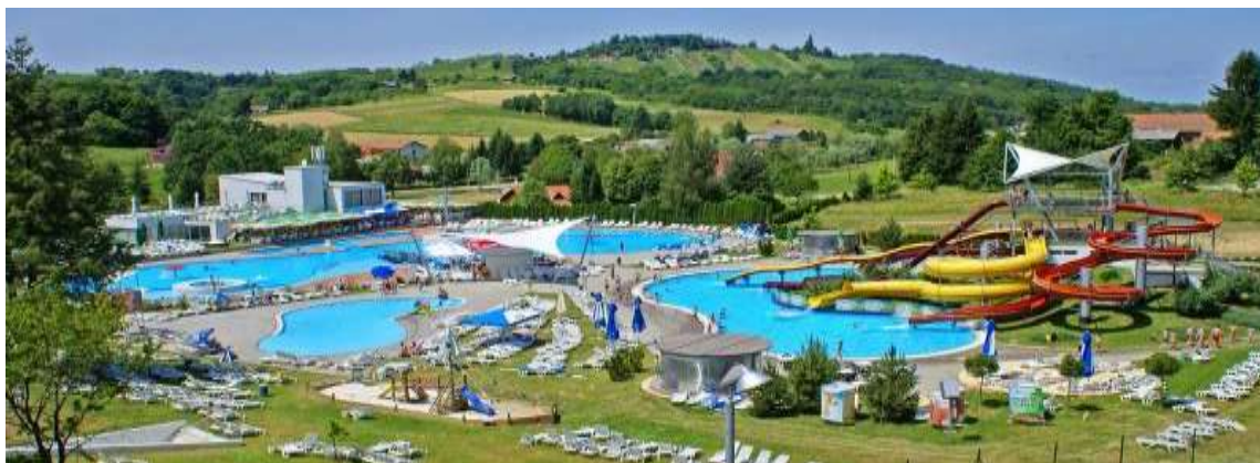
Slika 13: Spa &amp; sport resort Sveti Martin