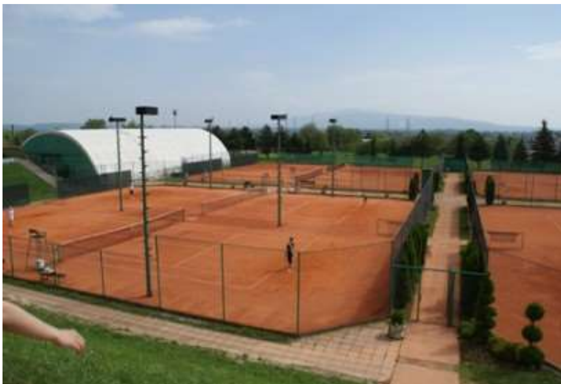
Slika 7: Teniski klub Samobor 1890