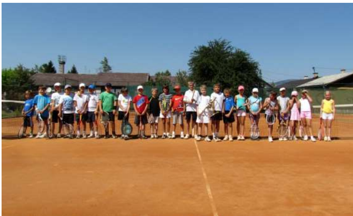
Slika 4: Polaznici teniske škole Teniskog kluba Zlatar