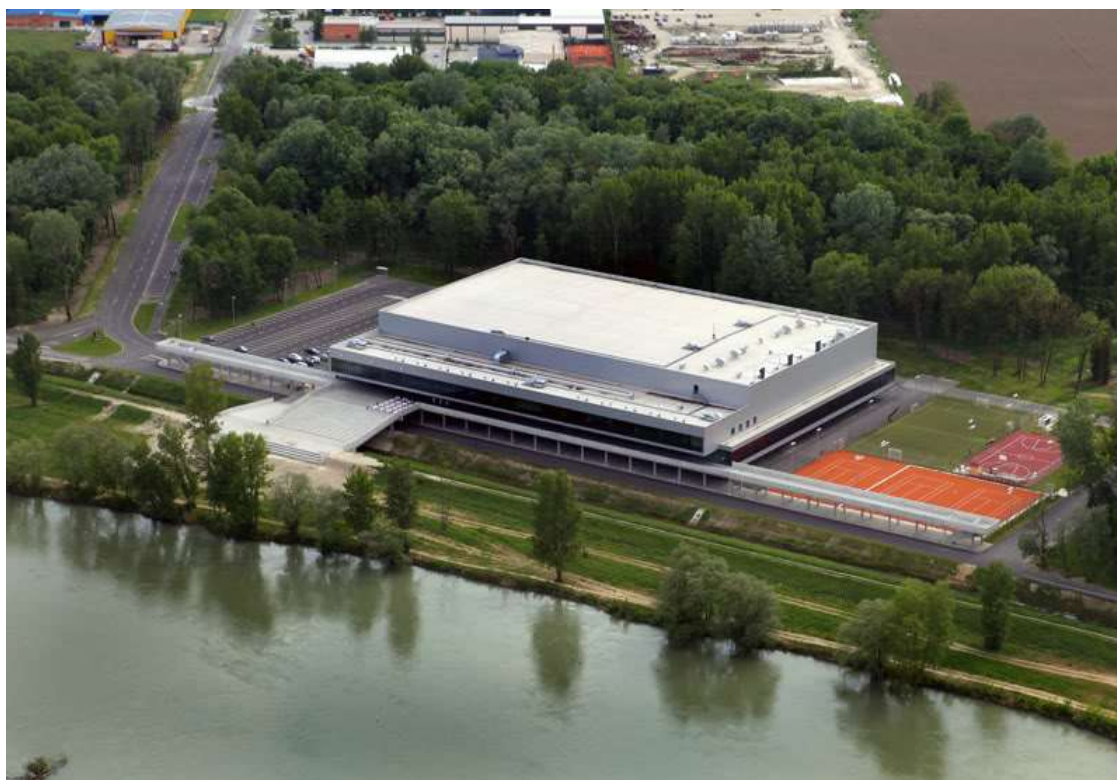
Slika 2: Sportski centar Arena Varaždin