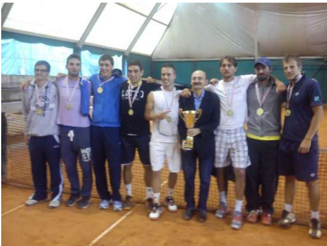
Slika 9: Seniorska ekipa TK Ponikve nakon osvajanja naslova državnog prvaka 2014. godine