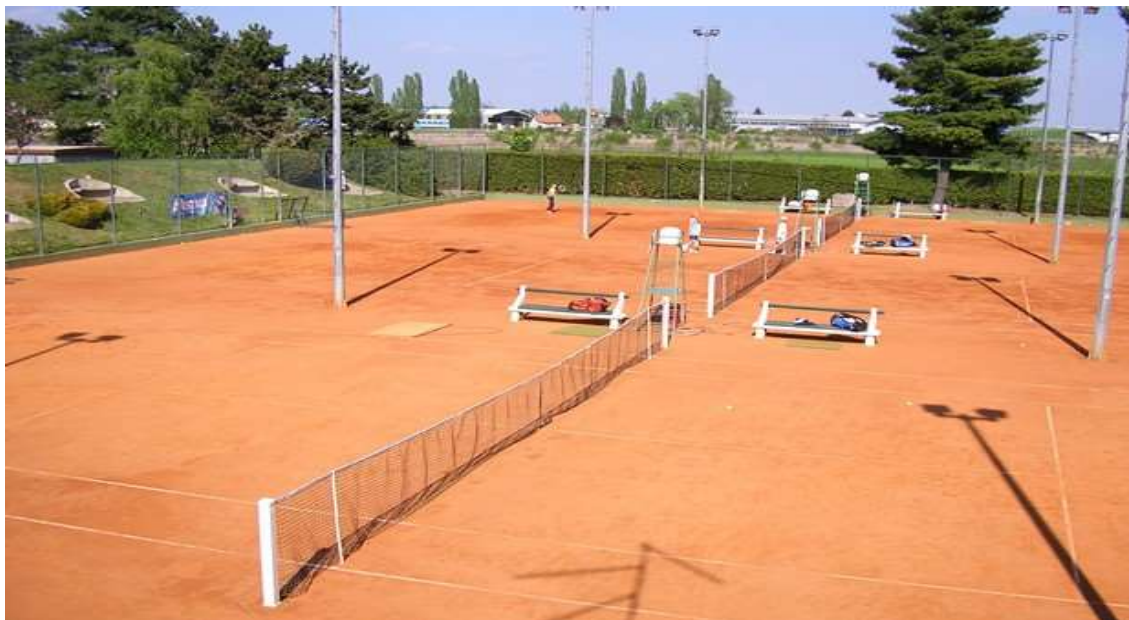
Slika 8: Tereni Teniskog kluba Varaždin 1181