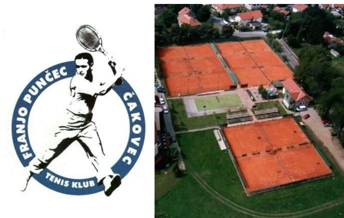
Slika 3: Teniski klub Franjo Punčec i prikaz njegovog grba