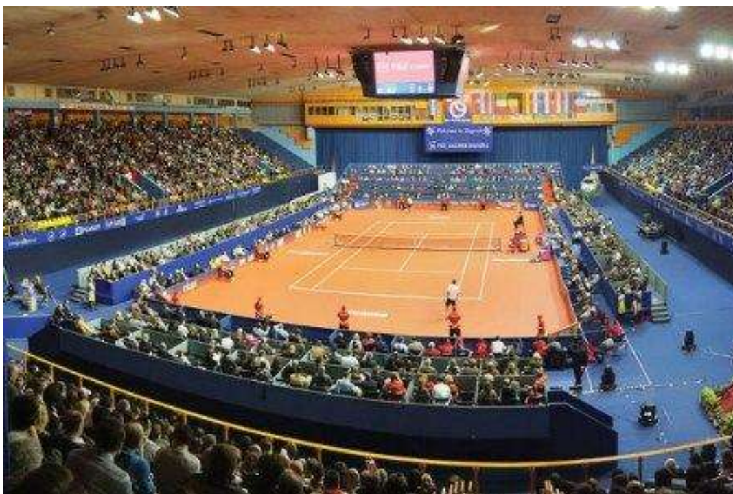
Slika 12: ATP Zagreb Indoors