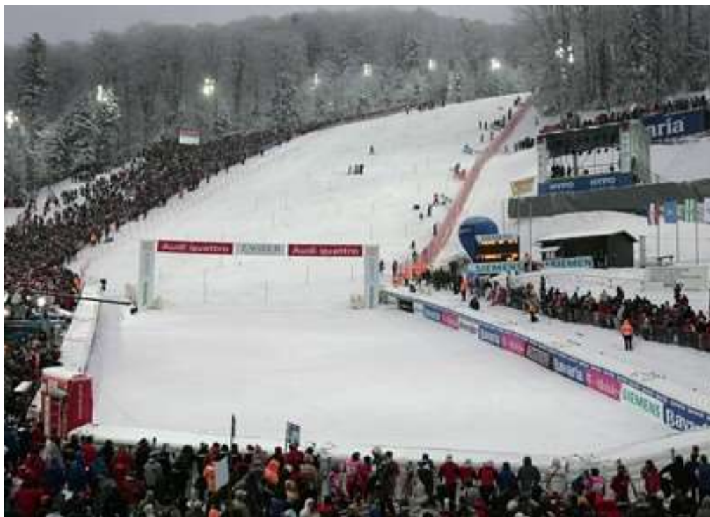
Slika 6: Snow Queen Trophy na Sljemenu