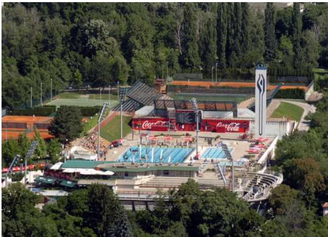
Slika 1: Sportski centar Šalata