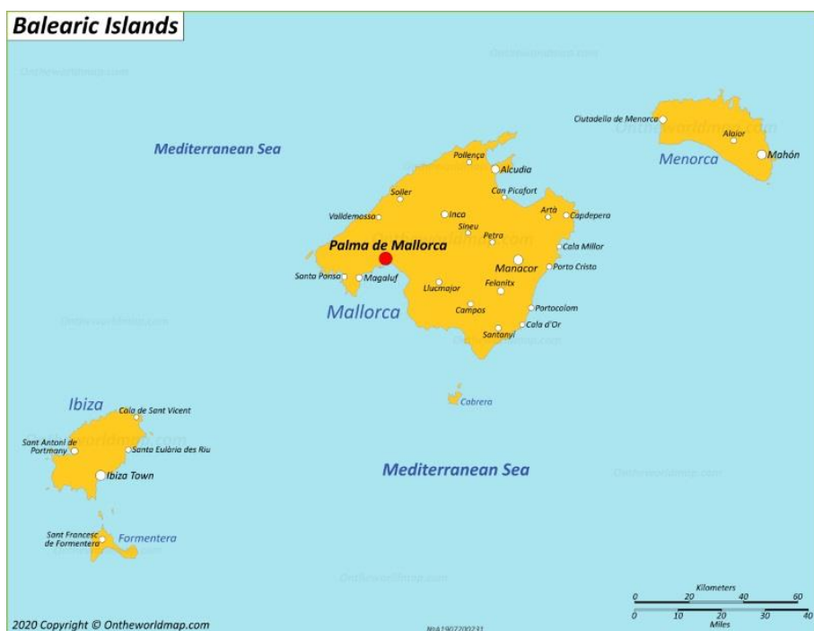
Slika 2. Otočje Baleari