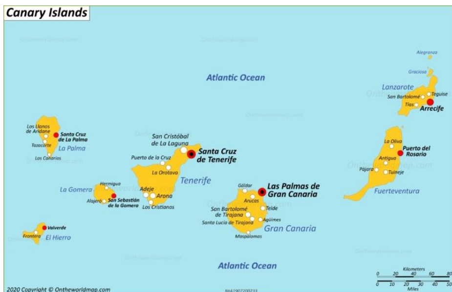
Slika 7. Otočje Kanari