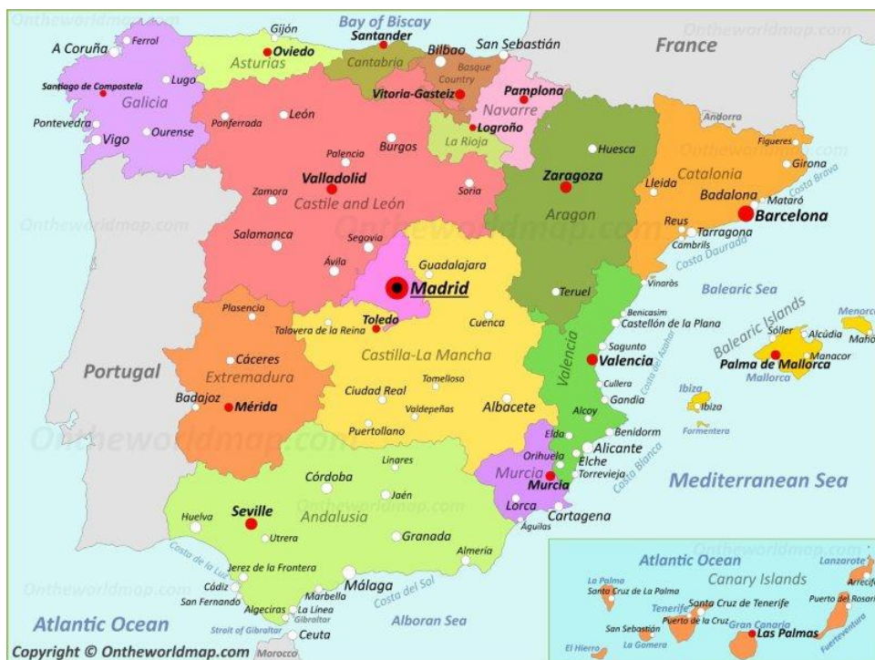
Slika 1. Karta Španjolske