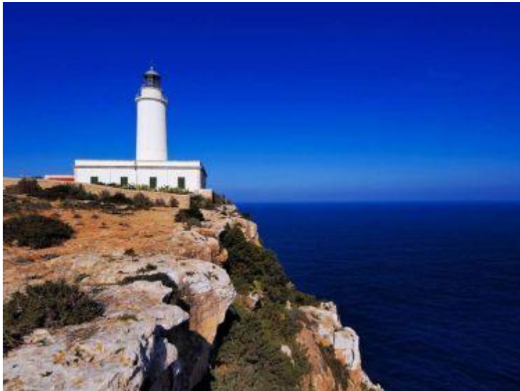
Slika 6. Svjetionik La Mola