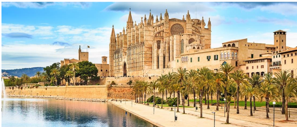
Slika 3. Katedrala u Palmi