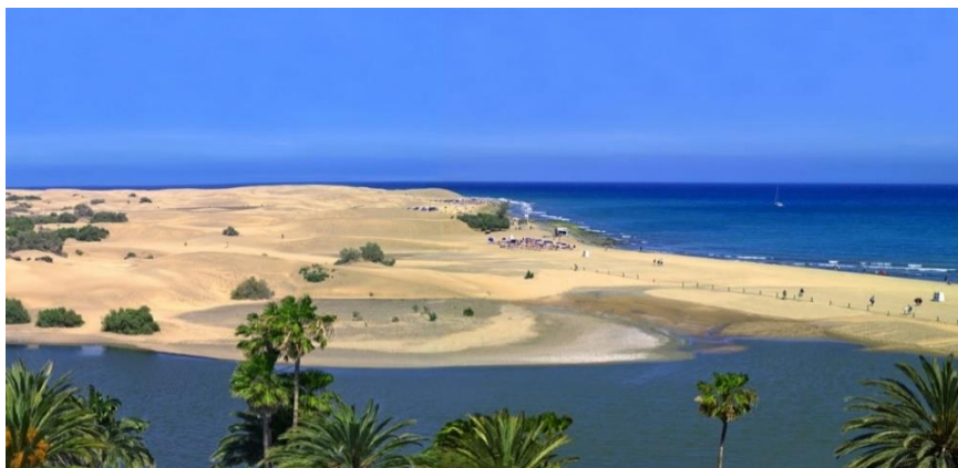
Slika 9. Dunas de Maspalomas