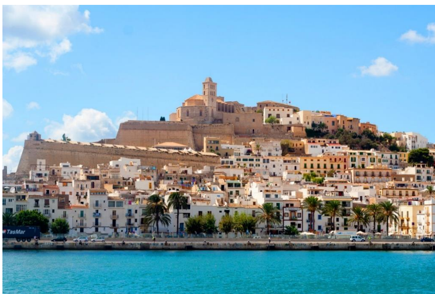
Slika 4. Dalt Vila