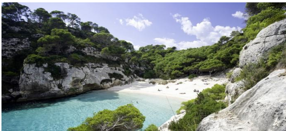
Slika 5. Rezervat biosfere Menorca