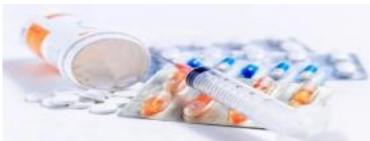
Slika 2 Steroidi u obliku tableta i injekcija

Izvor: https://body.ba/ishrana/suplementi/kako-djeluju-steroidi/1269 (10.6.2022.)