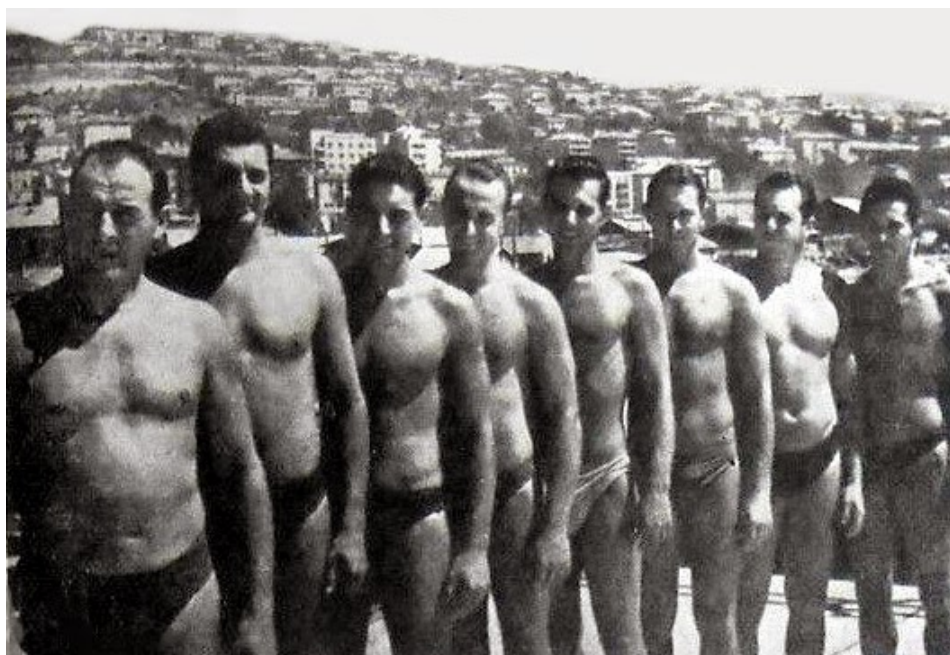
Slika 12. Ekipe VK Jug iz 1954. godine, Dubrovnik.