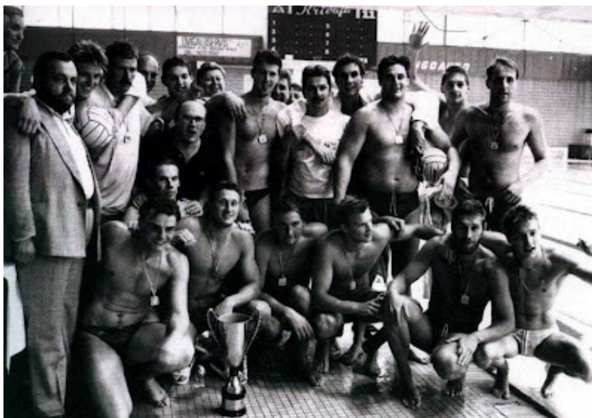
Slika 10. Mladost na Europskom kupu 1991. godine