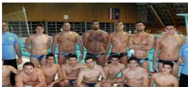
Slika 23. Ekipe VK Zadra1952, 2015.godine