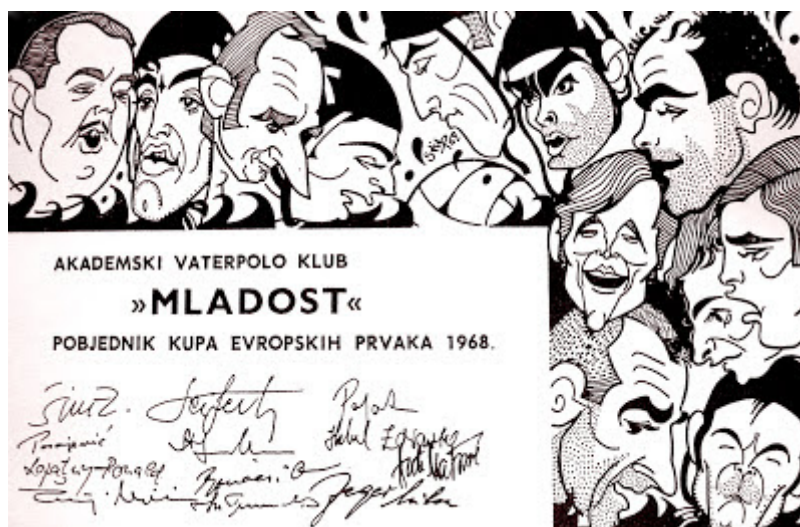
Slika 9. Pobjednici kupa europskih prvaka 1968.godine- karikatura