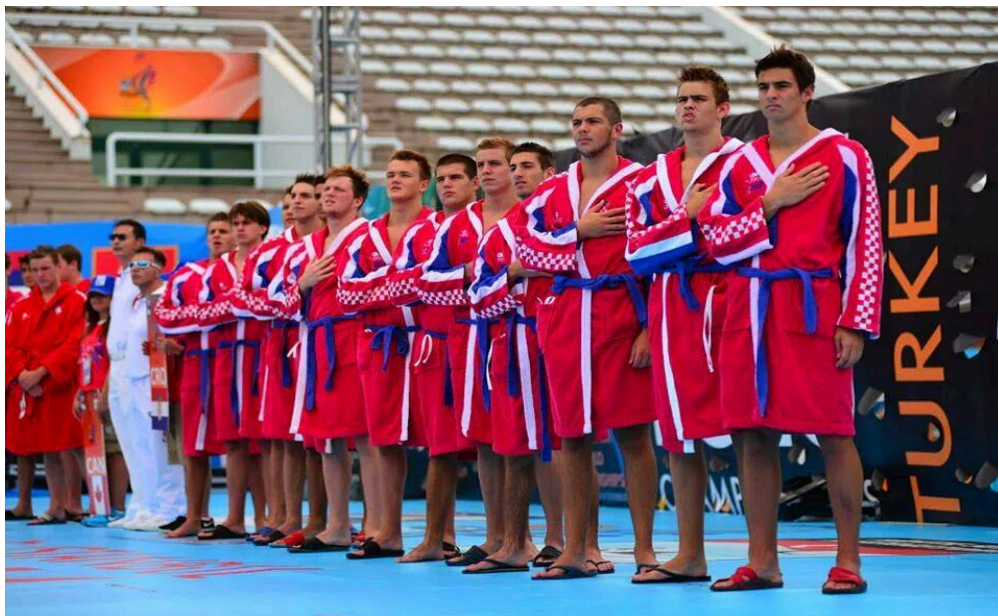
Slika 7. Svjetsko prvenstvo U 18, Turska 2014.