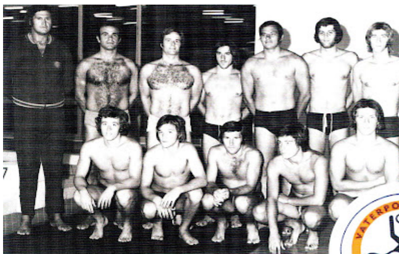
Slika 16. Ekipa VK Solarisa, 1971. godine

Profesionalni vaterpolski klub Šibenik je osnovan 1953. godine i od tad djeluje na području grada Šibenika i Dalmacije. Šibenik je dugogodišnji prvoligaš u hrvatskim i bivšim jugoslavenskim natjecanjima (kada je nastupao pod imenom svog višegodišnjeg pokrovitelja, hotelskog naselja Solaris).