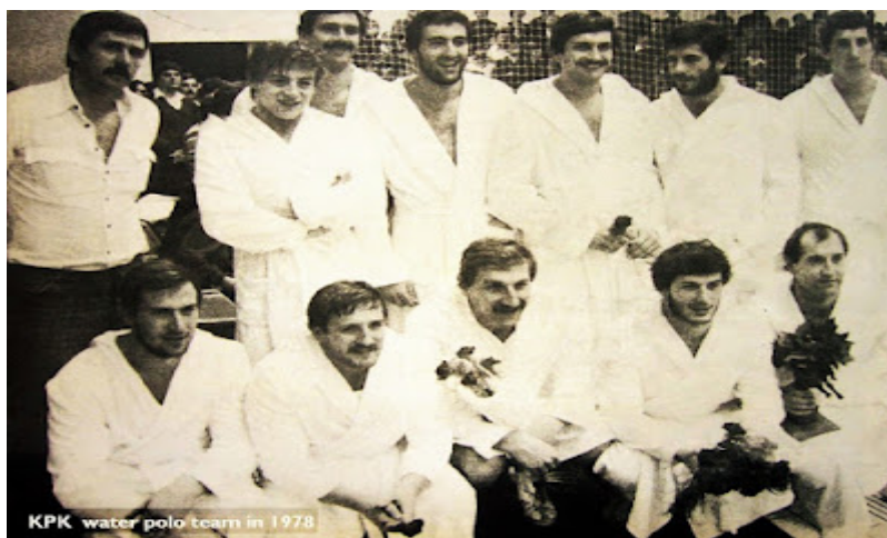
Slika 24. Ekipa KPK Korčila, 1978