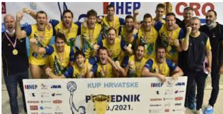
Slika 11. Mladost pobjednik kupa Hrvatske