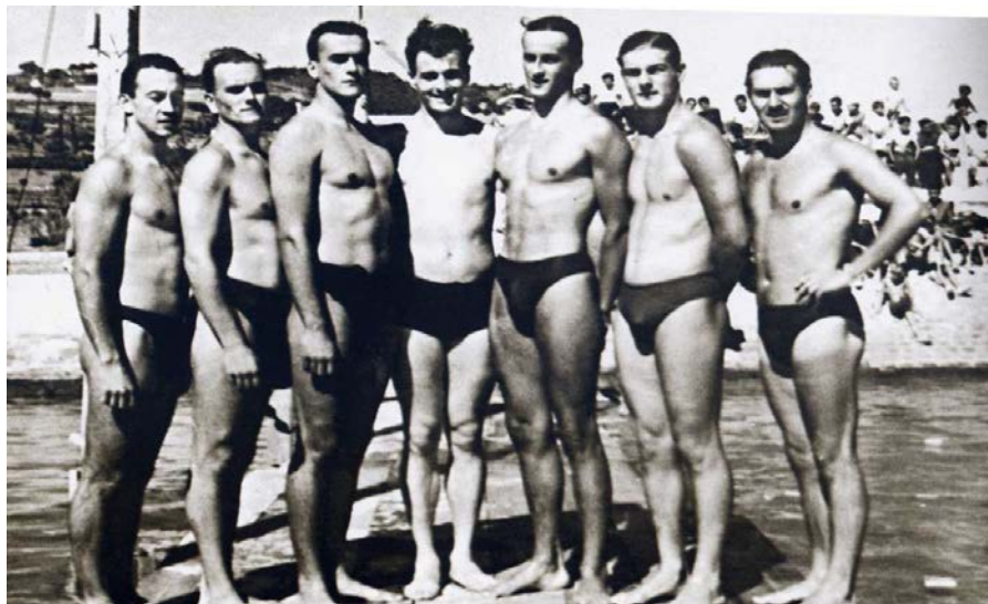
Slika 17. VK Primorje 1938. osvojeno je 1. mjesto na Državnom prvenstvu Jugoslavije