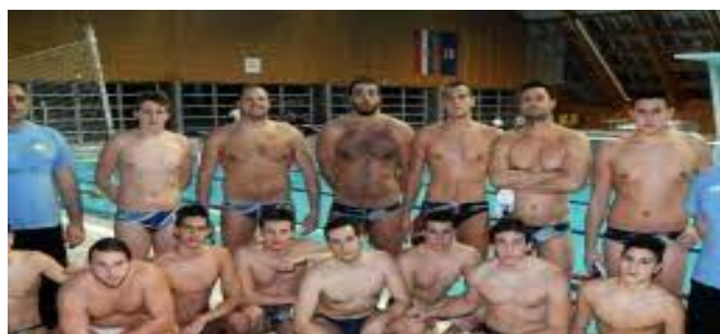
Slika 23. Ekipe VK Zadra 1952, 2015. godine

Izvor: https://www.zadarskilist.hr/taxonomy/term/3171