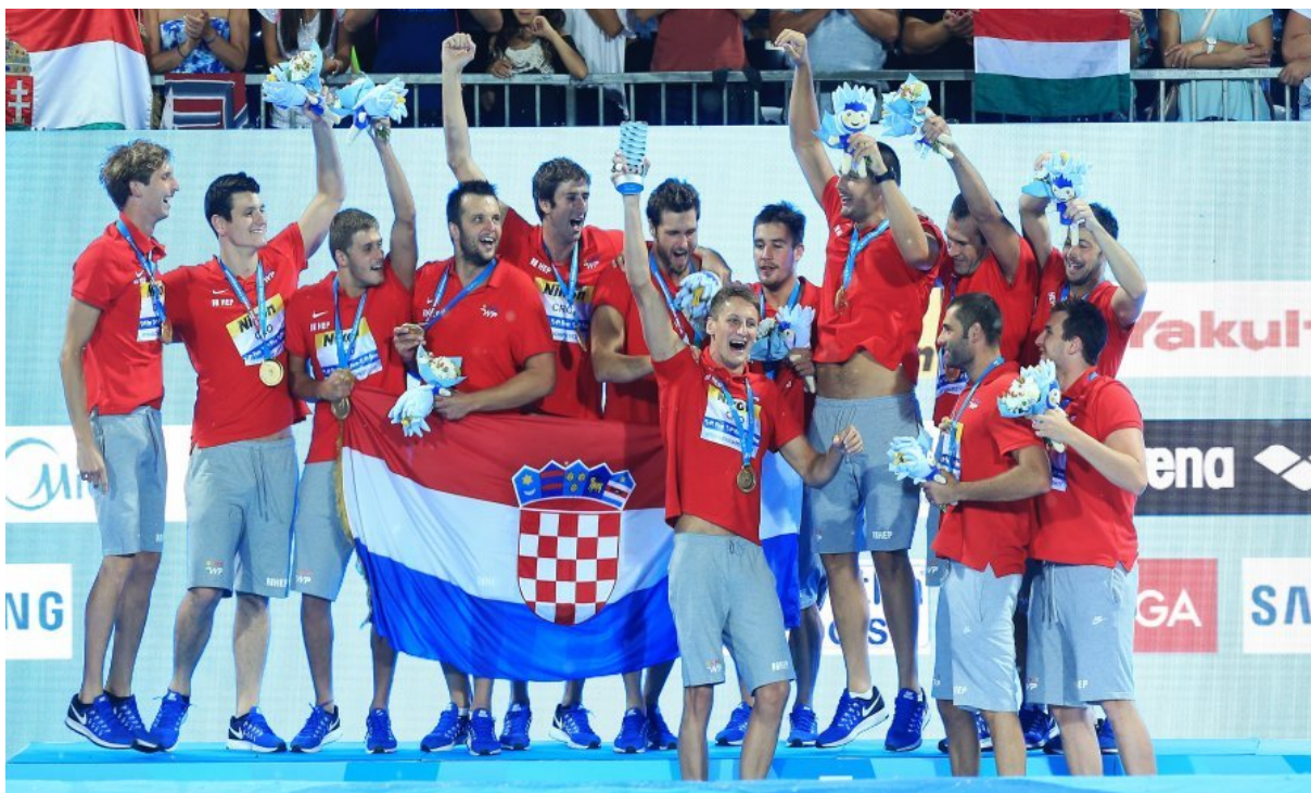
Slika 6. Hrvatska muška reprezentacija na postolju u Budimpešti 2017.godine