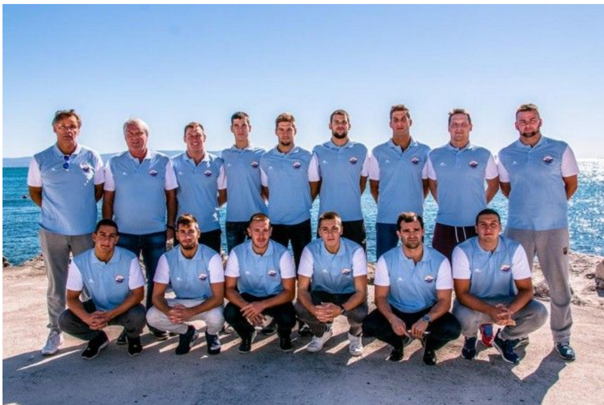
Slika 22. Ekipa VK Pošk 2018.godine