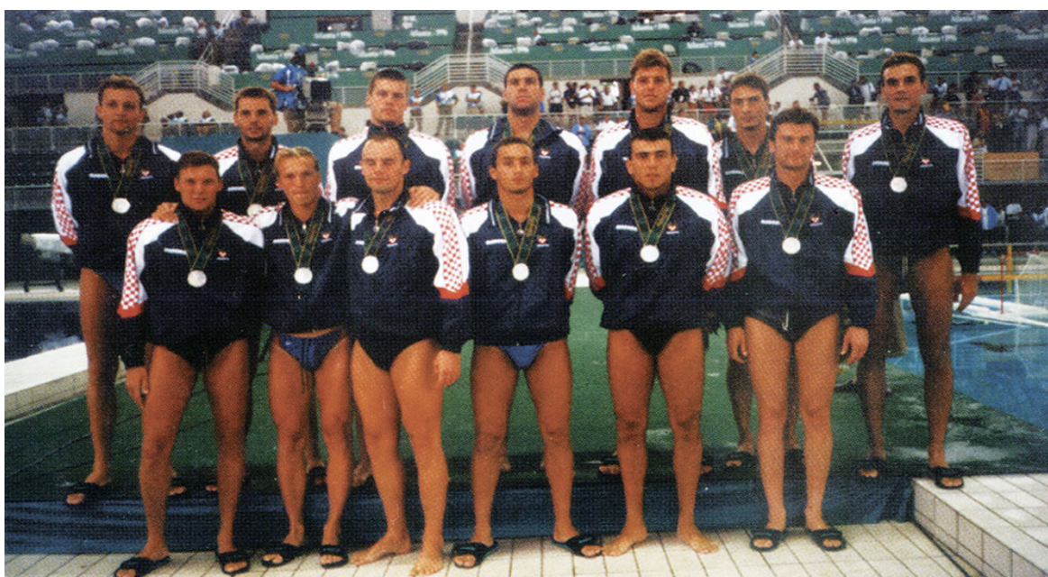
Slika 1. Srebrna reprezentacija na Olimpijskim igrama u Atlanti 1996.