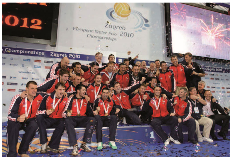
Slika 4. Muška vaterpolo reprezentacija na postolju u Zagrebu 2010. godine