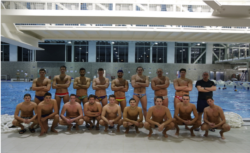
Slika 20. Ekipe Vk Medveščaka 2019. godine