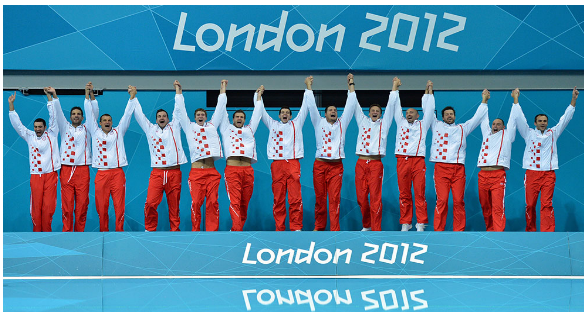
Slika 5. Hrvatska vaterpolo reprezentacija pobjednik Olimpijskih igara u Londonu 2012. godine