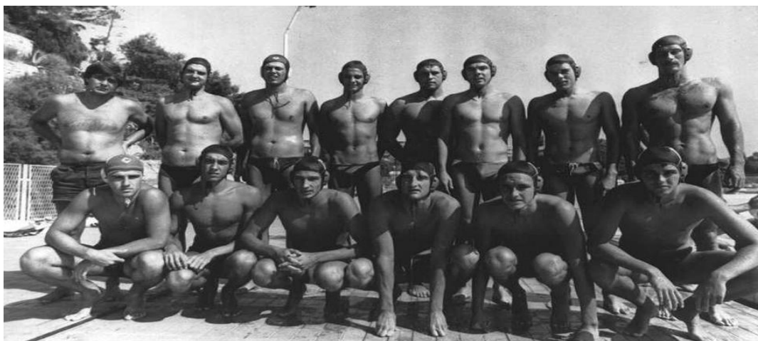
Slika 15. Ekipe VK Jadran Sple 1992. godine