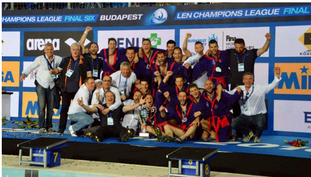
Slika 13. Ekipe VK Juga kao pobjednici lige prvaka