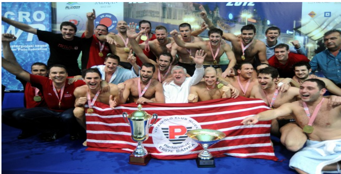
Slika 18. Pobjednici Jadranske lige