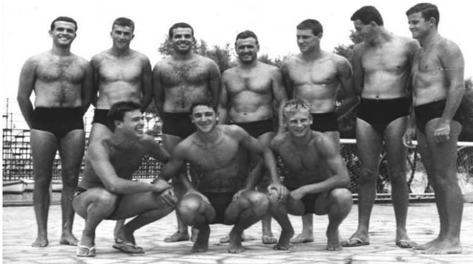
Slika 21. VK Mornar prvaci države 1961.godine