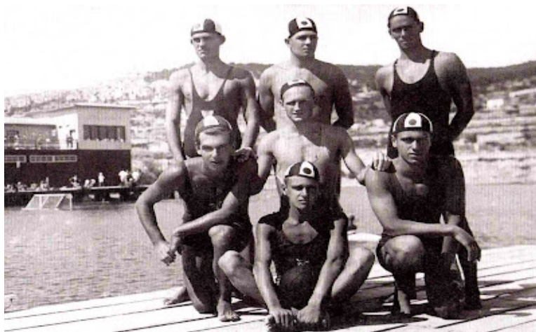
Slika 14. Ekipe vaterpola kluba Jadran 1953. godine