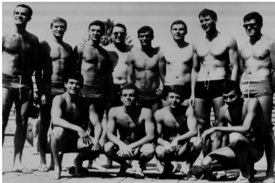
Slika 19. Ekipa Medveščaka 1966.godine