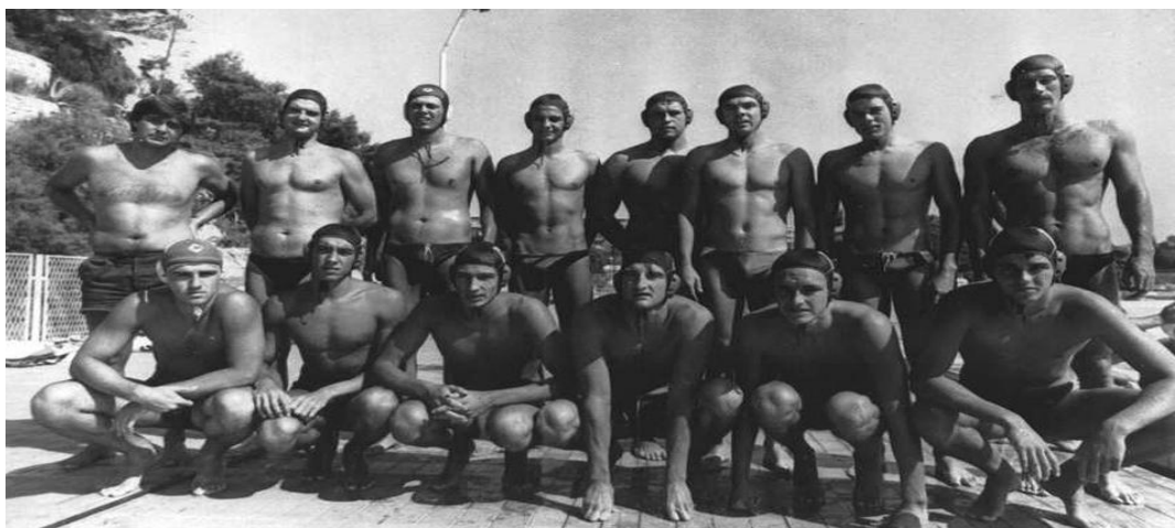
Slika 15. Ekipe VK Jadran Spli 1992. godine