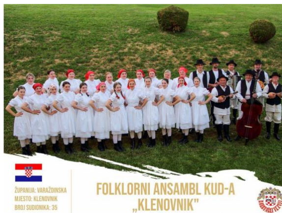
Slika 8. Sekcija KUD-a Klenovnik, folklorni ansambl

prehrambene i neprehrambene proizvode koji se izlažu i dijele posjetiteljima. Nadalje, iako je ovaj kraj poznat po lončarstvu, bačvarstvu i pletarstvu, danas nije ostalo mnogo potomaka koji su naslijedili zanat svojih obitelji i održali tradiciju izrade.