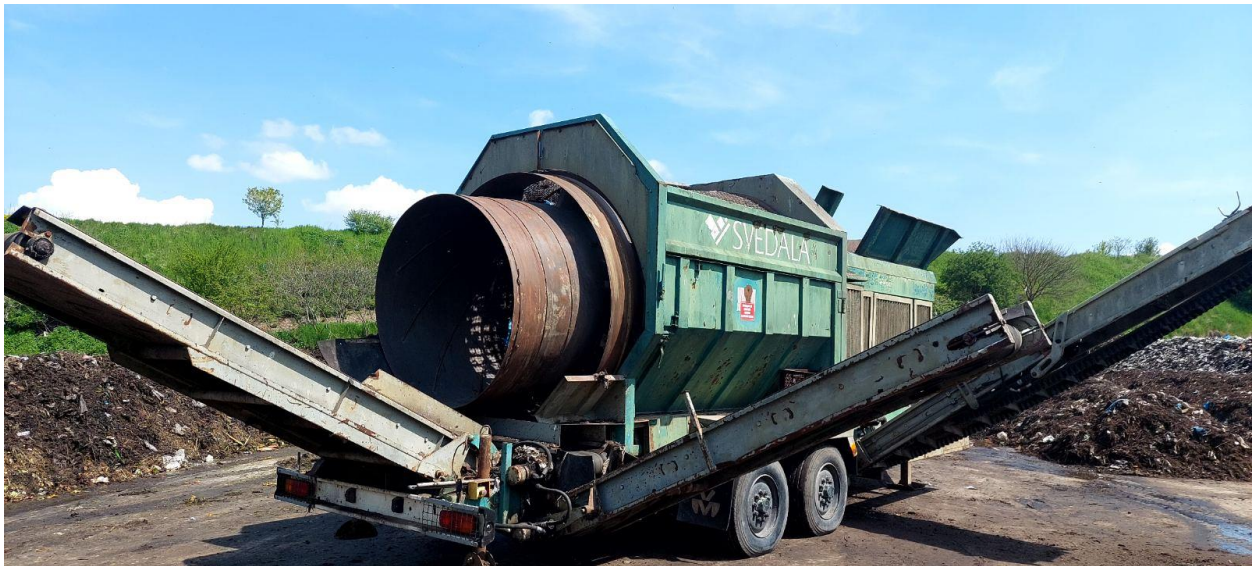
Slika 14. Rotaciono sito Svedala Combi Screen