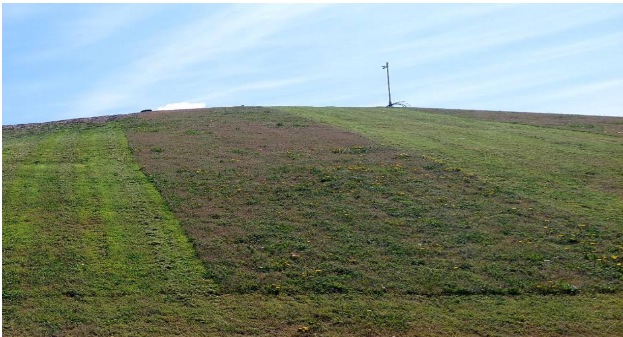
Slika 6. Aktivna odlagališna ploha s prekrivnim brtvenim sustavom

Sve ove komponente zajedno čine prekrivni brtveni sustav koji osigurava sigurno odlaganje otpada, sprječava infiltraciju oborina i kontrolira emisiju plinova s odlagališta. Također berme se izvode na rekultivacijskom sloju kako bi usporile protok oborinskih voda s pokosa i krovne površine te sprječavale eroziju na pokosima.