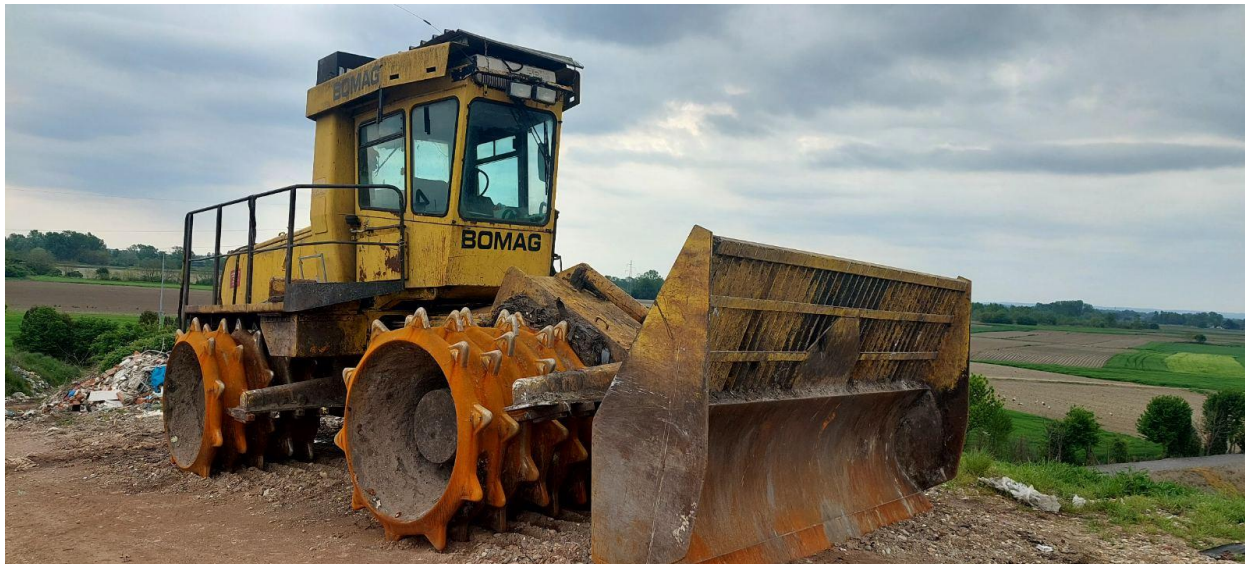
Slika 11. Kompaktor Bomag 601 RB

Navedeni stroj omogućava efikasno komprimiranje i baliranje različitih vrsta materijala, čime se smanjuje njihov volumen i olakšava transport. Ovaj stroj se koristi u industriji reciklaže i otpada kako bi se materijali pripremili za daljnju preradu i ponovno korištenje.