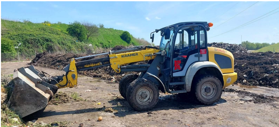
Slika 13. Teleskopski utovarivač Kramer Allrad 5065T