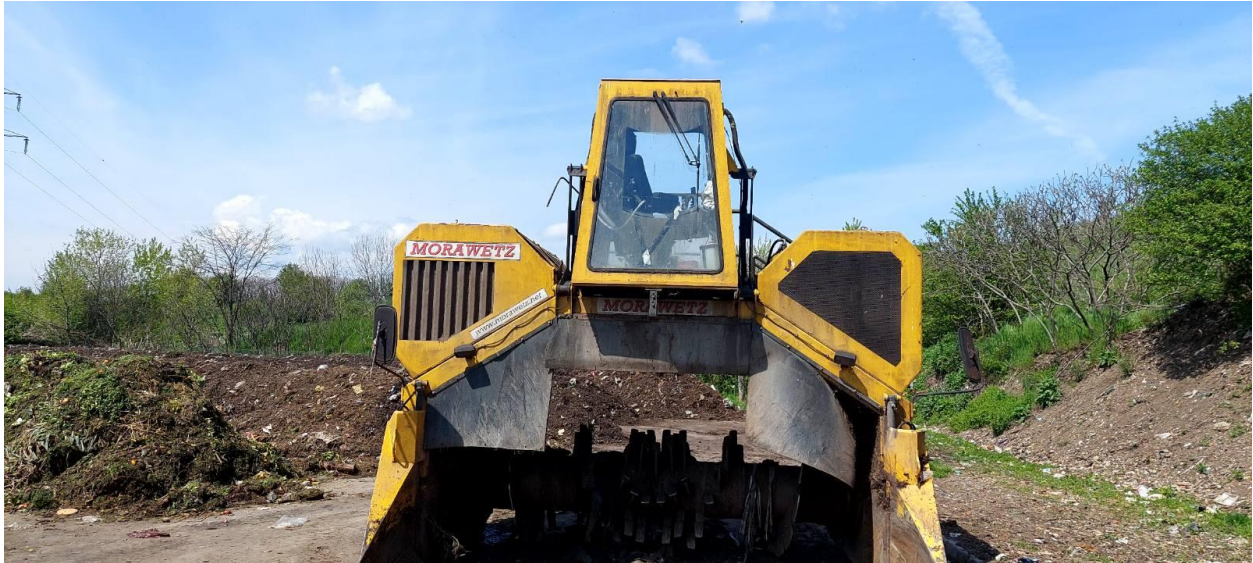
Slika 12. Okretač komposta Morawetz