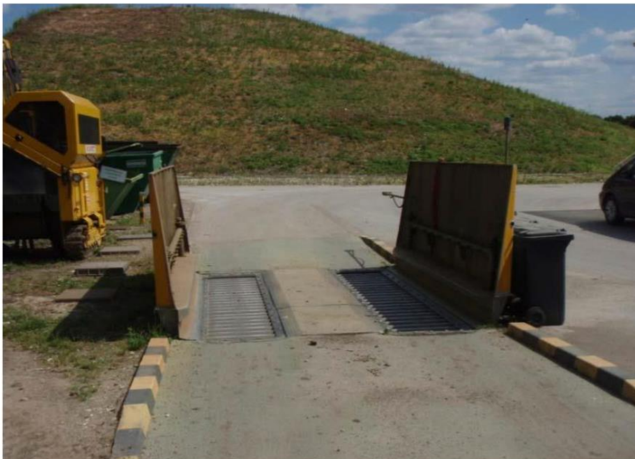
Slika 3. Plato s uređajem za pranje kotača