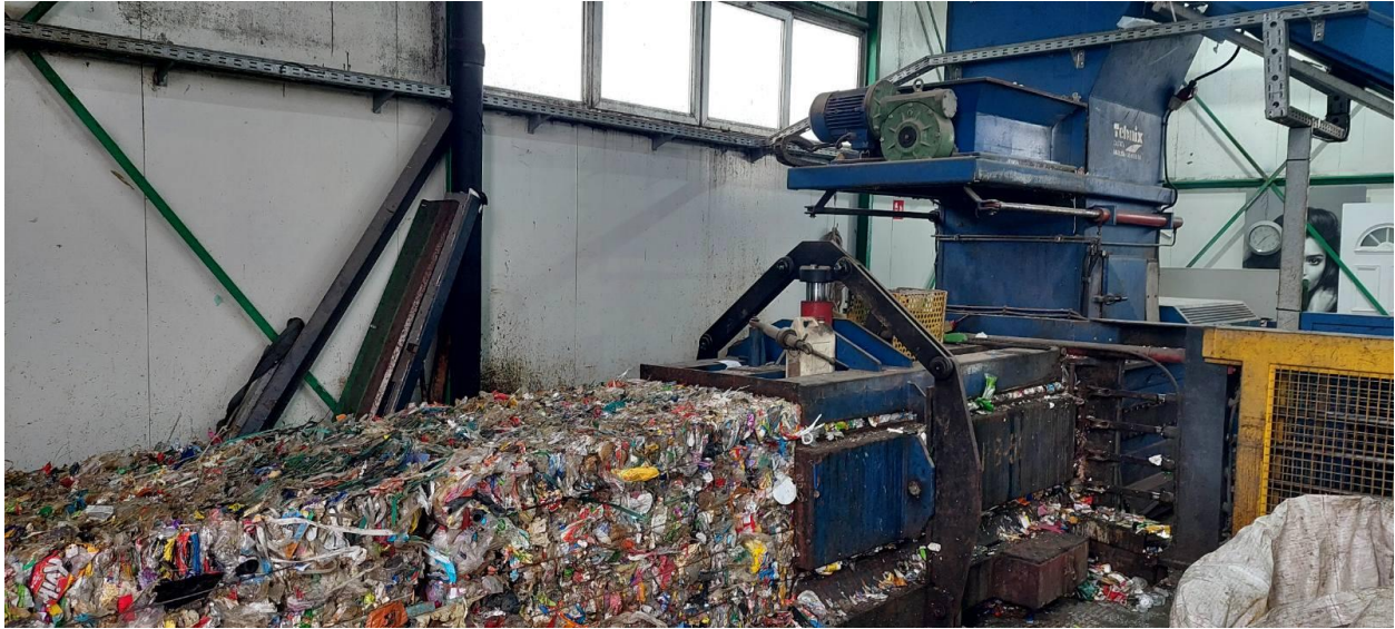
Slika 10. Tehnix automatska preša-balirka 50 t