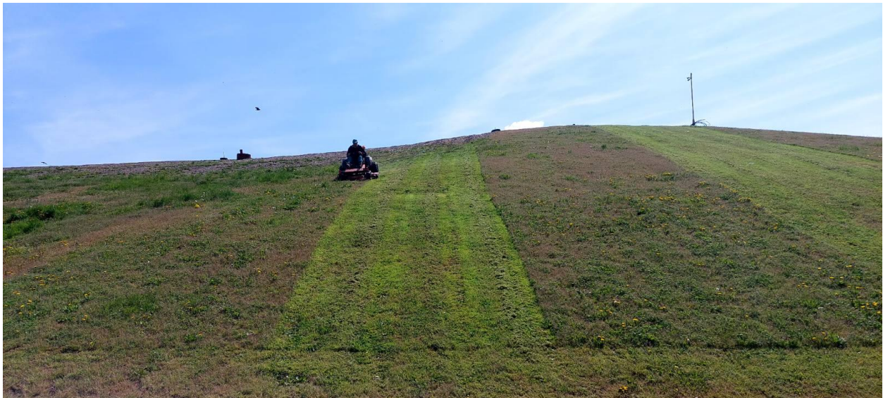
Slika 15. Traktor kosilica Rider

Prednosti korištenja rotacionog sita Svedala Combi Screen na odlagalištu otpada uključuju visoku efikasnost odvajanja, sposobnost rada s velikim količinama materijala, prilagodljivost različitim vrstama otpada i sposobnost integracije s drugom opremom za obradu otpada. Također, ova vrsta sita može smanjiti potrebu za ručnim sortiranjem i ubrzati proces prerade otpada. Na odlagalištu se također koristi za prosijavanje biootpada.