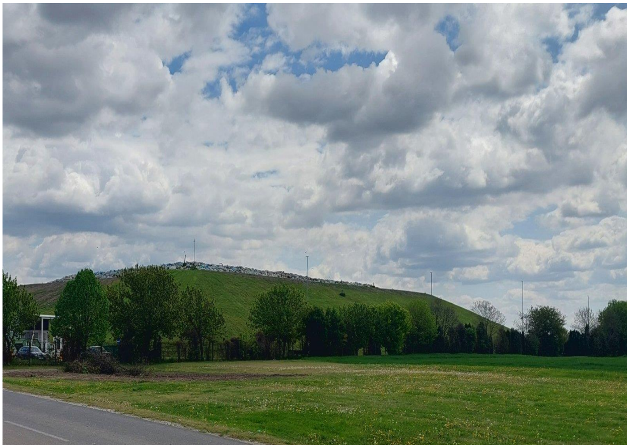
Slika 4. Aktivna odlagališna ploha za neopasni otpad