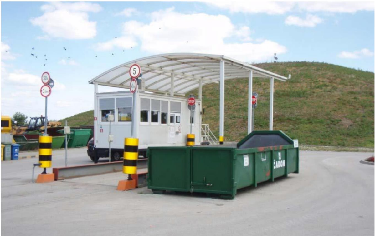
Slika 2. Ulaz na Odlagalište za neopasni otpad Totovec

Ulazno-izlazna zona smještena je u sjevernom dijelu odlagališta i preko nje je osiguran pristup odlagalištu s postojeće ceste te odvijanje cjelokupnog prometa na odlagalište i s odlagališta. U ulazno-izlaznoj zoni obavlja se kontrola otpada po vrstama i količinama, kontrola pratećih listova i deklaracija, prijem i evidentiranje otpada za upućivanje na mjesto odlaganja ili u reciklažno dvorište. Ova zona obuhvaća: objekt za zaposlene kontejnerskog tipa s kolnom vagom za vaganje, evidentiranje i kontrolu otpada, plato za pranje kotača i podvozja vozila, priključna mjesta za elektroopskrbni sustav i vodoopskrbni sustav, dvije garaže sa spremištem te prostor za privremeno skladištenje proizvodnog otpada koji se predaje ovlaštenoj pravnoj osobi na daljnju uporabu i/ili zbrinjavanje [4].