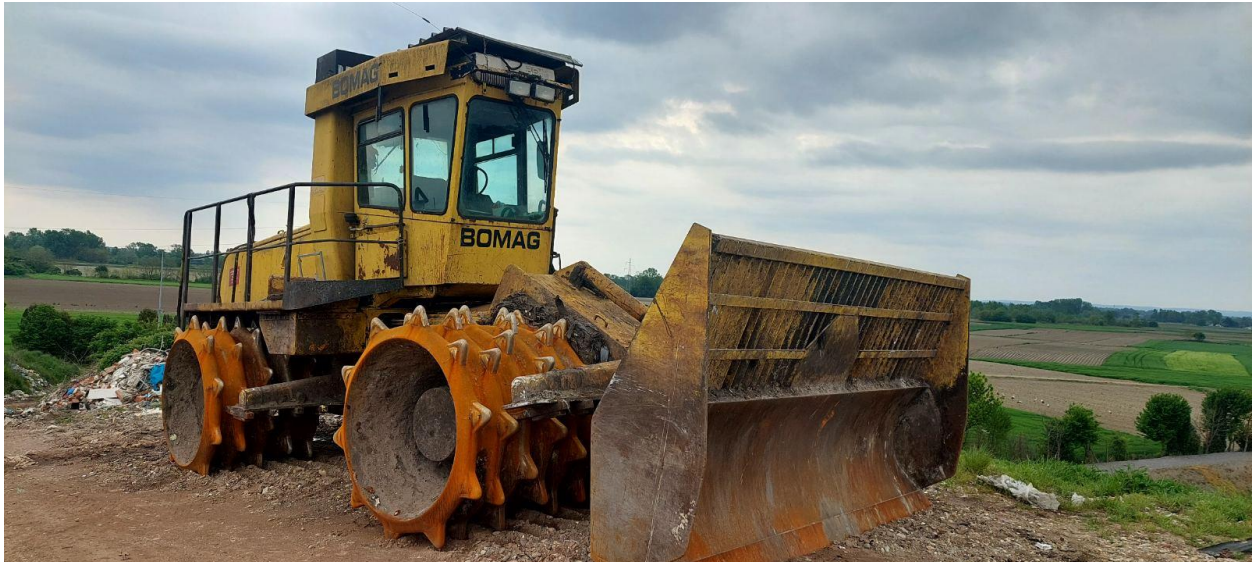
Slika 11. Kompaktor Bomag 601 RB

Navedeni stroj omogućava efikasno komprimiranje i baliranje različitih vrsta materijala, čime se smanjuje njihov volumen i olakšava transport. Ovaj stroj se koristi u industriji reciklaže i otpada kako bi se materijali pripremili za daljnju preradu i ponovno korištenje.