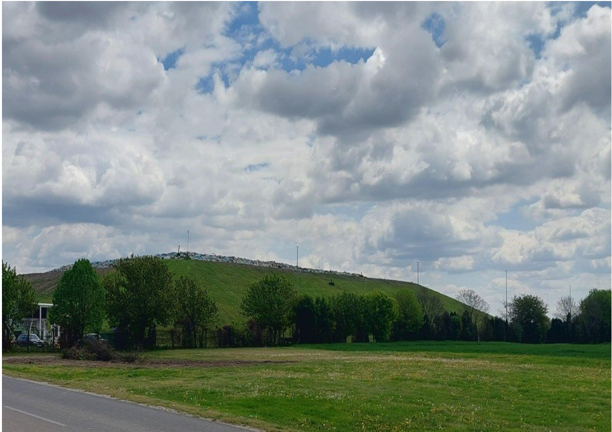
Slika 4. Aktivna odlagališna ploha za neopasni otpad