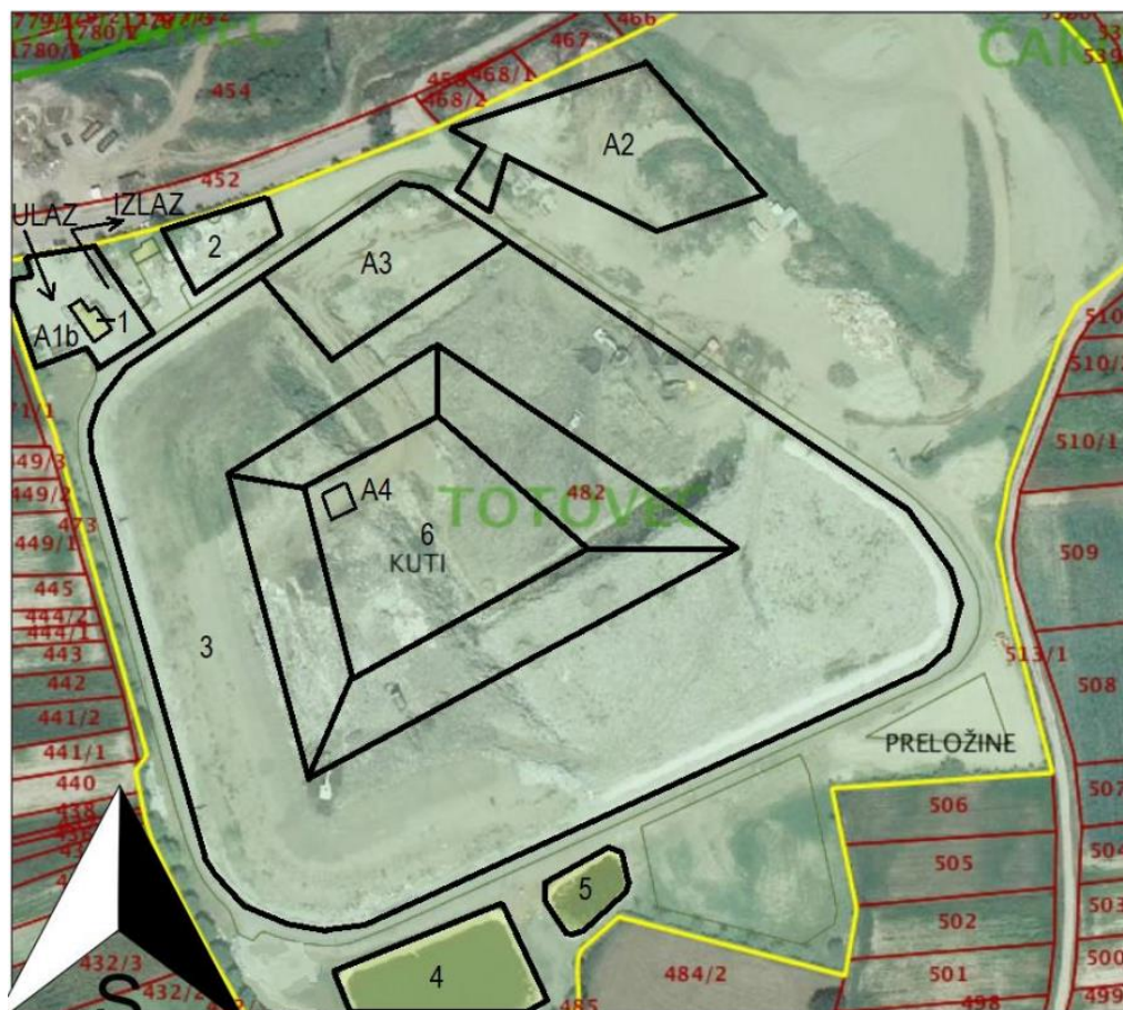
Slika 1. Postojeće stanje Odlagališta za neopasni otpad Totovec