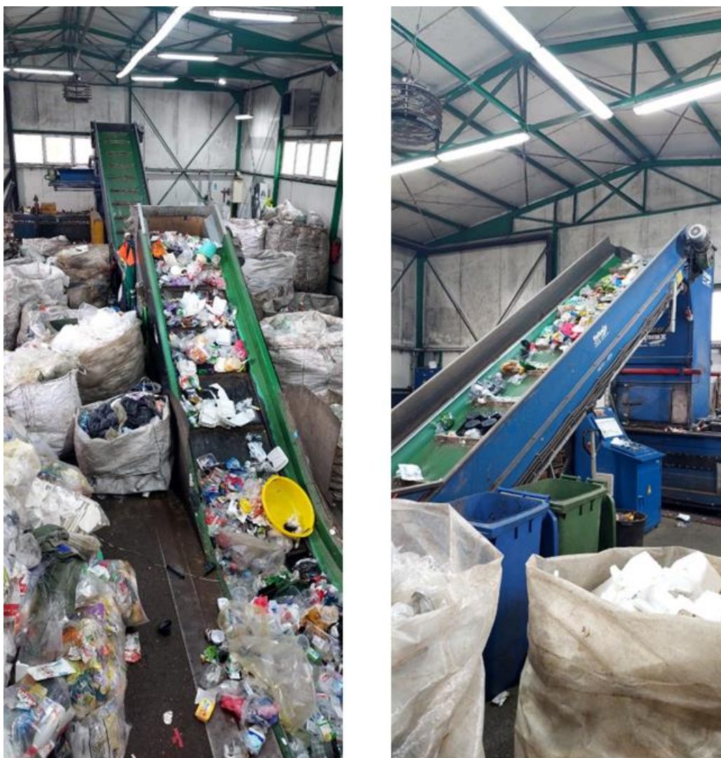
Slika 9. Tehnix podizno/sortirna transportna traka