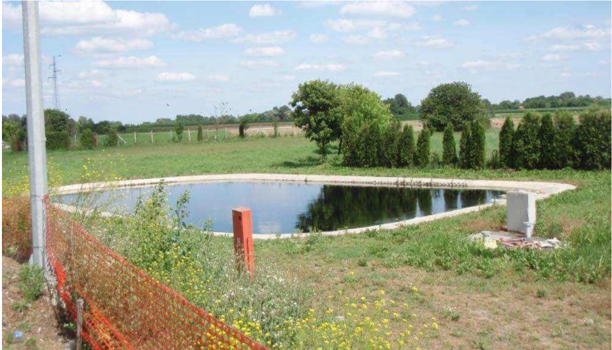
Slika 8. Bazen za procjedne vode