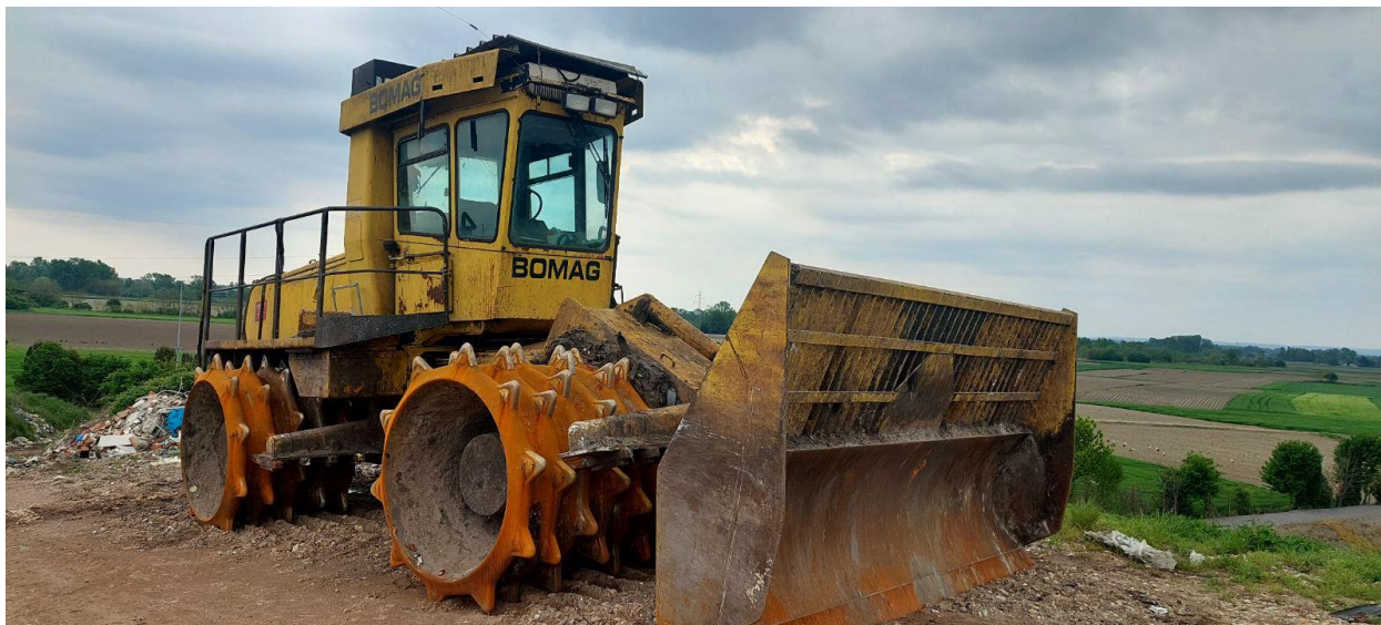
Slika 11. Kompaktor Bomag 601 RB

Navedeni stroj omogućava efikasno komprimiranje i baliranje različitih vrsta materijala, čime se smanjuje njihov volumen i olakšava transport. Ovaj stroj se koristi u industriji reciklaže i otpada kako bi se materijali pripremili za daljnju preradu i ponovno korištenje.