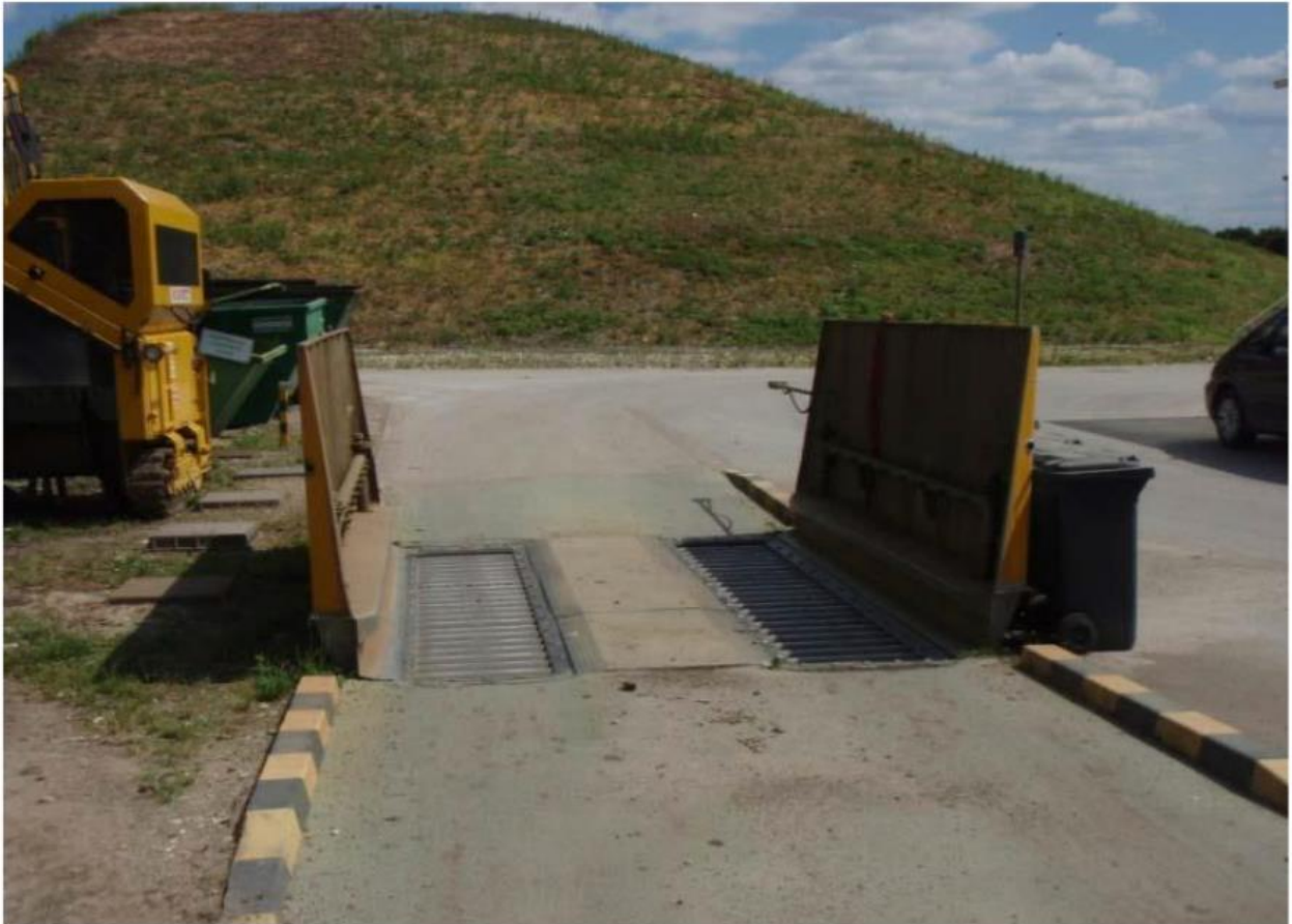
Slika 3. Plato s uređajem za pranje kotača