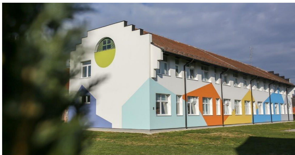
Slika 4 Osnovna škola „Petar Zrinski“ Šenkovec