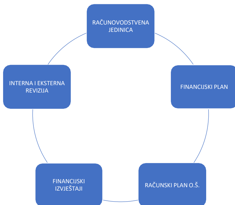
Slika 1 Elementi računovodstva osnovne škole

Na slici 1 prikazani su glavni elementi računovodstva osnovne škole, a to su: računovodstvena jedinica, financijski plan, računski plan škole, financijski izvještaji i interna i eksterna revizija. U daljnjem tekstu navedeni elementi bit će razrađeni.