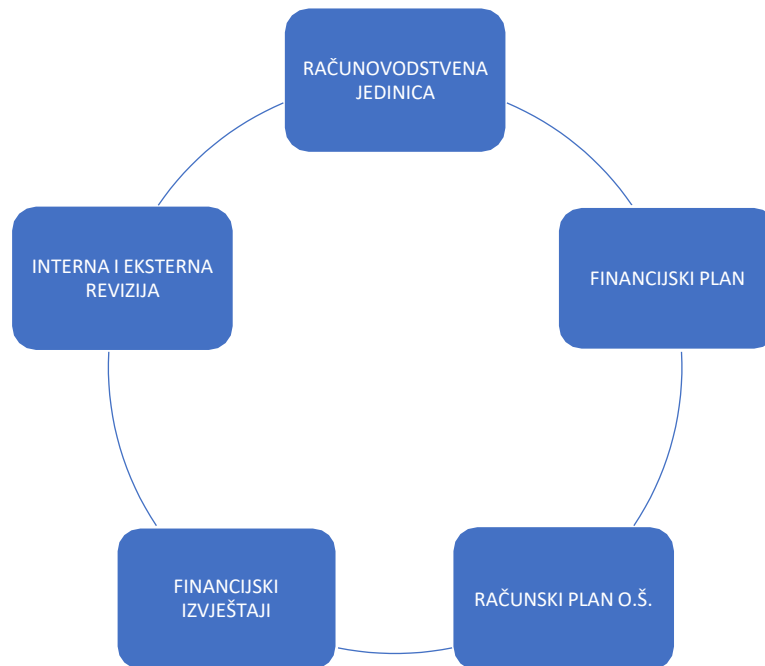
Slika 1 Elementi računovodstva osnovne škole

Na slici 1 prikazani su glavni elementi računovodstva osnovne škole, a to su: računovodstvena jedinica, financijski plan, računski plan škole, financijski izvještaji i interna i eksterna revizija. U daljnjem tekstu navedeni elementi bit će razrađeni.