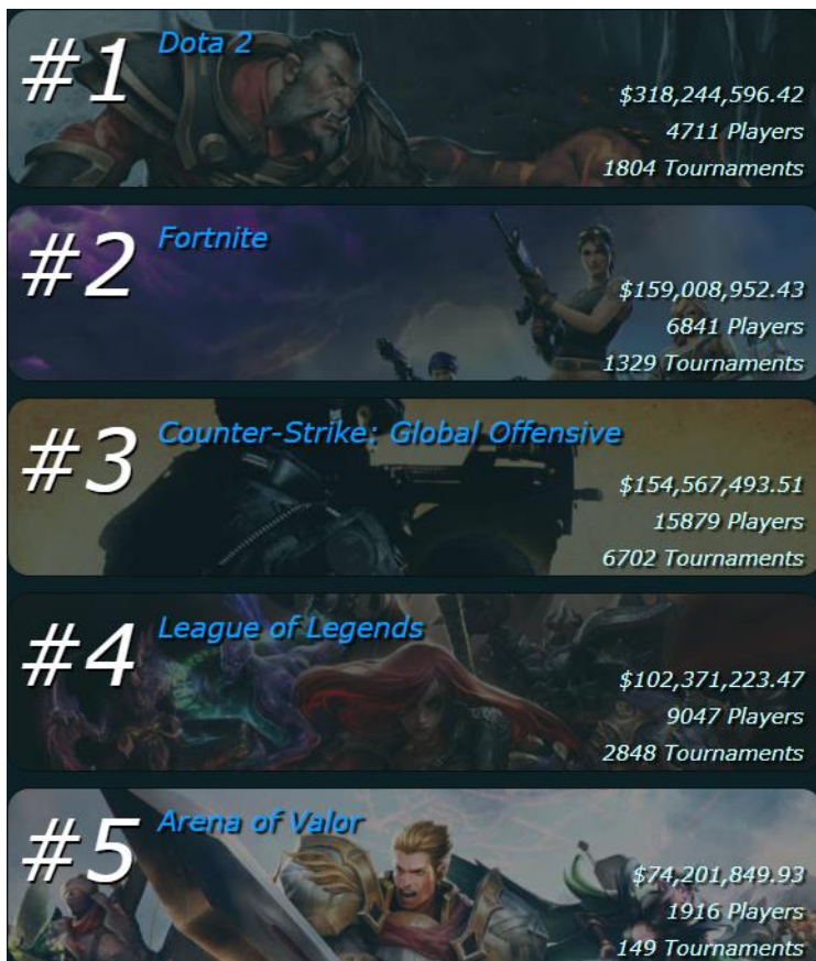
Slika 4. Najpoznatije igre na e-sport natjecanjima