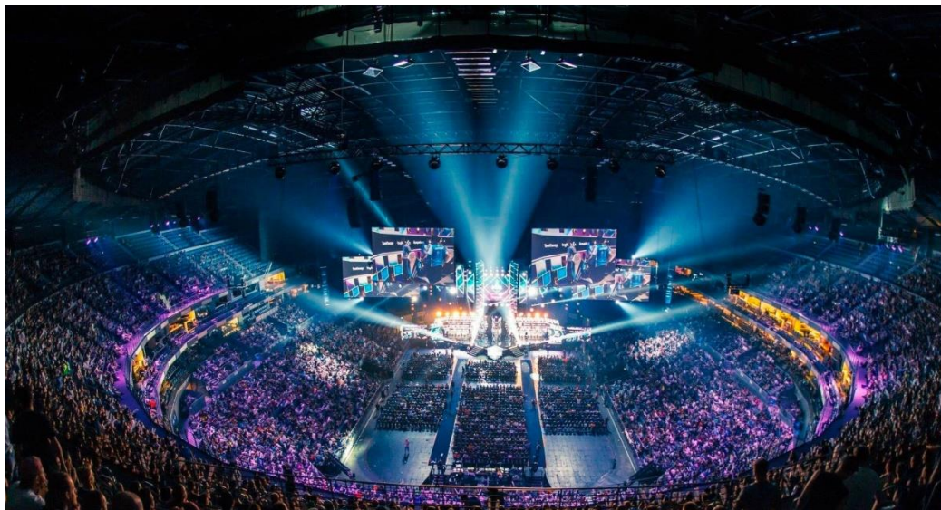
Slika 5. Završnica IEM Katowice