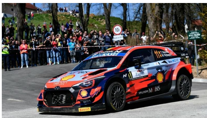
Slika 6. WRC