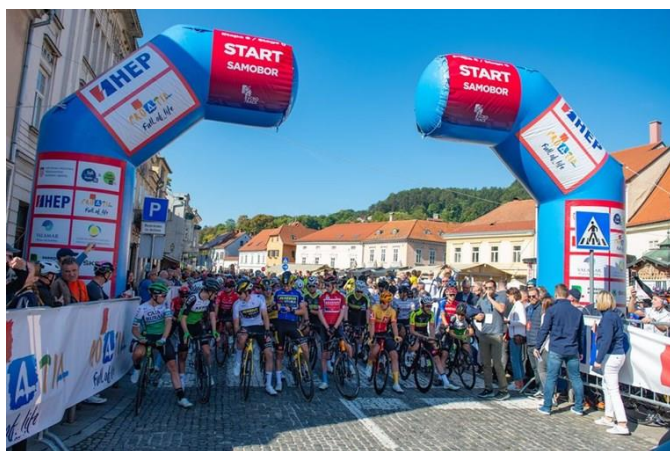
Slika 7. CRO RACE

https://www.zgprsten.hr/sport/kolarec-cro-race-je-sjajna-promocija-zagrebacke-zupanije-ali-i-cijele-hrvatske/ (datum: 20.06.2023.)