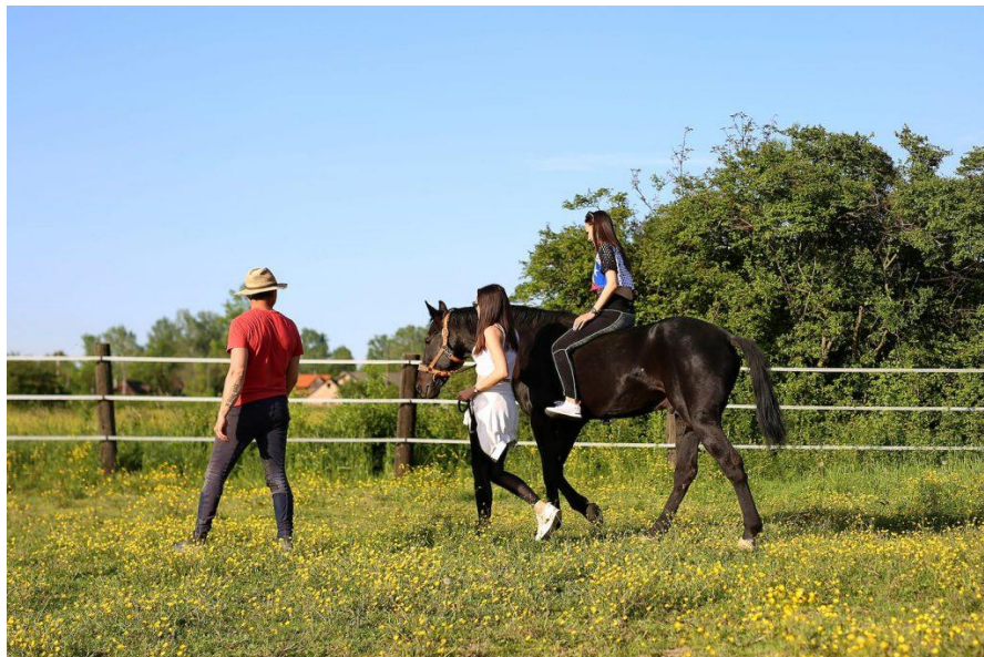
Slika 5. Jahanje u Zagrebačkoj županiji