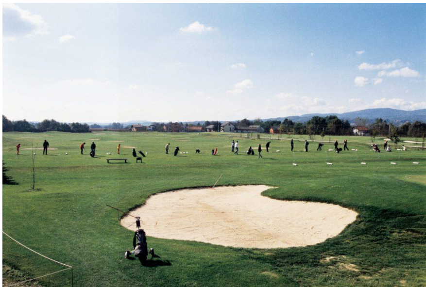
Slika 4. Golf-teren u Zagrebačkoj županiji