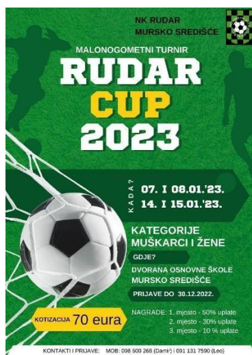
Slika 9. Plakat-poziv na turnir u Murskom Središću