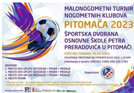
Slika 7. Najava turnira u Pitomači