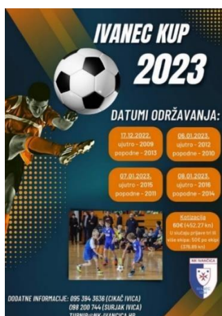
Slika 8. Najava dječjeg turnira u Ivanju