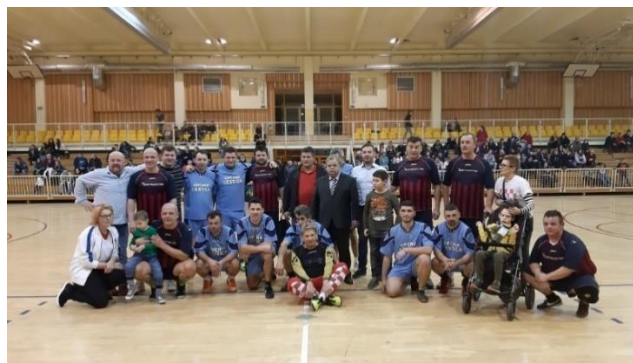
Slika5. Turnir u Cestici