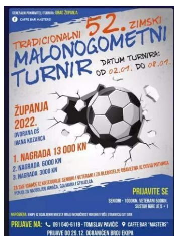
Slika 14. Zimski malonogometni turnir Županja