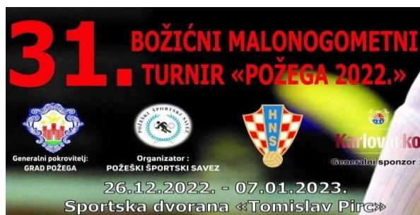
Slika 12. Plakat za najavu turnira u Požegi