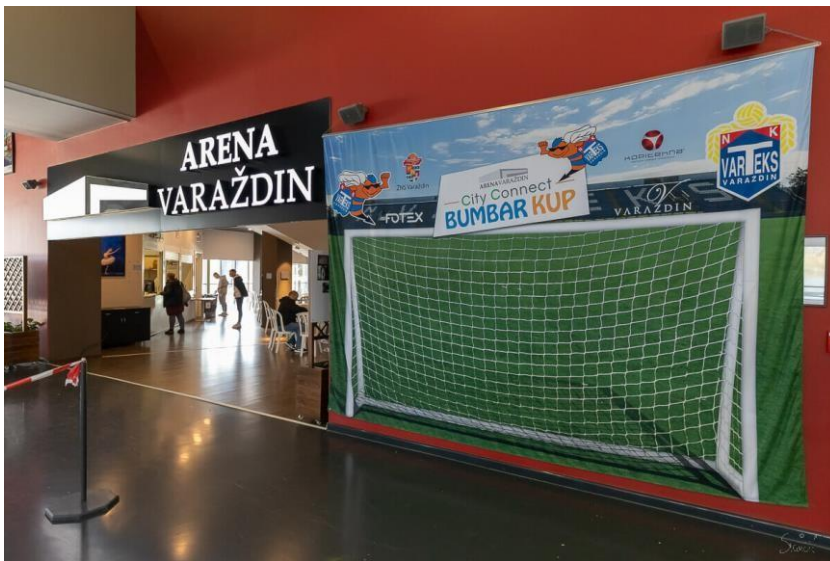
Slika3. Dvorana Arena u Varaždinu