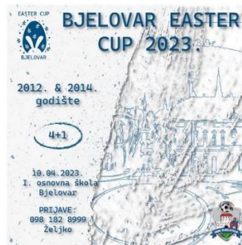
Slika 15. Malonogometni turnir Bjelovar