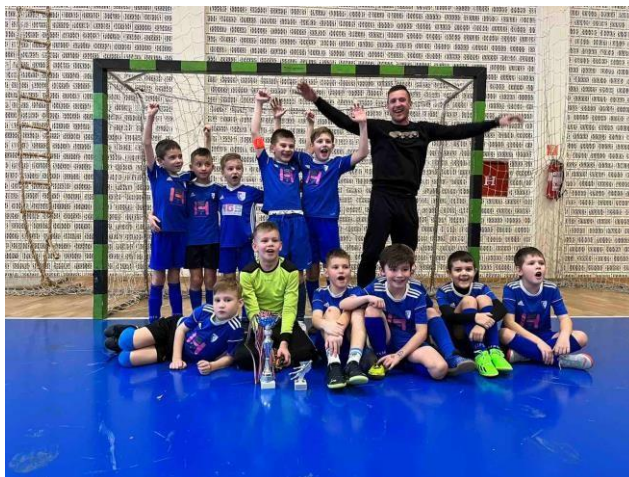
Slika 6. Pionirski sastav na turniru u Vidovcu