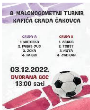
Slika 10. Turnir čakovečkih kafića