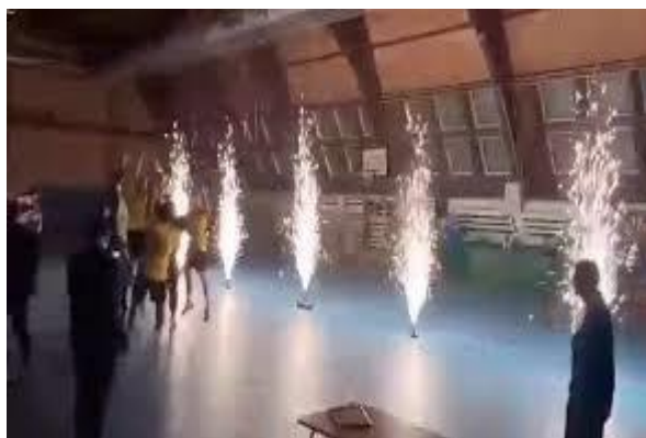
Slika 1. Otvorenje malonogometnog turnira u Slatini