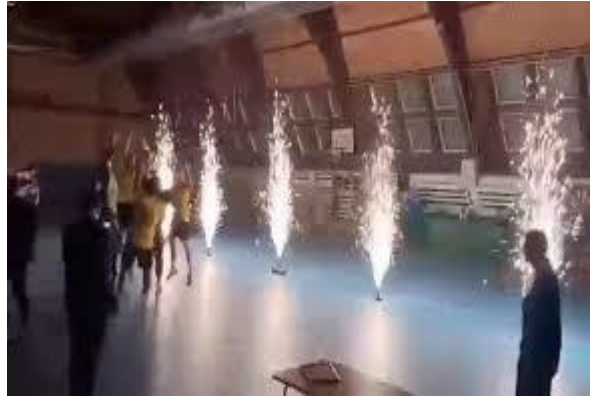
Slika 1. Otvorenje malonogometnog turnira u Slatini