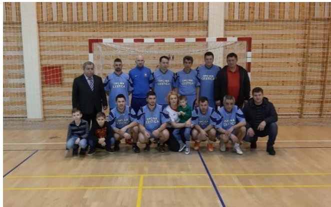
Slika 4. Jedan od polufinalista na lepoglavskom turniru