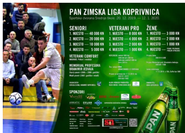
Slika 2. Plakat najave malonogometnog turnira Pan zimska liga u Koprivnici