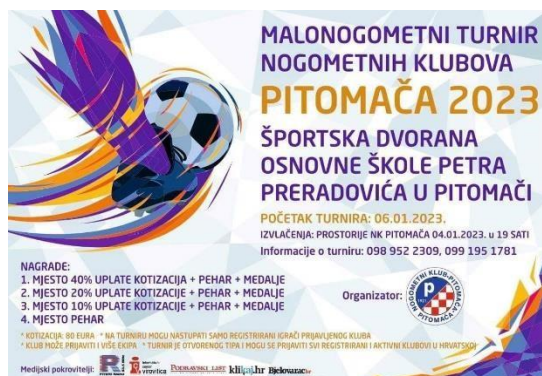
Slika 7. Najava turnira u Pitomači

Izvor: https://www.google.com/search?q=malonogometni+turniri+2023&oq=malonogometni+turniri... pristupljeno 4.06.2023.)