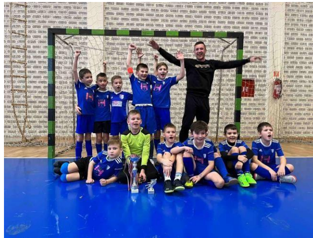
Slika 6. Pionirski sastav na turniru u Vidovcu