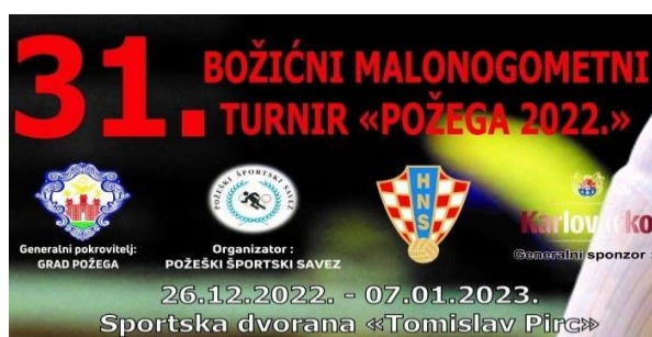
Slika 12. Plakat za najavu turnira u Požegi