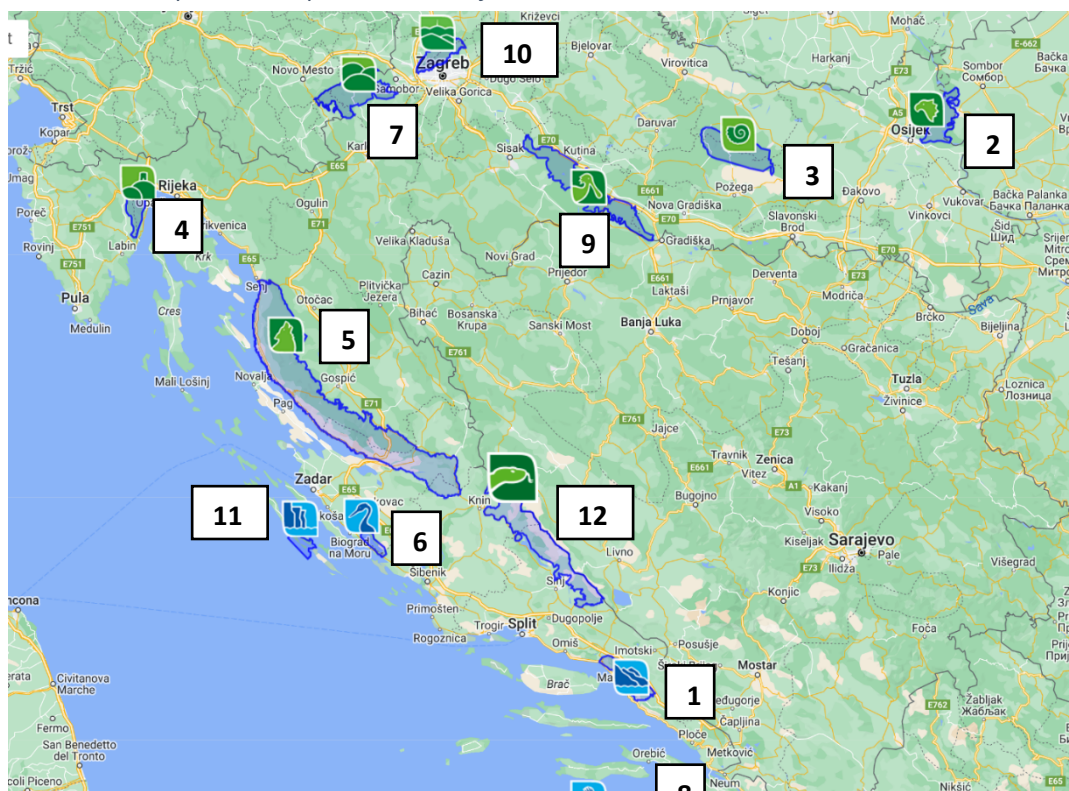
Slika 1. Parkovi prirode u Republici Hrvatskoj