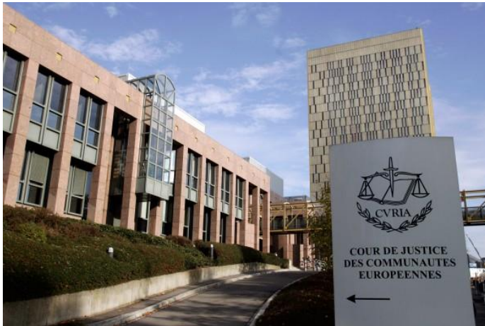
Slika 1. Zgrada Suda pravde Europske unije

Europski sud pravde je institucija koja se najviše razlikuje u odnosu na sve druge institucije, kako po svojoj funkciji, tako i u odnosu prema drugim institucijama Europske unije. Temeljne funkcije Suda pravde su osigurati forum za rješavanje nesporazuma između država članica, osigurati učinkovitu primjenu prava kao i zaštititi prava Europske unije (Bašić, 2015).