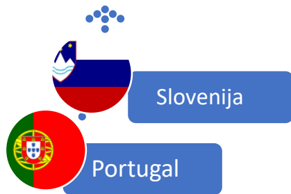
Slika 4. Predsjedavajuće države članice 2021. godine

Portugal je započeo predsjedanje Vijećem Europske unije početkom 2021. godine. „Portugalsko predsjedništvo bilo je usmjereno na promicanje oporavka Europe, klimatizaciju i digitalnu tranziciju, provedbu stupa socijalnih prava Europske unije i jačanje strateške autonomije Europe. Slovensko predsjedništvo bilo je usmjereno na oporavak Europske unije i jačanje njegove otpornosti, promišljanje o budućnosti Europe te jačanje vladavine prava i europskih vrijednosti i povećanje sigurnosti i stabilnosti u europskom susjedstvu.“ ( https://www.consilium.europa.eu/hr/council-eu/presidency-council-eu/timeline-presidencies-of-the-council-of-the-eu/ ).