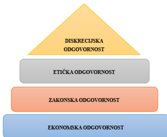
Slika 1 Hijerarhija društvene odgovornosti