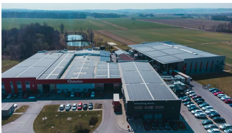
Slika 9 Sunčana elektrana Sobočan

solarnog postrojenja snage 500 kW na krovovima poslovnog kompleksa SOBOČAN u Murskom Središću. Kako bi se povećala energetska učinkovitost proizvodnog procesa i opseg društveno odgovornog poslovanja, zamijenjena je energetski neučinkovita oprema novom, učinkovitijom, te su FLUO rasvjetna tijela u proizvodnom pogonu zamijenjena LED rasvjetom. Također, s ciljem optimizacije potrošnje energije u proizvodnom procesu, implementiran je sustav detaljnog praćenja potrošnje po proizvodnim cjelinama putem pametnih brojila. Kao glavni cilj projekta ističe se smanjene emisije CO 2 proizvodne cjeline za 214,68 t/godišnje ( https://sobocan.hr/eu-projekti , 1.5.2024.). Na slici 9 prikazana je realizacija projekta ulaganje u izgradnju sunčane elektrane Sobočan i mjere energetske učinkovitosti.