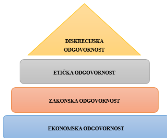
Slika 1 Hijerarhija društvene odgovornosti