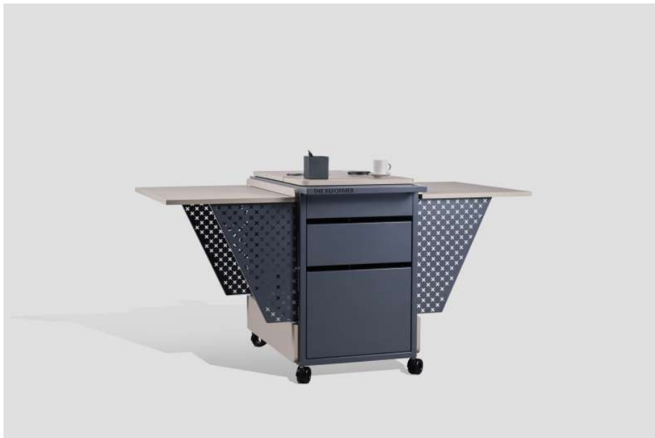
Slika 10 Vizualizacija – The Reformer

To je nova mobilna uredska jedinica pod brendom movo koja predstavlja značajno poboljšanje u odnosu na trenutna rješenja na globalnom tržištu, posebno u tehnološkim i funkcionalnim karakteristikama, dizajnu, tehnologiji i tehnici izvedbe, korisničkoj prihvatljivosti te sinergiji svih funkcionalnosti. Ključna komponenta projekta je implementacija industrije 4.0 u tvrtku, što uključuje robotizaciju i digitalizaciju procesa, čime će se značajno povećati procesna i organizacijska učinkovitost tvrtke Sobočan te stvoriti uvjeti za uspješno lansiranje inovativnog proizvoda na tržište. Ključni rezultati projekta uključuju inovirani proizvodni proces, unaprijeđen logistički proces gotovih dijelova proizvoda (uključujući upravljanje otpremom, pakiranjem i evidentiranjem sadržaja paleta) te stvaranje organizacijskih uvjeta za konkurentnu proizvodnju i uspješnu komercijalizaciju The Reformer (slika 10) mobilne uredske jedinice (Sobočan d.o.o., 2022.).