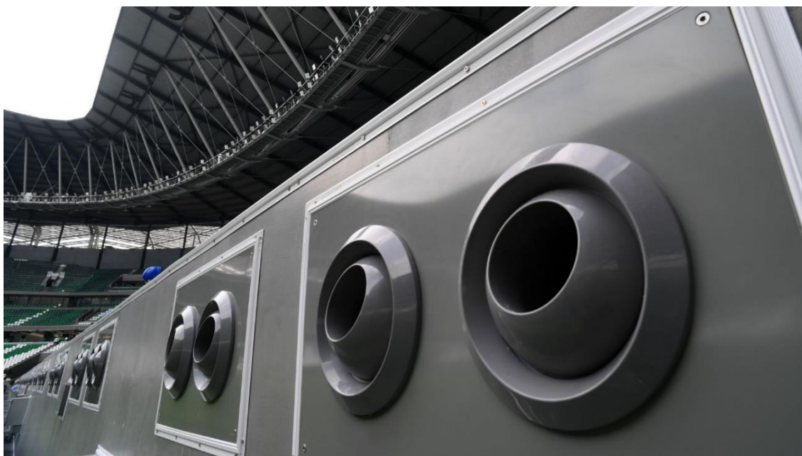
Slika 3. Mlaznice za filtriranje zraka na Stadionu Education City 2022. godine.

Ipak, komfor igrača i gledatelja je unatoč katarskoj pustinjskoj klimi bio zajamčen, većim dijelom zahvaljujući rashladnom sistemu, kojeg je izumio sudanski znanstvenik Saud Abdul Ghani. Ghanijeva tehnologija oslanja se na princip hlađenja isključivo zraka koji se nalazi unutar stadiona. Rashladni sistem Ghanija radi na način da se zrak, koji kruži unutar stadiona, konstantno filtrira kroz mlaznice, koje se nalaze pod tribinama i sa strane stadiona. Sedam od osam stadiona koristilo je Ghanijevu tehnologiju, zbog kojeg su utakmice odigrane na temperaturama ranog proljeća, odnosno između 18 i 24 C, iako su prvi navodi o temperaturama ciljali na 27 C [25]. Sistem kruženja zraka pozitivno je utjecao na održivost; prema riječima organizatora, njegova je održivost i za 40% veća u odnosu na druge sustave klimatizacije, obzirom da cijeli sustav iskorištava katarski solarni potencijal putem solarnih panela [70].