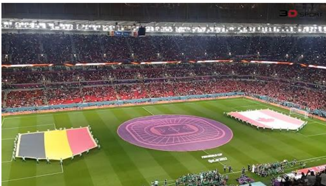
Slika 7. Početak utakmice Belgija-Kanada na stadionu Al-Rayyan 23. studenog 2022.