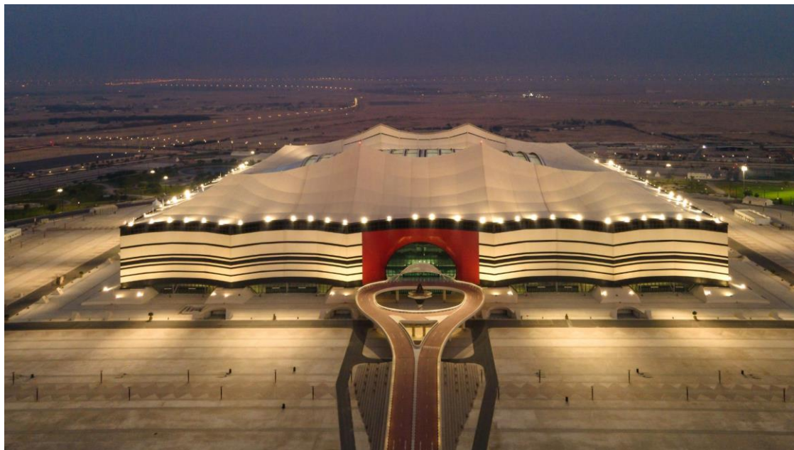
Slika 10. Stadion Al Bayt.

Na Slici 10 prikazan je eksterijer stadiona Al Bayt. Na slici se također može vidjeti djelovanje u potpunosti solarne rasvjete, kao i sam stadion.