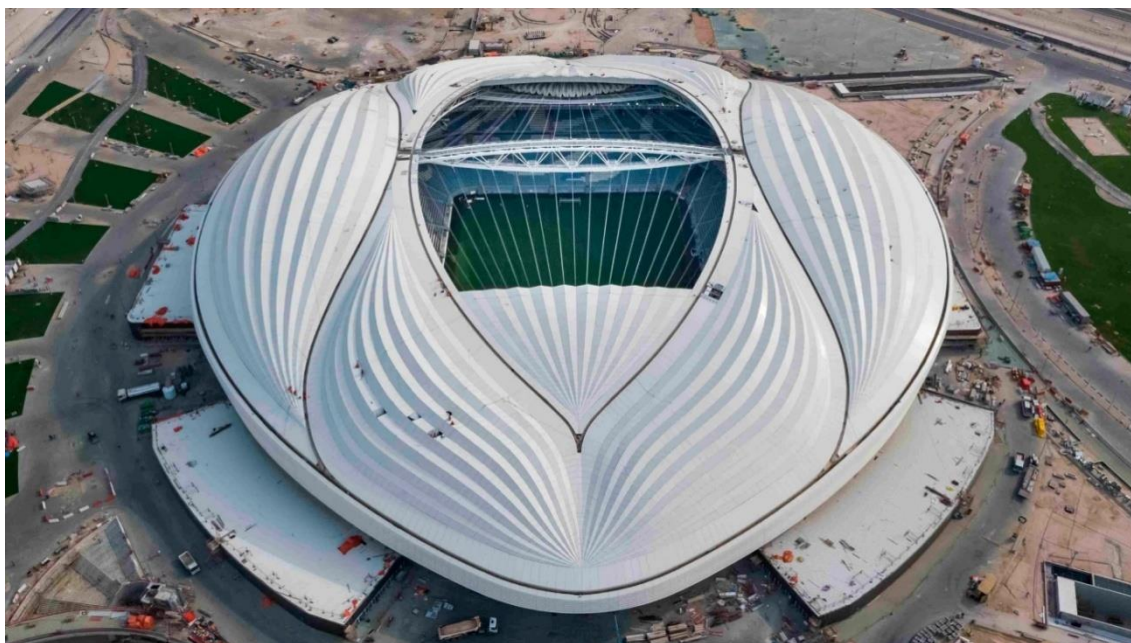
Slika 8. Stadion Al Janoub.

Na Slici 8. prikazan je poznat krov Stadiona Al Janoub, kojeg je projektirala iračko-britanska arhitektica Zaha Hadid. Iako je krov htio prikazati pomorsku povijest mjesta, njegov nezgrapan dizajn postao je popularan na internetu, koji je krov uspoređivao s izgledom ženskih genitalija. Stadion je bio jedan od posljednjih projekata Hadid prije njene smrti 2016. godine.