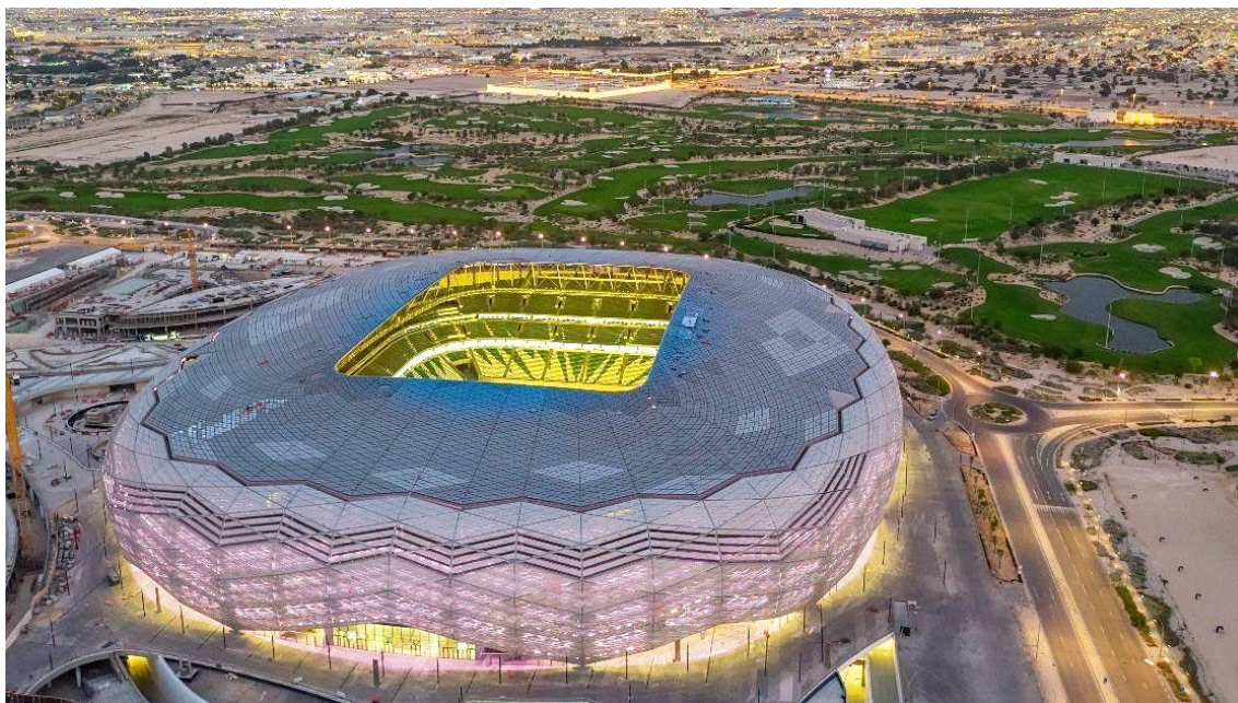
Slika 5. Stadion Education City.

Na Slici 5. nalazi se stadion Education City iz ptičje perspektive; na fotografiji se posebno ističe njegov krov, koji je u večernjim satima osvijetljen, za Katar karakterističnom, ljubičastom bojom.