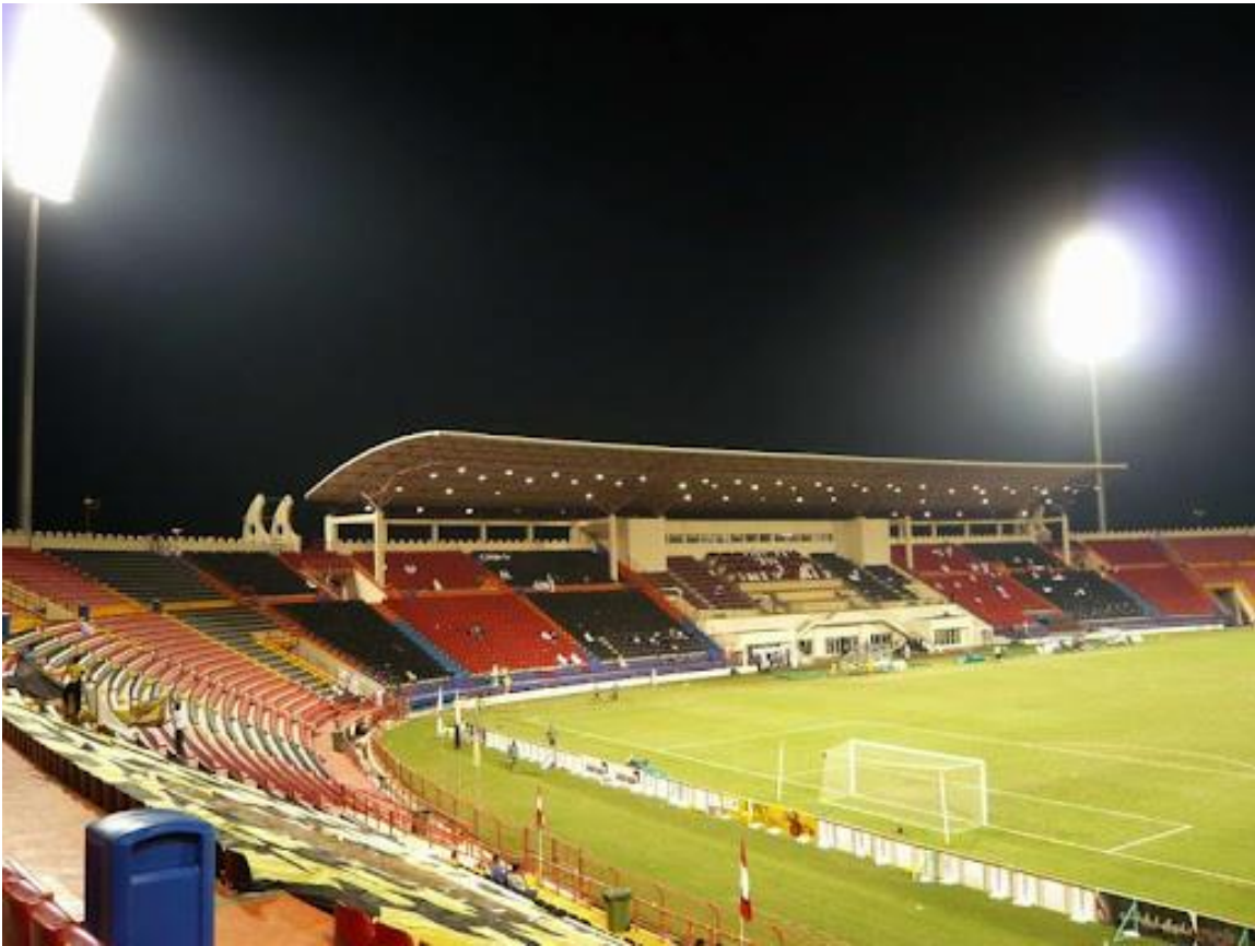
Slika 6. Stari stadion Al-Rayyan, fotografiran 2010. godine.

Slike 6. i 7. pokazuju stari i novi Stadion Al-Rayyan. Kod slika se mogu vidjeti karakteristična crveno-crna sjedala, koja su upotrijebljena kod gradnje novog stadiona.