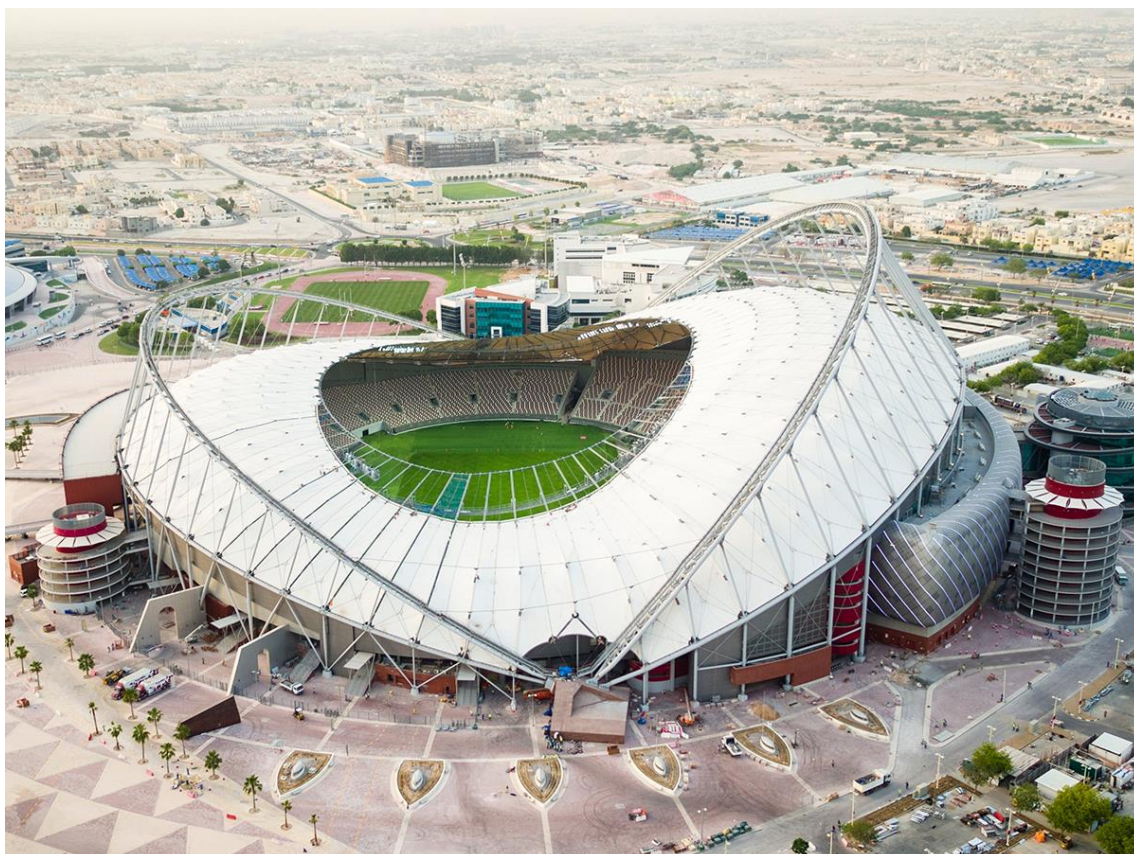
Slika 12. Međunarodni stadion Khalifa.