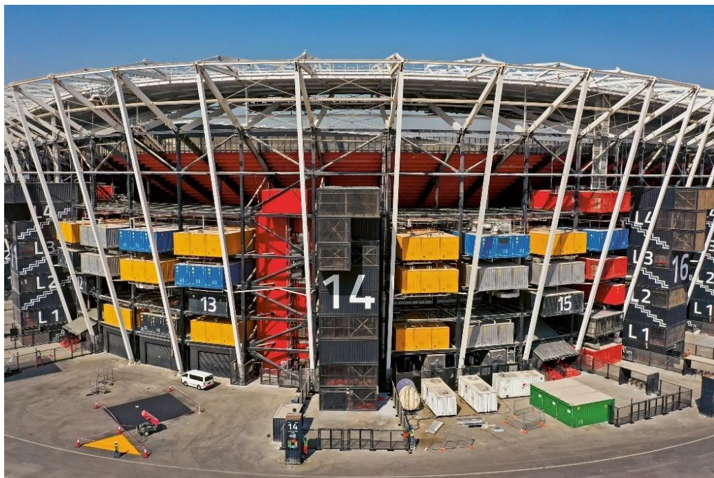
Slika 4. Modularni Stadion 974.

Slikom 4. prikazan je eksterijer Stadiona 974, pri kojem su vidljivi kontejneri kao integralan dio konstrukcije cjelokupnog stadiona. Neobičnu kontejnersku konstrukciju povezuju strukturalne grede.