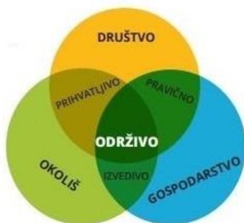
Slika 1. Vennov dijagram održivog razvoja