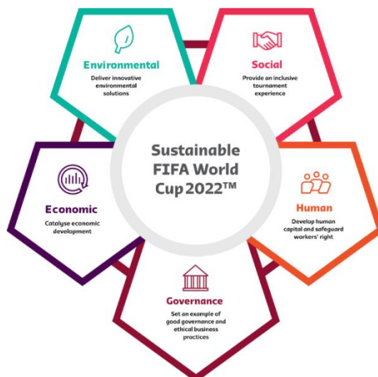
Slika 2. Pet stupova održivog razvoja FIFA-inog svjetskog prvenstva u Kataru.