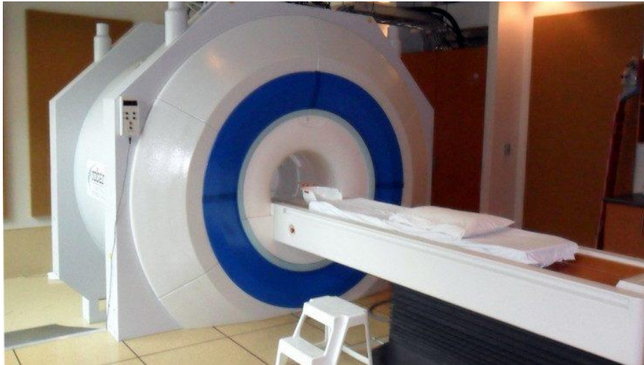
Slika 4 Prikaz fMRI alata neuromarketinga